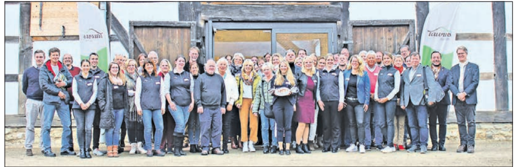
Die Teilnehmer des ersten Tourismustags der Freizeitregion Taunus.

Denn auch in den neun anderen hessischen Destinationen wurde der Prozess zur nachhaltigen Tourismusentwicklung angestoßen. Begleitet werden die Destinationen dabei von den Experten vom Beratungsunternehmen