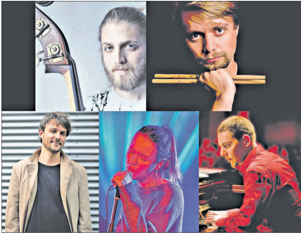
Ein besonderes Weihnachtskonzert unter dem Motto „Es weihnachtet – gar sehr!“ findet am vierten Adventswochenende im Eschborn K statt.