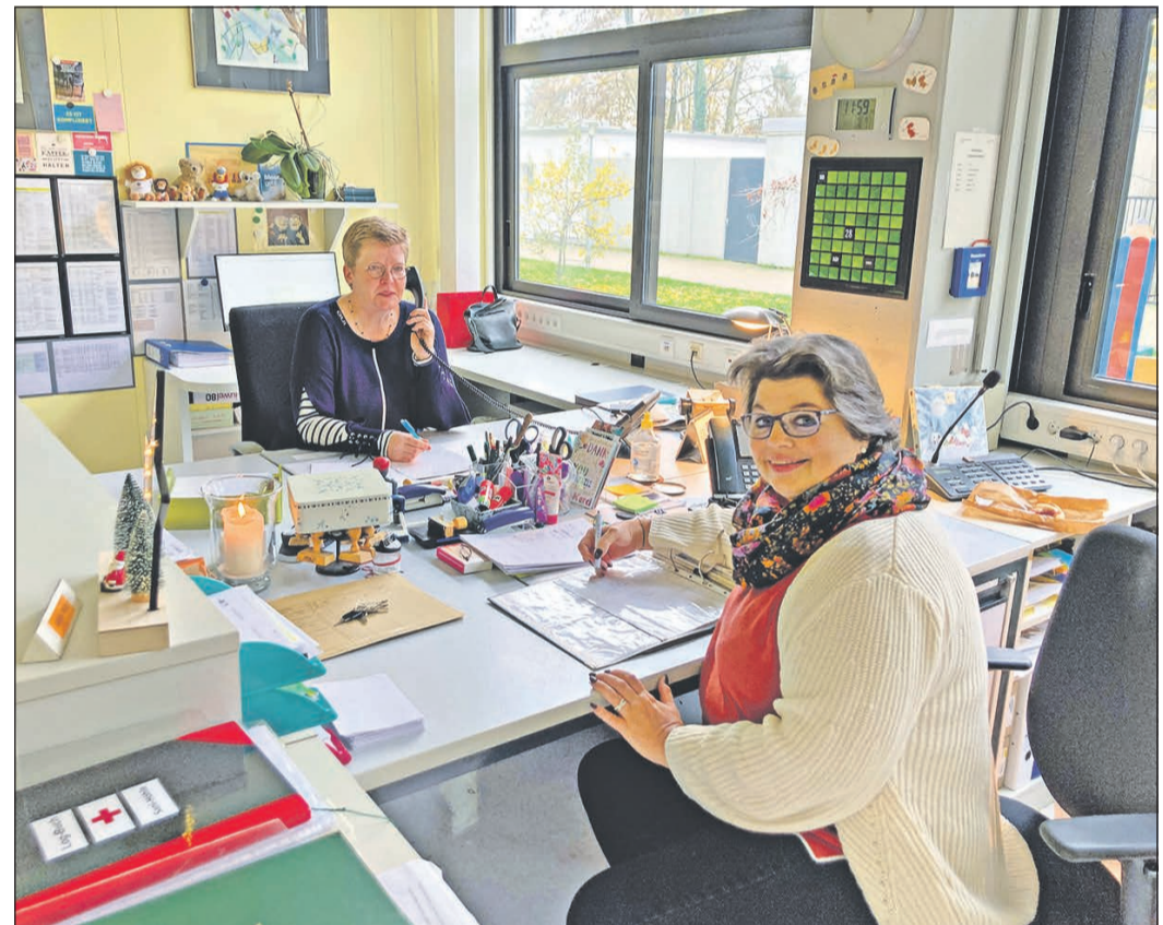
Hier laufen die Fäden für die Vorbereitung des großen Festakts an der Heinrich-von-Kleist-Schule (HvK) zusammen: das Schulsekretariat der HvK.

Weitere Informationen rund um die HvK erhalten Interessierte unter Telefon 06196-95700 oder im Internet unter www.kleist-schule.de.