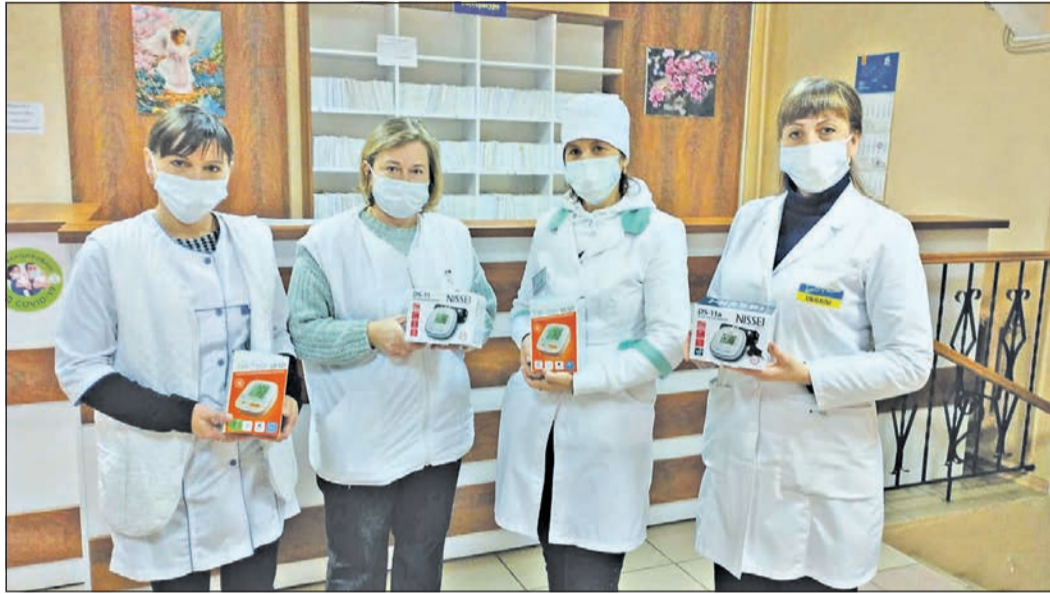
Spenden werden insbesondere für die ukrainischen Kinder gebraucht. Auch medizinische Geräte werden weiter benötigt – vor Ort ist man sehr dankbar.

„Dem Wunsch aus Olkusz kommen wir gerne nach, und die nächsten 1000 Euro, die gesammelt werden, sind für die ukrainischen Kinder und weitere medizinische Geräte bestimmt. Der Winter wird hart für die Menschen in der Ukraine, und die Kämpfe dauern an. Bitte beteiligen Sie sich an der Unterstützung“, sagt Günter Pabst.