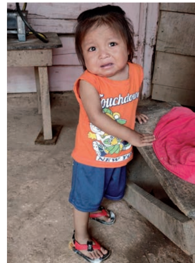
Kleines weinendes Mädchen

Eine Vielzahl von Kleinkindern, jünger als fünf Jahre, ist zum Teil dramatisch unterernährt mit entsprechenden Begleitscheinungen und Spätfolgen. Der chronische Eiweißmangel führt nicht nur zu Untergewichtigkeit, sondern vermindert auch die körpereigene Infekt-Abwehr. Die überwiegend kleinen Kinder erkranken häufiger und schwerer an den sogenannten Bagatellerkrankungen, sie müssen öfter ins Krankenhaus und auch die hohe Kindersterblichkeit ist