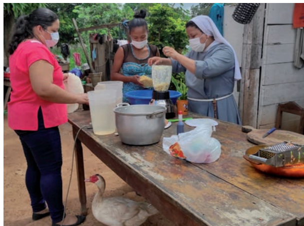
Frauen beim Kochen mit Gemüse