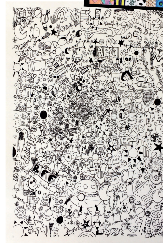
Doodle von Filippa Methfessel