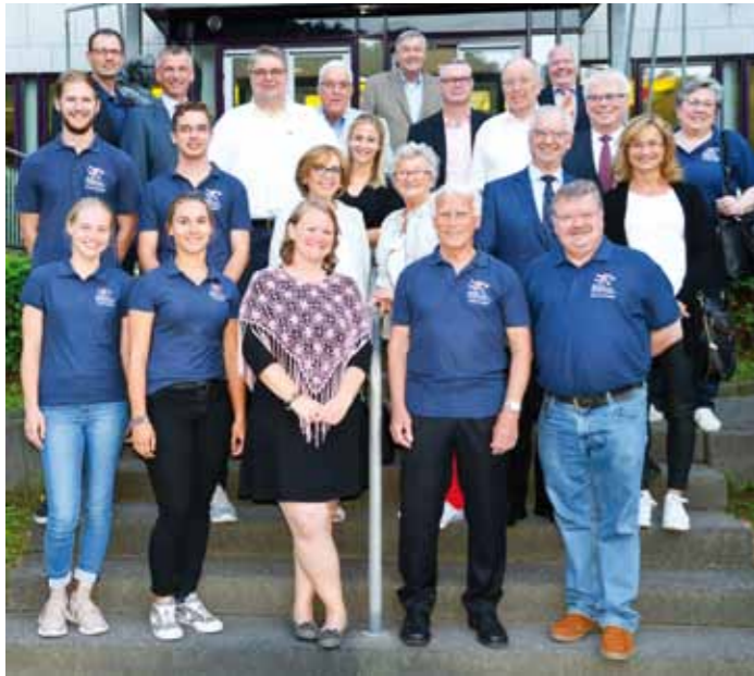
Zusammen mit den Ehrengästen stellte sich der neue gewählte Sportkreis-Vorstand nach dem Sportkreistag vor dem Kreishaus zum Gruppenbild.

Bei dieser Veranstaltung, die alle drei Jahre gemäß Satzung vom Sportkreis-Vorstand organisiert wird, handelt es sich um eine Pflichtveranstaltung für die Vertreter aller Vereine und Fachverbände, was leider von vielen Vereinen offenbar nicht so gesehen wird. Dies ist schon