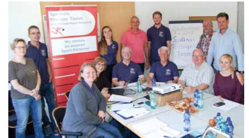
Auf den Zukunftskonferenzen diskutierte der Sportkreis-Vorstand mit Vertretern der Mitgliedsvereine über aktuelle Probleme.