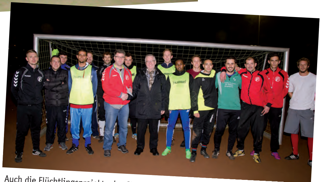
Auch die Flüchtlingsprojekte des SV Wisper Lorch (oben) und des TV Idstein erfuhren Unterstützung durch den Sportkreis.

(z. B. Sportkleidung) zu beseitigen. Dies hat den Hessischen Innenminister dazu angeregt, Geld für sogenannte Sport-Coaches zur Verfügung zu stellen. Die Städte und Gemeinden können jemanden damit beauftragen, genau die oben beschriebene Leistung zu erbringen, nämlich die Flüchtlinge mit den örtlichen Vereinen zusammen zu bringen.