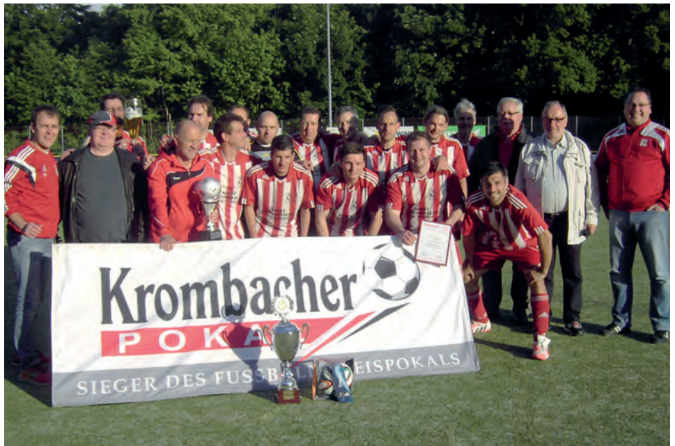
Amtierender Kreispokalsieger bei den Alten Herren ist der SV Heftrich.

Innerhalb des Kreises gibt es vier Vereine mit ausschließlich türkischem Migrationshintergrund wobei in Aarbergen der Verein seinen Spielbetrieb im Jahr 2015 einstellen musste. Das gilt auch für wenige andere Vereine, aber gerade in Aarbergen haben fünf Vereine ihren Spielbetrieb im Jugend- und Seniorenbereich konzentriert und spielen heute in einem Verein gemeinsam. In Schlangenbad gibt es zwei Spielgemeinschaften von vier Vereinen. Sie wollen sich auch im Seniorenbereich zu einer gemeinsamen Spielgemeinschaft finden. Spielgemeinschaften gibt es in Rauenthal und Waldems. Weitere werden evtl. folgen und es wird auch im Jugendfußball zu