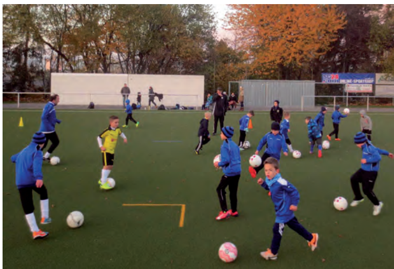
Auch das DFB-Mobil machte schon bei den Jugendfußballern des TSV Bleidenstadt Station.

Der Verein nutzt das Sportfeld Röderweg mit Kunstrasen und Leichtathletikanlagen, die Sporthallen im Sport- und Jugendzentrum und am Gymnasium in Taunusstein sowie die Turnhalle der