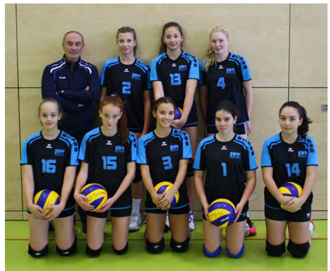
Die Volleyball-Mannschaft der U16 weiblich ist nur eine von vielen Volleyball-Teams im TSV Bleidenstadt.

Heute besteht der TSV aus acht Abteilungen (Badminton, Fußball, Handball, Judo/Ju-Jitsu, Rhönrad, Tischtennis, Turnen und Volleyball). Wie in allen Vereinen wird es immer schwieriger, die vielen benötigten ehrenamtlichen Mitarbeiterinnen und Mitarbeiter zu gewinnen. Beitretende