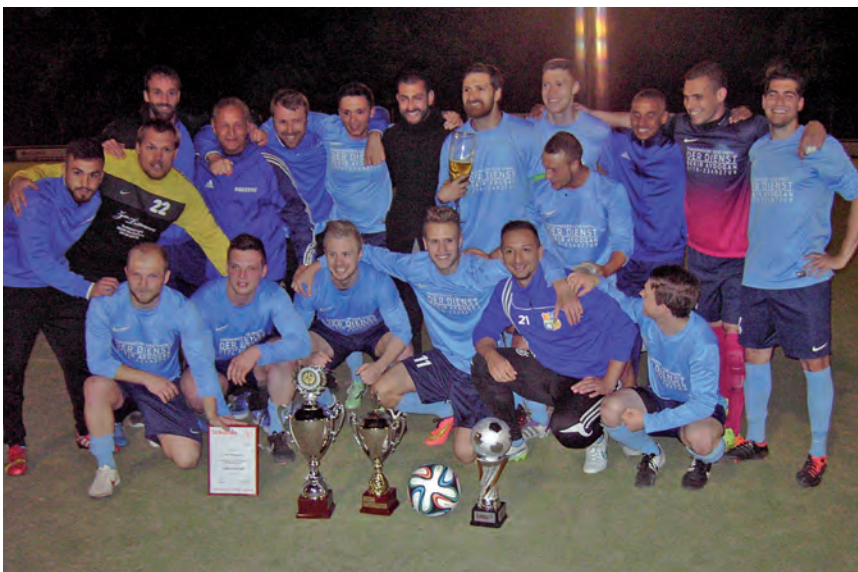
Amtierender Kreispokalsieger ist die Mannschaft der TSG Wörsdorf.

Waren über Jahrzehnte bis auf wenige Naturrasenplätze die ungeliebten Hart- oder Rotgrasplätze die Normalität im Rheingau-Taunus-Kreis, so hat sich das seit den 1990er Jahren doch erheblich verändert. Mit dem Aufkommen der Kunstrasenplätze, mit denen sich immer mehr Städte und Gemeinden anfreunden konnten, hat sich Qualität der Spielflächen erheblich verbessert, so dass man heute sagen kann, dass die neun Vereine, die noch auf einem Hartplatz spielen müssen, ge-