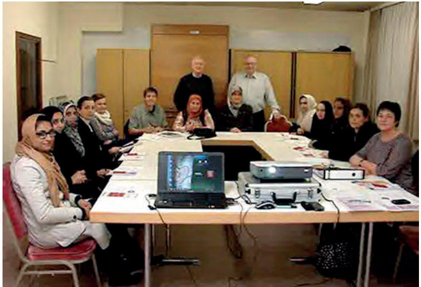
Für die angehenden Übungsleiterinnen fand eine Informationsveranstaltung im Rüdeshheimer Rathaus statt.