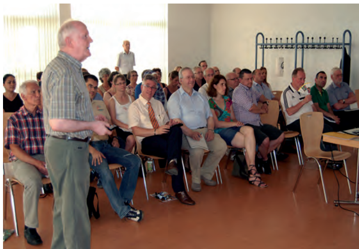
Die Auftaktveranstaltung für den Bereich Untertaunus in der Aartalhalle in Taunusstein-Neuhof stieß bei den Vertretern der Vereine auf sehr großes Interesse.

Rahmen des „Tages der offenen Moschee“ die pakistanische Gemeinde. Beide Gemeinden verfügen über Jugendabteilungen, so dass sich für die Sportjugend Hessen die Möglichkeit