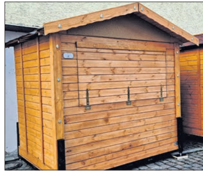
Marktbude in geschlossenem Zustand mit Nummerierung (unten rechts) und Logo der Stadt Eppstein (oben links). Der Giebel wurde vom Bauhof mit einer Fläche aus Kork ausgestattet, an die Beschilderungen angebracht werden können. Die von der Stadt angebrachten Haken können zum Schmücken der Bude verwendet werden.

Die Buden erfüllen sämtliche aktuellen von übergeordneten Behörden vorgegebenen Vorgaben. „Die Marktbuden haben den Praxistest bestanden“, so Bürgermeister Alexander Simon. Der Magistrat hat deshalb in seiner Sitzung vor Weihnachten beschlossen, weitere Buden anzuschaffen und hierfür Geld in Höhe von rund 20000 Euro bereitgestellt. Neben den vorhandenen fünf Buden werden