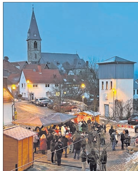
Glühwein-Umtrunk SG Bremthal bei klirrender Kälte auf dem Dorfplatz