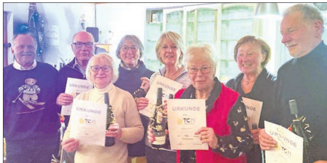
So viel Vereinstreue – Rund ein halbes Jahrhundert spielen langjährige Mitglieder des TC 71 Bremthal schon auf den Plätzen des Vereins.