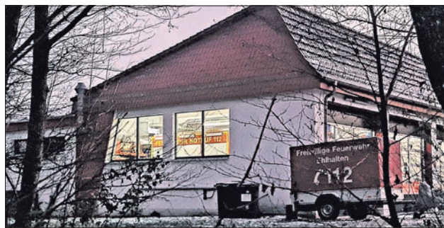
Das Feuerwehrhaus Ehlhalten ist energetisch verbessert worden.

Im Feuerwehrhaus in Ehlhalten haben in den vergangenen Wochen Sanierungsarbeiten stattgefunden. Die Stadt hat rund 48000 Euro investiert. So wurden mehrere Fenster und eine Tür ausgetauscht. Auch die Rollläden und die jeweiligen Motoren sind erneuert worden. Ausgetauscht wurden Fenster in der Fahrzeughalle, im Mannschaftsraum und in der Werkstatt.