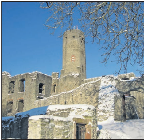
Burg Eppstein im Winter – an Weihnachten ist sie geöffnet.