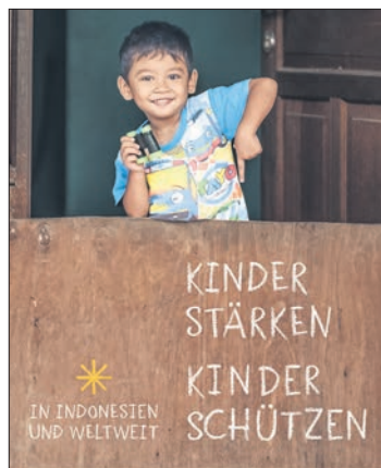
Plakat zur Aktion 2023

Bis spätestens 28. Dezember 12 Uhr nimmt auch das Pfarrbüro Besuchswünsche entgegen: pfarrbuero@katholisches-eppstein.de oder per Telefon unter 32046. Bei allen Anmeldungen unbedingt Namen, Anschrift und Telefonnummer angeben, damit die Sternsinger das richtige Haus finden.