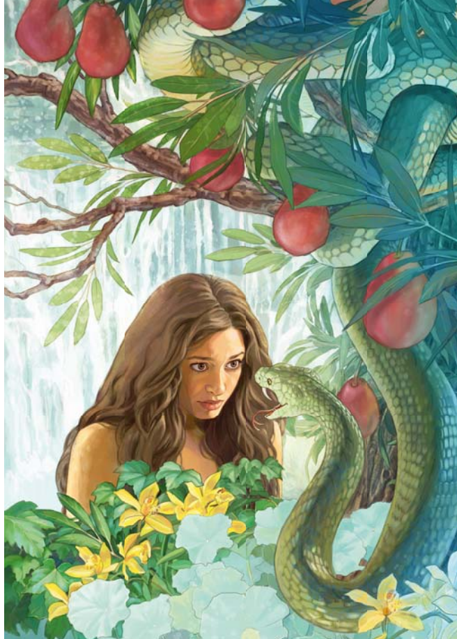
Der Teufel zieht den Namen Jehovas seit Tausenden von Jahren in den Schmutz (Siehe Absatz 3, 4)

5. Wie kannst du für Wahrheit und Gerechtigkeit eintreten?