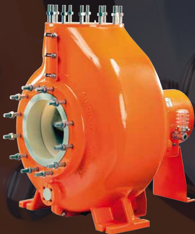
MUNSCH NPC 300-250-315: Gepanzerte Pumpe mit Gleitringdichtung; Förderstrom bis 1200 m 3 /h; Förderhöhe bis 30 m

Haupt-Pumpenmaterialien: PP / PE-UHMW / PVDF