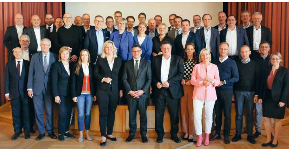
Zum Abschluss der Klausurtagung fanden sich noch einmal alle Abgeordneten, Staatssekretäre und Minister für ein Gruppenbild zusammen.

E nde Oktober war die CDU-Fraktion im Hessischen Landtag zu einer zweitägigen Klausurtagung ins nordhessische Bad Wildungen zusammengekommen, um gemeinsam mit dem Ministerpräsidenten Boris Rhein und den Mitgliedern der Landesregierung den Doppelhaushalt für die Jahre 2023 und 2024 zu beraten und inhaltliche Weichenstellungen vorzunehmen.