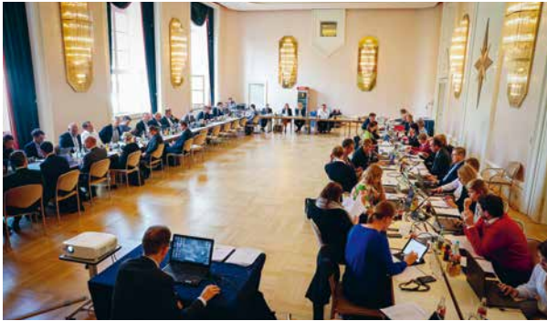
Intensive Beratungen des Doppelhaushalts mit den 40 Abgeordneten, Staatssekretären, Ministern sowie den Mitarbeitern der Fraktion.