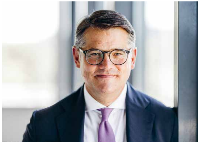
Hessens CDU-Landeschef Boris Rhein

O pposition wirkt – wenn sie im Rücken starke unionsgeführte Landesregierungen wie die hessische hat. Jüngstes Beispiel dafür ist die Reform von Hartz IV, in der irreführenden PR-Sprache der Ampelkoalition ab demnächst „Bürgergeld“ genannt. Mit hartnäckiger, aber fairer Oppositionsarbeit ist es uns gelungen, die größten Irrtümer der Bundesregierung zu korrigieren – zum Wohle der Allgemeinheit.