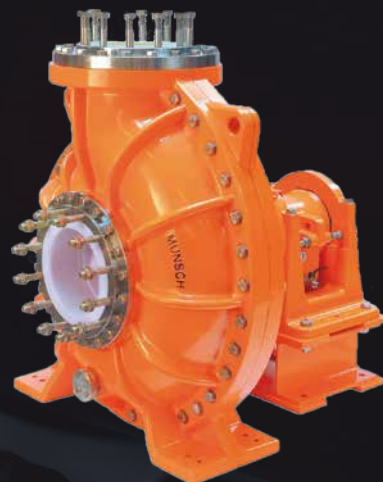
MUNSCH NPC MAMMUT: Gepanzerte Pumpe mit Gleitringdichtung; Förderstrom bis 5000 m 3 /h; Förderhöhe bis 40 m