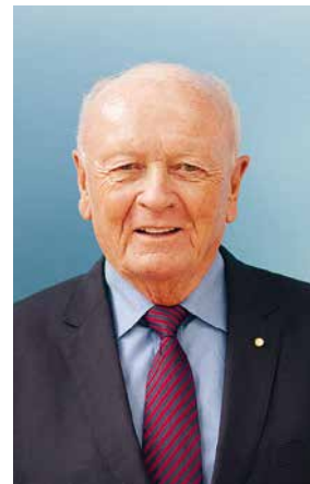
Besonderer Moment im Rathaus: Die Stadt Wiesbaden ehrte den CDU-Politiker Horst Klee für fünf Jahrzehnte politisches Engagement.