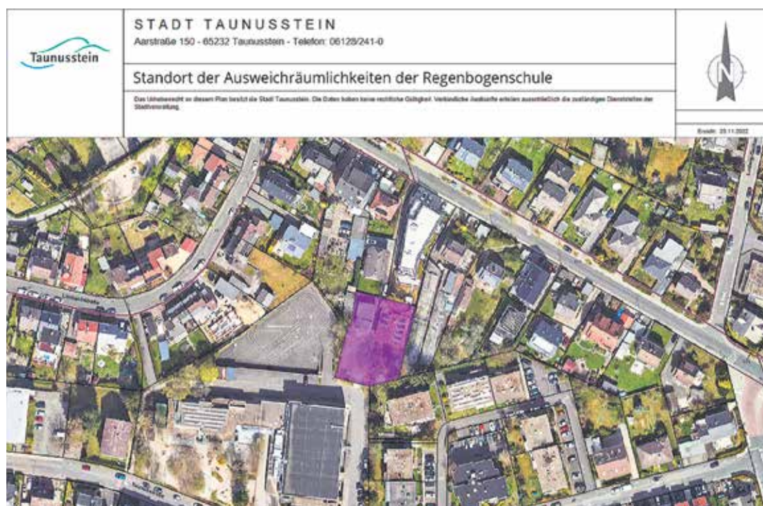
Ausweichstandort der Regenbogenschule.