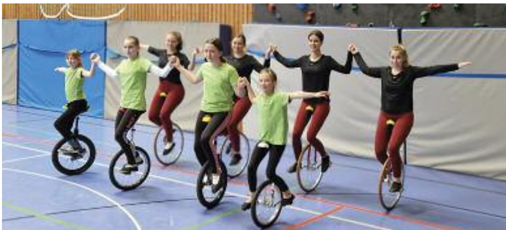
Foto: erfolgreiche Sportlerinnen des JSV Neuenschmidten - siehe links!