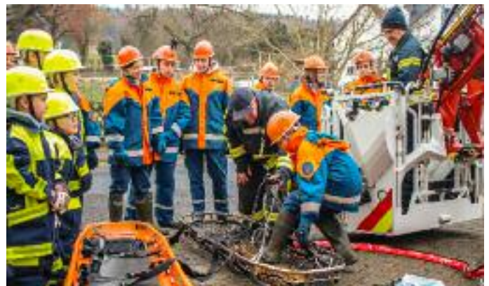
Die Kameraden der Feuerwehr Wächtersbach zeigen den Jugendlichen die Geräte auf der Drehleiter

für einige Minuten über dem Boden, während die Wächtersbacher Kräfte die Besonderheiten einer solchen Einsatzsituation erläuterten. Kaum vom Hof, erklang für alle Anwesenden der Alarm für den finalen Einsatz Nummer fünf. Zwei Holzbauten brannten in voller Ausdehnung und die wichtige Wasserversorgung musste über eine lange Strecke aufgebaut werden. Unter den Augen einiger Zuschauer löschten die Nachwuchskräfte die Brände. Bei einer Bratwurst konnten sich alle für die erbrachte Leistung belohnen und auch noch einige Tage später werden die aufregenden Stunden des Berufsfeuerwehr-Tages für schöne Erinnerungen bei den Mitgliedern der Feuerwehr Neuenschmidten sorgen.