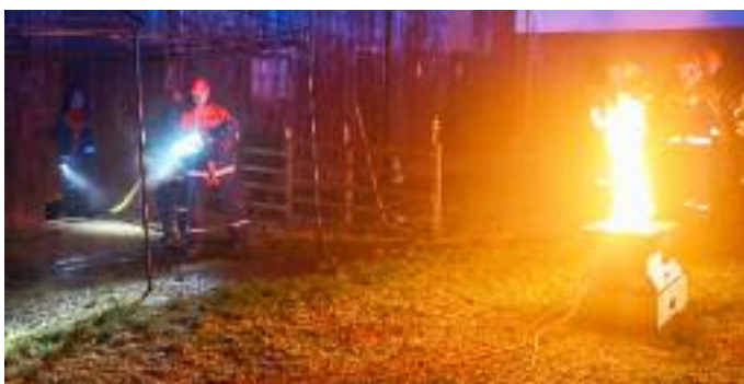
Wasser marsch: Die Flammen aus dem Fire-Trainer waren für die Nachwuchskräfte eine gute Übung.