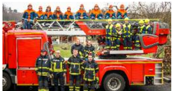
Die neun Mitglieder der Jugendabteilung und fünf Mitglieder der Kinderabteilung mit den Wächtersbacher Kräften (links) und den Betreuern der Feuerwehr Neuenschmidten

für einige Minuten über dem Boden, während die Wächtersbacher Kräfte die Besonderheiten einer solchen Einsatzsituation erläuterten. Kaum vom Hof, erklang für alle Anwesenden der Alarm für den finalen Einsatz Nummer fünf. Zwei Holzbauten brannten in voller Ausdehnung und die wichtige Wasserversorgung musste über eine lange Strecke aufgebaut werden. Unter den Augen einiger Zuschauer löschten die Nachwuchskräfte die Brände. Bei einer Bratwurst konnten sich alle für die erbrachte Leistung belohnen und auch noch einige Tage später werden die aufregenden Stunden des Berufsfeuerwehr-Tages für schöne Erinnerungen bei den Mitgliedern der Feuerwehr Neuenschmidten sorgen.