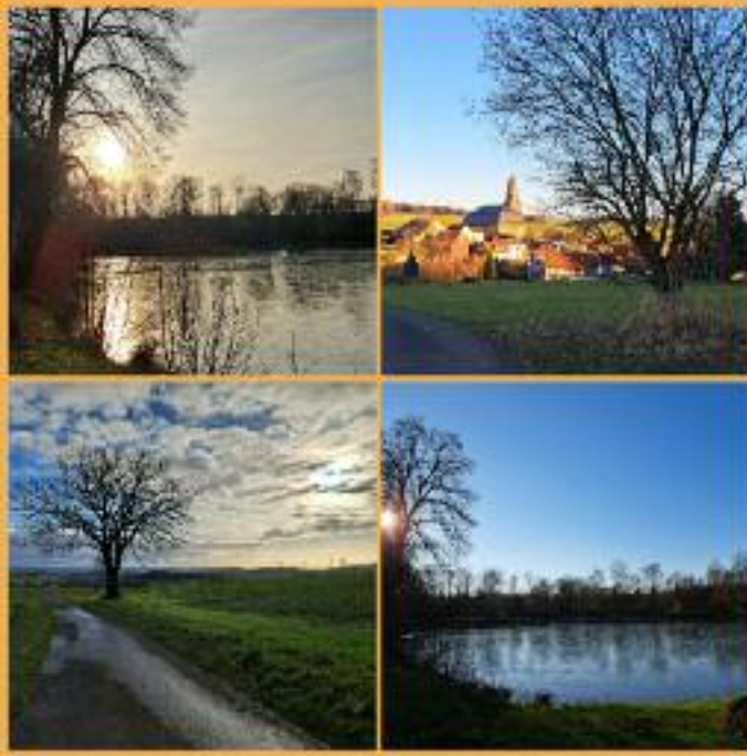
Foto oben: Die ersten Sonnenstrahlen des Jahres 2023 lockten viele Spaziergänger in die Natur. Diese konnten Unterreichenbach von seiner schönsten Seite entdecken und das frühlinghafte Wetter genießen. Der Ortsbeirat Unterreichenbach wünscht allen ein schönes Wochenende.