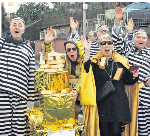
An den Gold-Fälscher von Gusbach erinnerte der Heimat- und Geschichtsverein.