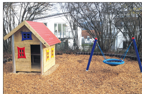
Neue Spielgeräte für Kleinkinder in Bremthal.

Die Ökumenische Bücherei in der Pfarrscheune Ehlhalten öffnet dienstags von 16 bis 17.30 Uhr. Die Bücherei in Niederjosbach im Gemeindezentrum Am Honigbaum ist dienstags von 16 bis 17 Uhr geöffnet.