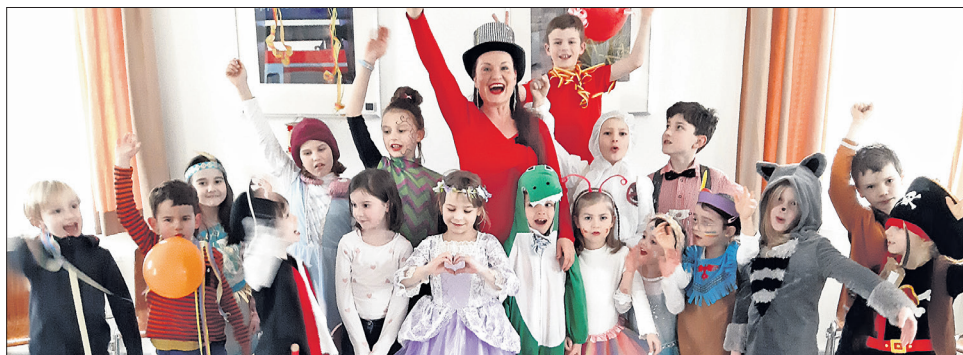
Singende „Gummibären“ des GV Liederkrans erobern die Bühne.