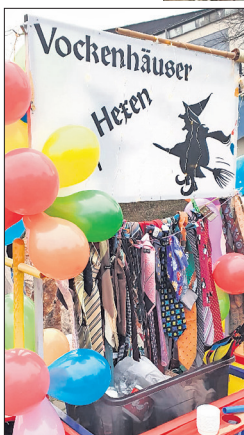
Die Krawattenausbeute vergangener Jahre baut am Bollerwagen.

Gefeiert wurde dennoch und die ein oder andere Pause eingelegt: Vor dem Kiosk der Familie Can, auf dem Platz vor dem Caffè del