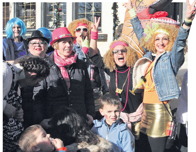
Auch am Straßenrand wurde gut gelaunt gefeiert.