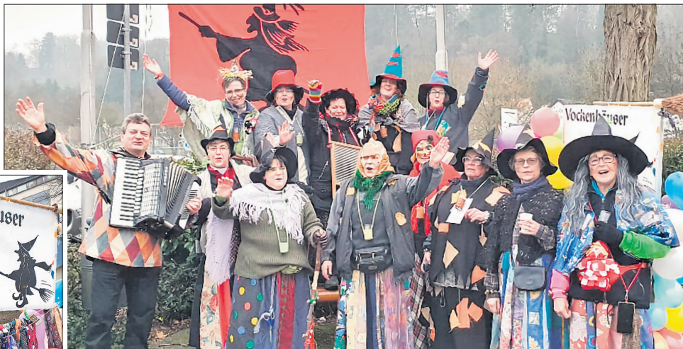
Eine feierfreudige Truppe, die gerne singt und tanzt: die Vockenhäuser Hexen.

Corso und vor der Fleischerei Rücker stimmten sie Ständchen an.