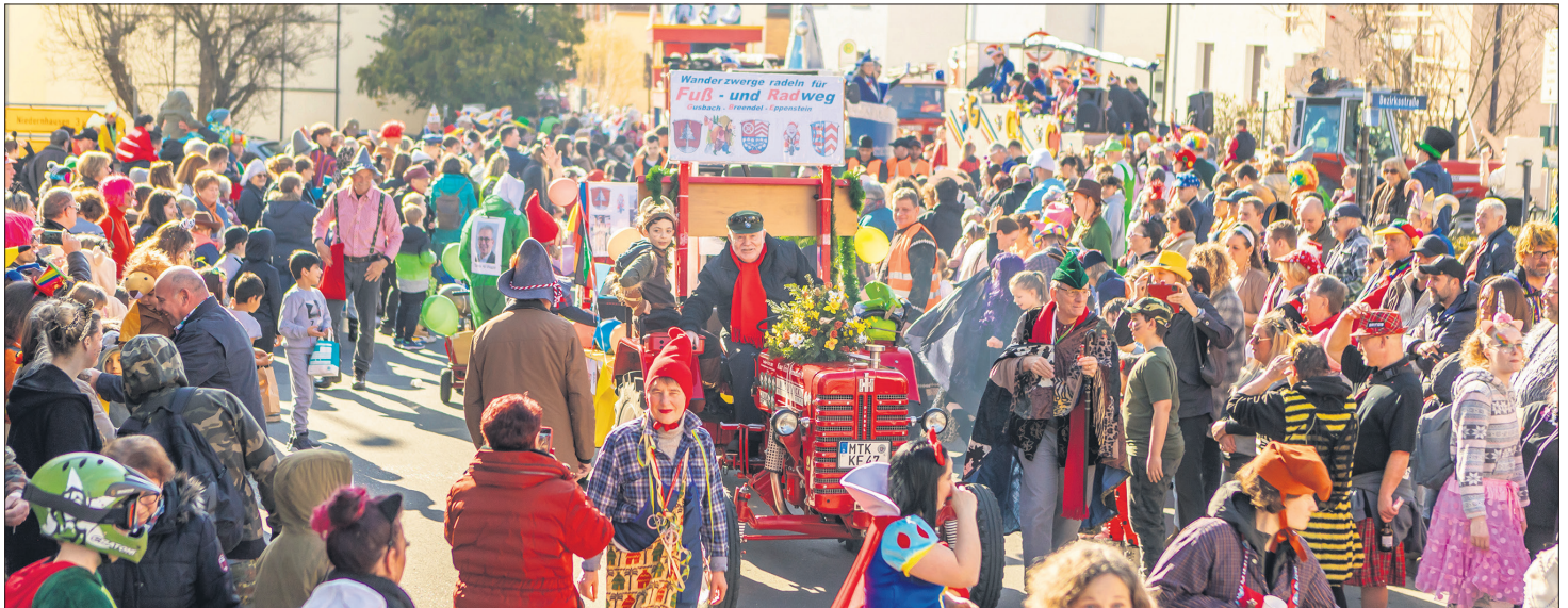
Die Gruppe „Wanderzwerge“ war beim Umzug mit Rad und Traktor unterwegs für den „Fuß- und Radweg“ nach Bremthal.