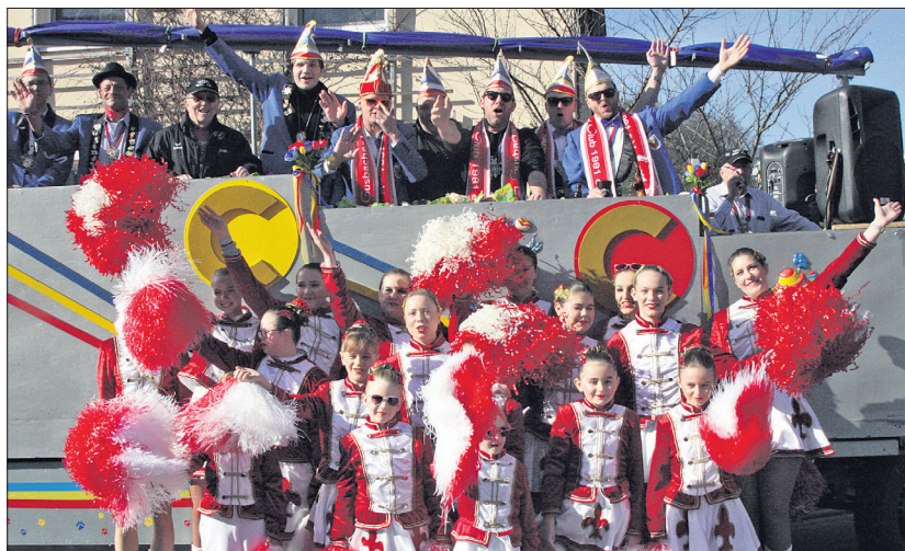
Die GCC-Garden und der Komitee-Wagen kurz vor dem Start des Umzugs.