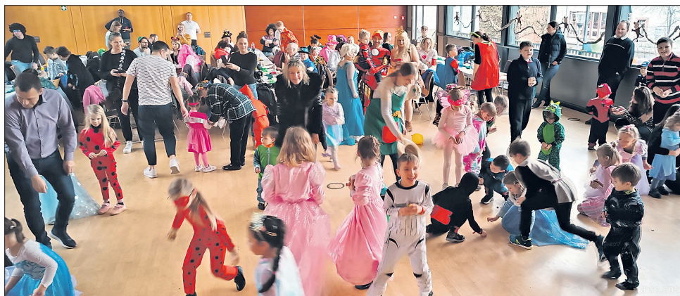
Ausgelassene Spiele und Kamelle fangen begeisterten viele Kinder im Bürgersaal.