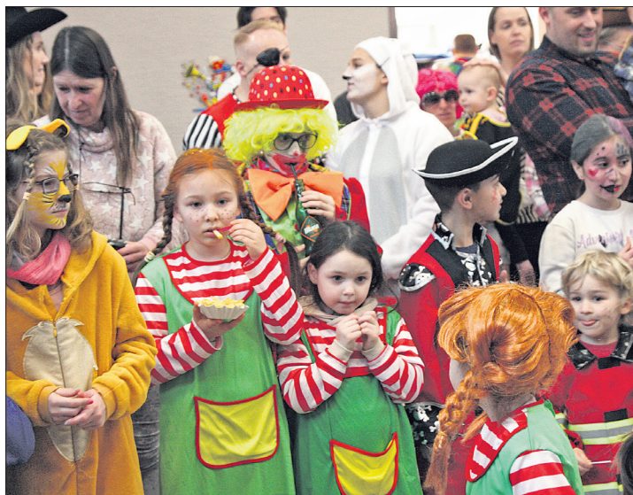
In Ehlhalten tummelte sich Pippi Langstrumpf gleich dreimal.