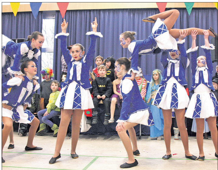
Die Garde des TSV Vockenhausen hatte für die Hebefiguren viel geübt.