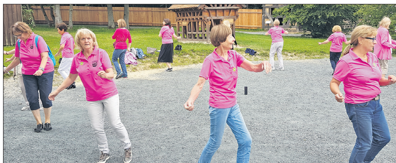
Die Tanzfreunde der TSG Ehlhalten 2021 bei einem Ausflug in den Hessenpark, wo sie spontan eine Tanzchoreographie aufführten.