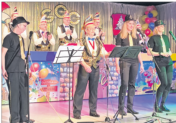
Die Knallbonbons stimmten die Gäste zu Beginn der Sitzung ein und bereiteten mit dem zweiten Auftritt das Finale vor.