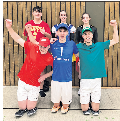
Das Team „Gusbach Reloaded“ beim Volleyball Fastnachtsturnier des TuS.

Traditionell prämiert der TuS am Ende die Mannschaft im besten Kostüm – in diesem Jahr waren das die Bad Sodener als bunte Hawaiianer. Insgesamt war es ein spielstarkes und