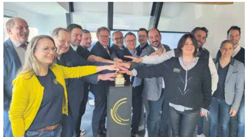
Start von Taunus Connect und Rheingau Connect mit Vertreterinnen und Vertretern der Gründungskommunen und -unternehmen im Gründerzentrum OG2 in Taunusstein.

Sechs Bausteine bilden das Fundament der Plattform unter www.taunus-connect.de beziehungsweise www.rheingau-connect.de : Lokale Jobs, Bündelung von Weiterbildungsangeboten, Überblick über freie Gewerbeflächen zur Standortentwicklung, Synergien im betrieblichen Gesundheitsmanagement für zum Teil kostenlose oder stark vergünstigte Fitness- und Ernährungsberatung, digitale Marketing-Möglichkeiten sowie eine Übersicht zu Verwaltungsleistungen. Ziel ist es, insbesondere kleineren Unternehmen damit eine einfache, kostengünstige