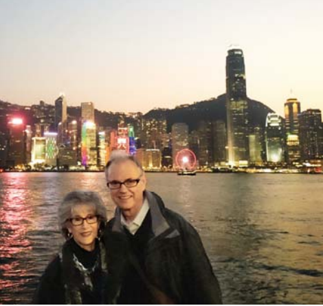
Bereit für das Leben in Hongkong

In der pulsierenden Metropole Hongkong zu leben war für uns eine riesige Veränderung. Hinzu kam die chinesische Sprache, die uns nicht leichtfiel. Doch wir wurden herzlich aufgenommen und das einheimische Essen war auch nicht zu verachten. Das Werk dehnte sich rapide aus. Allerdings waren die Immobilienpreise in die Höhe geschossen und so entschied die Leitende Körperschaft, einen Großteil der Räumlichkeiten zu verkaufen. Kurz darauf, im Jahr 2015, wurden wir nach Südkorea geschickt, wo wir immer noch sind. Hier kämpfen wir erneut mit einer Fremdsprache. Wir haben zwar noch einen weiten Weg vor uns, aber es macht uns Mut, dass unsere Freunde kleine Fortschritte bemerken.