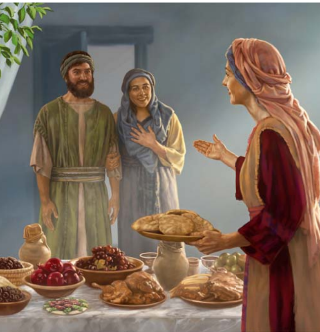
Die Einladung ins Haus der „wahren Weisheit“ anzunehmen kann zu ewigem Leben führen (Siehe Absatz 17, 18)

15 Jehova sorgt großzügig für uns. Das zeigt sich an der Frau, die für „wahre Weisheit“ steht. Sie hat ihr Fleisch fertig zubereitet, ihren Wein gemischt und ihren Tisch gedeckt (Spr. 9:2). Gemäß Vers 4 und 5 sagt sie zu Personen, „denen es an Vernunft fehlt: ‚Kommt, esst mein Brot.‘“ Warum sollten wir ins Haus der wahren Weisheit eintreten und an ihrem Tisch Platz nehmen? Jehova möchte, dass seine Kinder weise Entscheidungen treffen und dass ihnen nichts passiert. Er möchte es uns ersparen, die Lektionen des Lebens durch schmerzhaftes Erfahren zu lernen, auf die oft quälende Gewissensbisse folgen. Aus diesem Grund be-