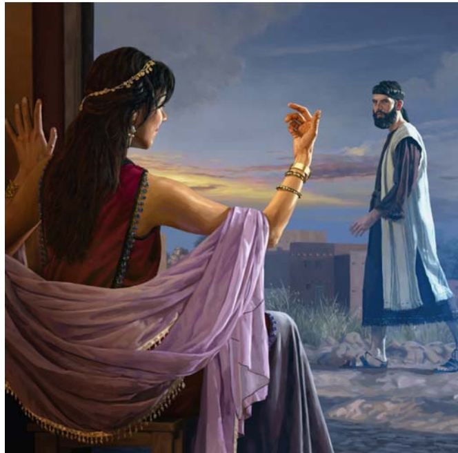
Die „dumme Frau“ spricht eine Einladung aus, die tragische Folgen haben kann (Siehe Absatz 7)

annehmen oder ablehnen. Vor so einer Entscheidung könnten auch wir stehen. Was werden wir tun, wenn wir im Internet oder in anderen Medien auf Unmoral oder Pornografie stoßen?