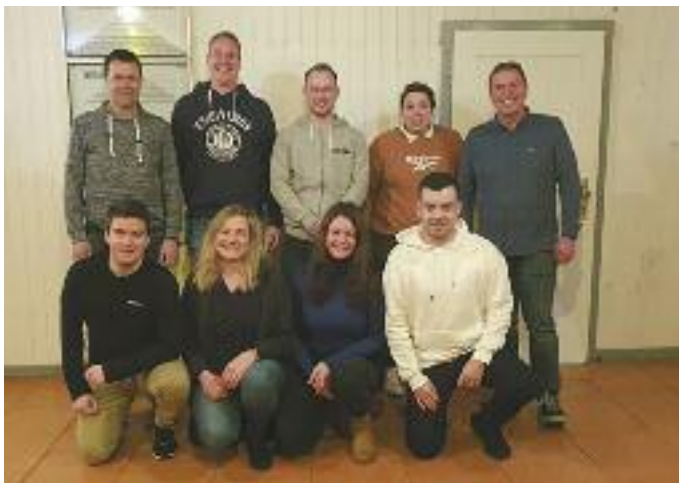
Vorstand des TC BW Birstein - Bericht linke Seite

Im Trauerfall sind wir auch nach Redaktionsschluss für Sie da und versuchen, Ihre Anzeige noch unterzubringen – rufen Sie einfach an: Tel. 06054 - 1318