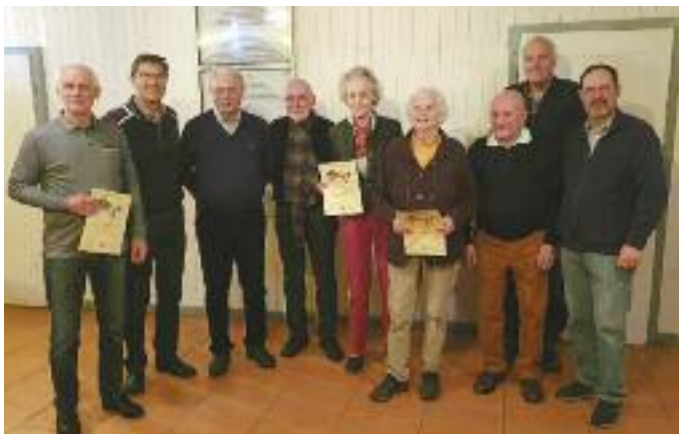
Geehrte Mitglieder des TC BW Birstein - Bericht linke Seite