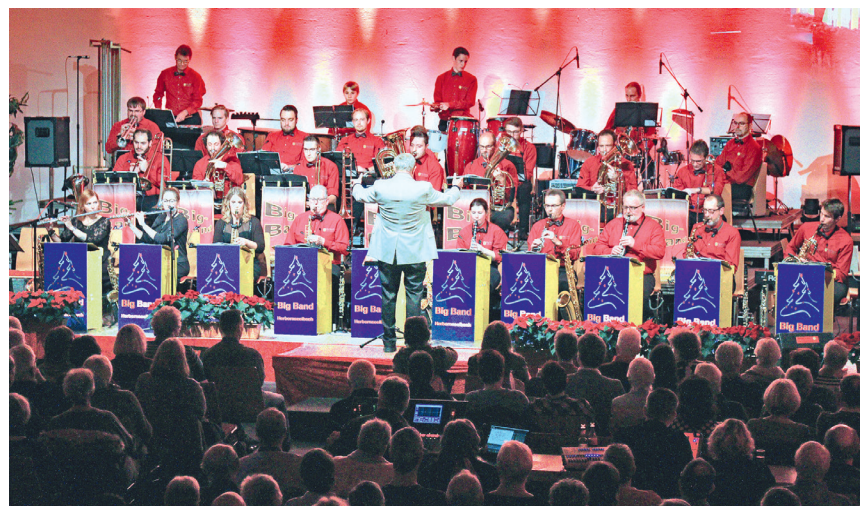
Die Big Band Herbornseelbach eröffnet am 14. Mai die Sommer-Matinee des Kulturamts im Rosengärtchen.

Innen und bei schönem Wetter auch im Hof allerlei um Upcycling, Müllmonster und Geschichtenspaß erleben. Veranstalter: Phantastische-, Stadtbibliothek und Jugendamt, Phantastische Bibliothek Wetzlar, Turmstraße 20