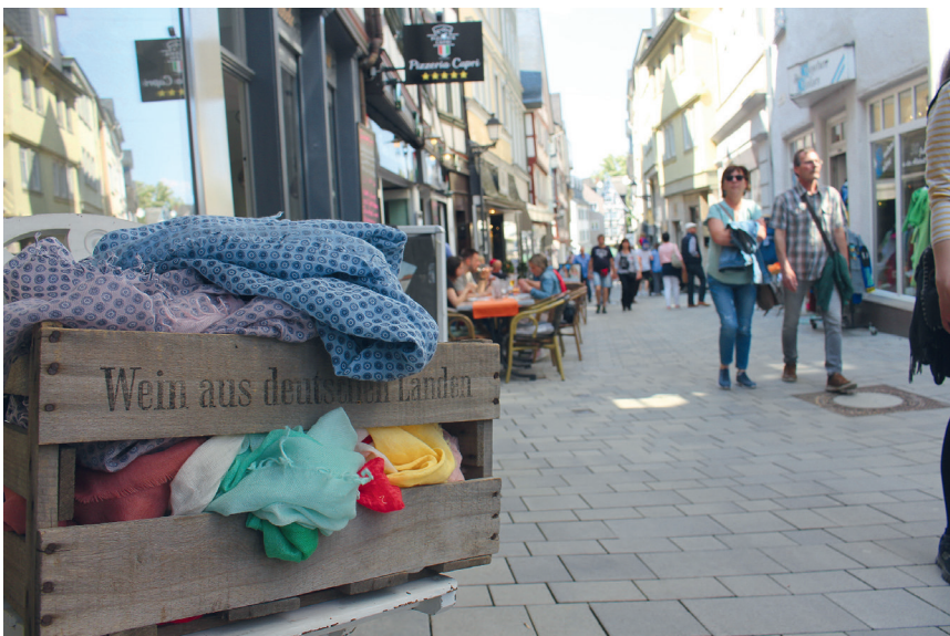
Kenner Wetzlars wissen, dass man hier nicht nur guten Wein genießen, sondern auch in den Altstadtgassen prächtig flanieren kann.

Das Sommernachtsweinfest ist Freitag, 28. Juli, von 16 bis 1.30 Uhr, Samstag, 29. Juli, von 11 bis 1 Uhr und Sonntag, 30. Juli von 11 bis 18 Uhr geöffnet. Die Live-Musik wird Freitag und Samstag jeweils um 23 Uhr beendet.