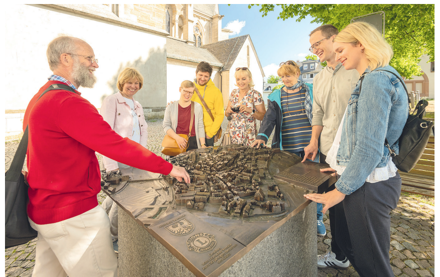
Klein-Wetzlar. Dieses Tastmodell findet man gleich am Dom.

Collégiale, musées et plus: Wetzlar, une ville remarquable – Die Altstadt in französischer Sprache kennenlernen: Der Dom umringt von verwinkelten Gassen sowie ineinander verschachtelten Fachwerk- und Barockhäusern prägen das unverwechselbare Stadtbild von Wetzlar. Interessierte treffen sich am Samstag, den 3. Juni 2023 um 16:00 Uhr am Brunnen am Domplatz (Preis: Erwachsene 6,00 Euro und ermäßigt 3,00 Euro)