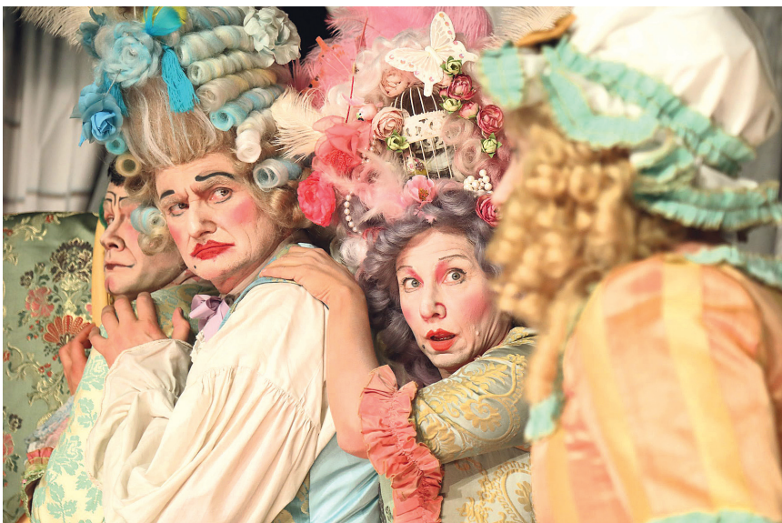
Der Worschtmichel mischt den Adel auf.

Karten gibt es unter anderem in der Wetzlarer Tourist-Information am Domplatz 8, in Solms bei der Reiseagentur Lutz, Braunfelder Straße 20, sowie telefonisch unter der Wetzlarer Karten-Hotline 06441-22601 oder Eventim 01806-570086. Wettertelefon am Veranstaltungstag ab 18 Uhr telefonisch unter 01806-57 00 96 (0,14 ct/min.) oder im Internet unter www.wetzlarer-festspiele.de . Weitere Infos gibt es unter www.wetzlarer-festspiele.de .