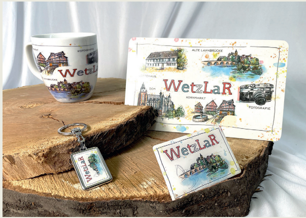
Für Wetzlar-Fans gibt es das neue fineArt-Design.