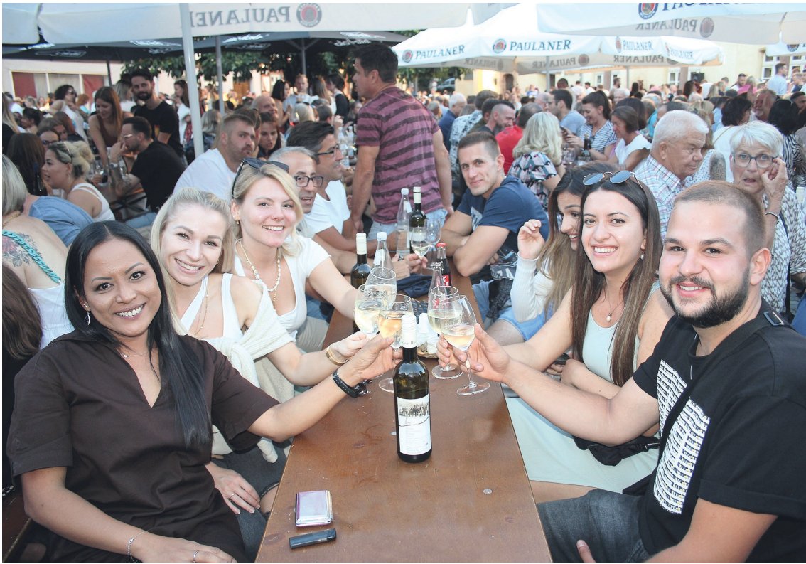
In guter Gesellschaft ein paar gemütliche Stunden genießen. Das geht perfekt beim Weinfest in Wetzlar.