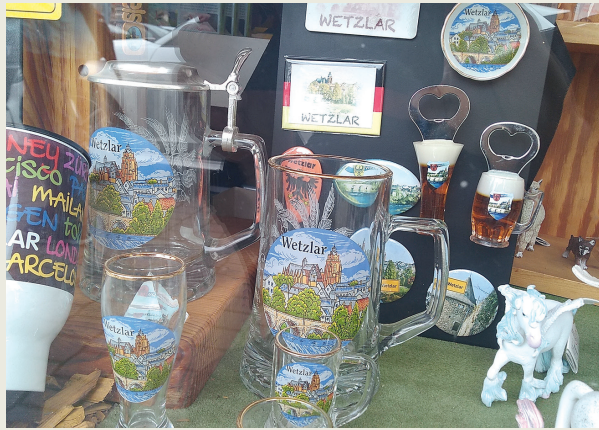
Auch in der Nachbarstadt Braunfels ist Wetzlar präsent.