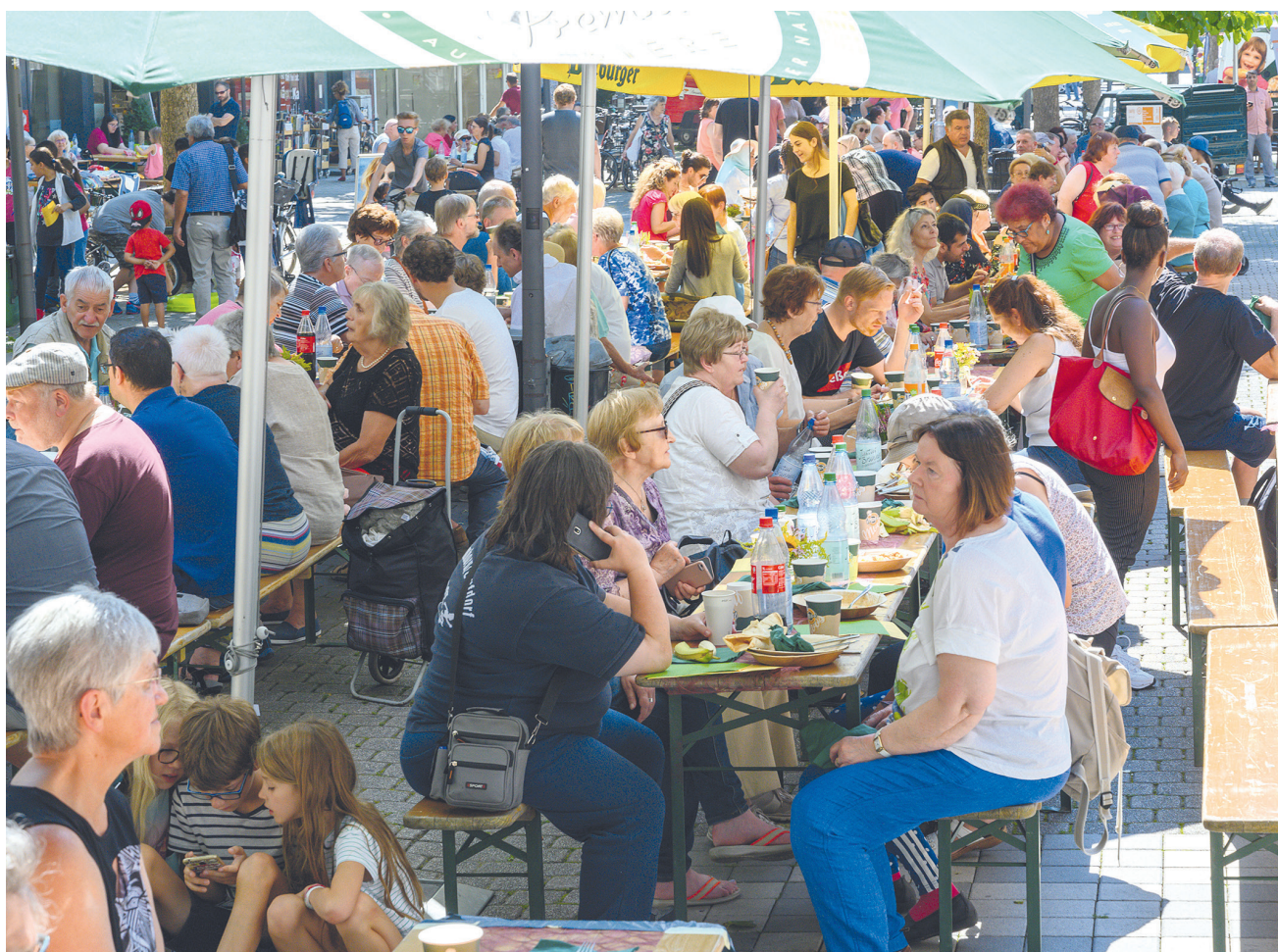
24. Juni Die Bahnhofstraße in Wetzlar verwandelt sich nach drei Jahren Pause wieder in ein Open-Air-Restaurant mit ellenlangen Tischen.