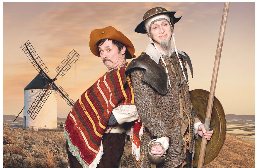
Bei Don Quijote verschwimmen die Grenzen zwischen Dichtung und Wahrheit.