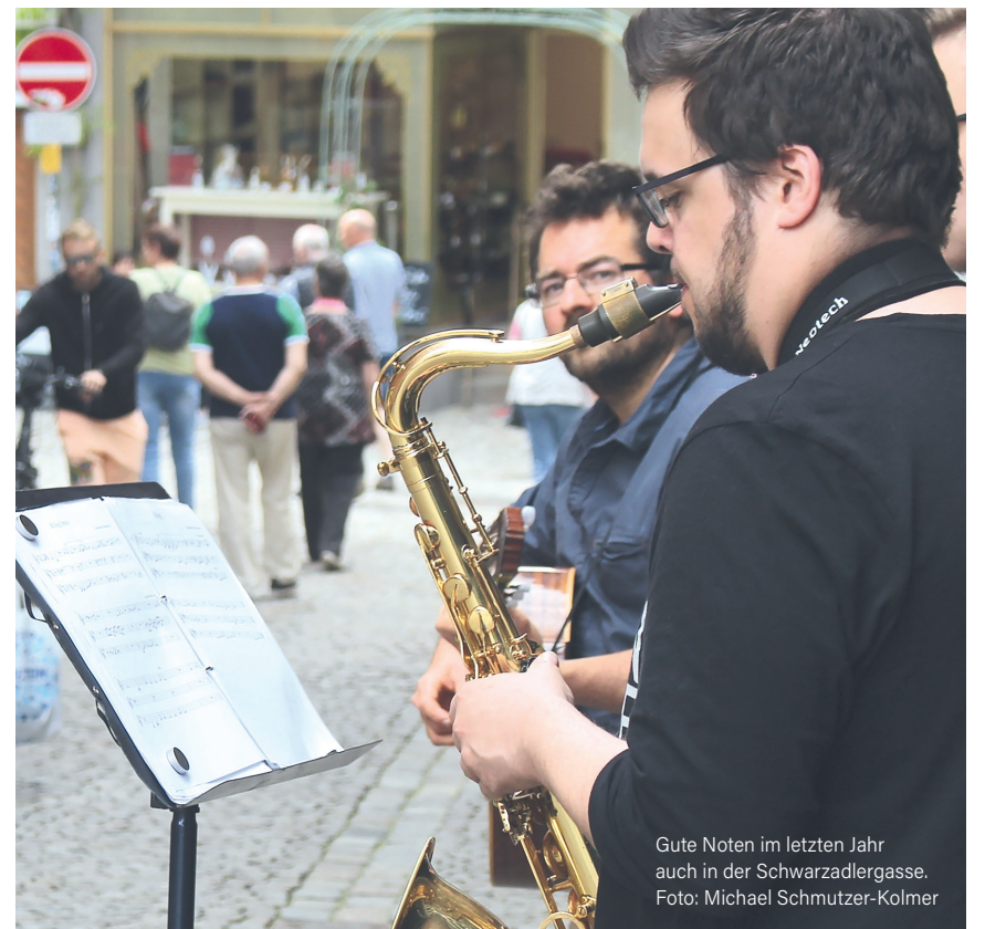
Gute Noten im letzten Jahr auch in der Schwarzadlergasse.

Und für die Kleineren gibt es eine Zirkusschule am Wochenende in der Bahnhofstraße mit unterschiedlichen Spielstationen, an denen Geschicklichkeit und vieles mehr gefragt ist. Ob Balancieren auf einer Seilanlage, Jonglieren mit Bällen, Diabolo, Flowerstick, Poi Swinning oder Tellerdrehen. Mitmachen ist erlaubt und erwünscht. Und auf der „Alten Lahnbrücke“ wird eine Seifenblasen-Station am Samstag und Sonntag mit 2 Team-Animatoren sein,