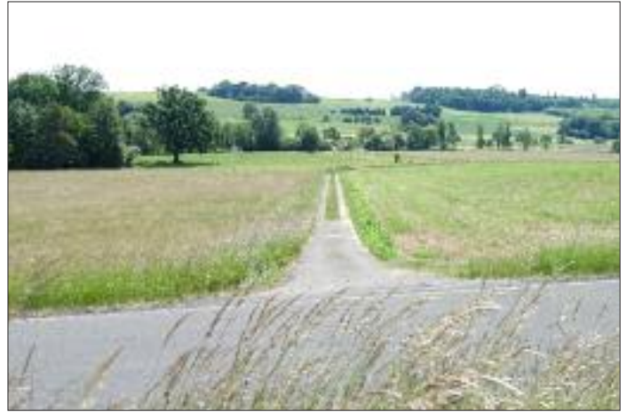
Foto: Landschaft am Weiher