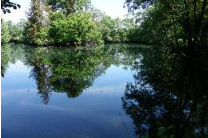
Foto: Der Illnhäuser Weiher als Spiegel der Natur.

Unsere Wasserressourcen geraten zunehmend unter Druck. Die letzten Dürresommer hatten gravierende Auswirkungen auf unsere Wälder, Landwirtschaft und die gesamte Biodiversität. Klimaforscher warnen angesichts der aktuellen Winterdürre insbesondere in Südeuropa vor extremer Trockenheit im kommenden Sommer. Umgekehrt haben wir mit Starkregenereignissen und Überflutungen zu rechnen. Die Wasserverfügbarkeit für die belebte Natur hat und wird sich im Zuge des Klimawandels verringern.