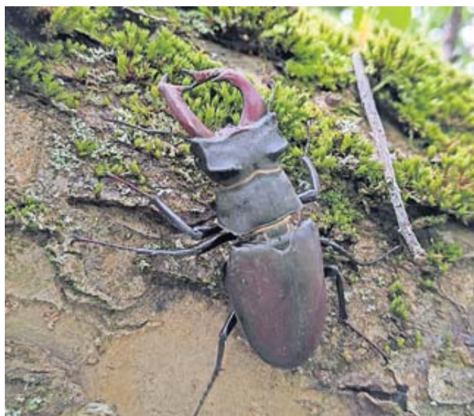
Hirschkäfer im natürlichen Habitat.