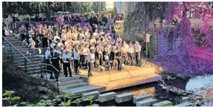
Wasserspiele-Chornacht in der Arena in der Salz Bad Soden.