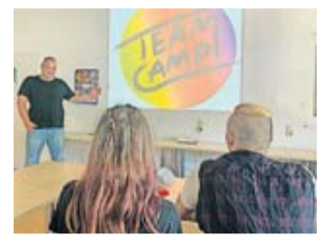
„Teamcamp“ der AQA zur Berufsorientierung.

Das Projekt wird durch den Main-Kinzig-Kreis sowie durch das Land Hessen finanziert und ist für die Teilnehmerinnen und Teilnehmer kostenfrei. Auch Fahrtkosten werden erstattet; Arbeitsbekleidung und einen Laptop für die Zeit im Teamcamp werden gestellt. Für Ausflüge und das Material für Projekte müssen