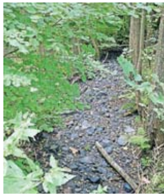
Links das Bachbett des Schwarzbachs bei Schlüchtern, rechts der Hellgraben bei Steinau.

„In den Brunnen der öffentlichen Wasserversorgung sind