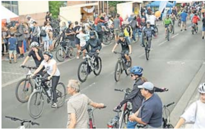
Action am Landratsamt.

gegnungen zwischen Autos und Radfahrern möglichst ausbleiben. Unverzichtbar sind auch die rund 90 Helferinnen und Helfer für den Sonderzug. Besondere Anerkennung verdienen alljährlich die Männer und Frauen der Rettungsdienste und Feuerwehren für ihre Mitwirkung. Nicht zu vergessen seien die Mitarbeiterinnen und Mitarbeiter der beteiligten Ordnungsämter und Bauhöfe sowie von Hessen Mobil, die eine zentrale Aufgabe bei der Absicherung rund um „Hessens längstes Straßenfest“ übernehmen. Hinzu kommen die zahlreichen Vereine, Unternehmen und Institutionen, die nicht nur für Speisen und Getränke, sondern auch für Gelegenheiten zum Entspannen und zur Unterhaltung sorgen. Rund 1.000 Frauen und Männer sind hierbei ehrenamtlich eingebunden. Auch in diesem Jahr verschönerten Musikbeiträge von Orchestern oder Bands den Aufenthalt und es fanden in mehreren Orten entlang der Strecke besondere Feste statt. Bereits am Freitag und am frühen Morgen des vergangenen Sonntags begannen die Vorbereitungen für den Radler-sonntag. Es wurden entlang der Strecke zahlreiche Ver-