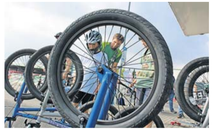
Das AOK-Programm in Gelnhausen lockten einige Interessierte an.