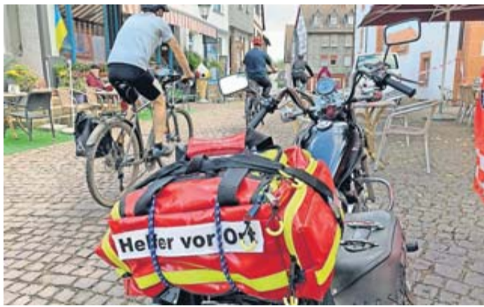
Helfer vor Ort in Steinau.

vielen Akteure ist dieses großartige Freizeitvergnügen überhaupt möglich. Zudem sei der Wert als indirekte Vereinsförderung und als Tourismuswerbung unbezahlbar.