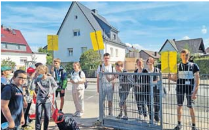
Die Buspatinnen und -paten zeigen geduldig den Weg zum richtigen Bus und begleiten die Schülerinnen und Schüler sicher nach Hause.