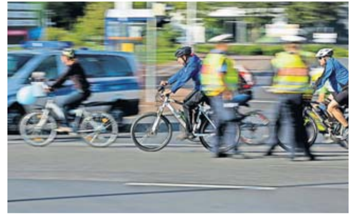
Die Polizei sichert die Radstrecke.

Aufräumarbeiten im Anschluss erfordern ebenfalls noch einmal eine besondere Energieleistung. Der Landrat dankt darüber hinaus den rund 20 Firmen, Be-