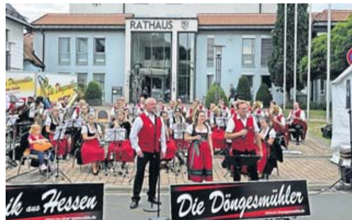
Konzert vor dem Rathaus.

Groß und Klein konnten hautnah miterleben, wie es ist, Teil des Orchesters zu sein. Viele Kinder nutzen das Angebot und mischten sich unter die Musikerinnen und Musiker, insbesondere die Plätze neben