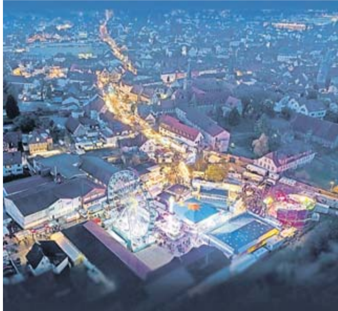
Der Kalte Markt findet in diesem Jahr wieder statt.

Hierbei handelt es sich um zwei Abende mit identischem Bühnenprogramm und einer Komposition aus