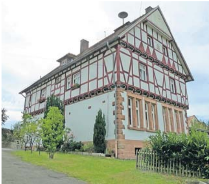
Die alte Schule in Mernes.

Bad Soden-Salmünster. Der Magistrat der Stadt Bad Soden-Salmünster denkt über einen Verkauf der alten Schule im Stadtteil Mernes nach. Das geht aus einer Pressemitteilung der Stadt hervor. Aktuell prüft der Magistrat der Stadt Bad Soden-Salmünster weitreichende Konsolidierungsoptionen für den städtischen Haushalt, heißt es darin. Und darunter falle auch der Verkauf von städtischen Immobilien, die wenig bis gar nicht genutzt würden.