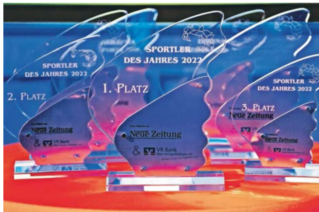
Auf die Sieger der GNZ-Sportlerwahl 2022 warten wertvolle Skulpturen und attraktive Geldpreise.

Verein und Sportart: TV Gelnhausen, Leichtathletik. Erfolge: Fünfter des Zehnkampf-Wettbewerbs bei der U18-EM