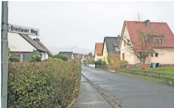
Altersbedingt müssen in diesem Jahr im Breslauer Weg in der Innenstadt die Ver- und Entsorgungsleitungen ausgetauscht werden.

Stadtwerke investieren in Hochbehälter und Leitungsnetz / Gebührenerhöhung unumgänglich