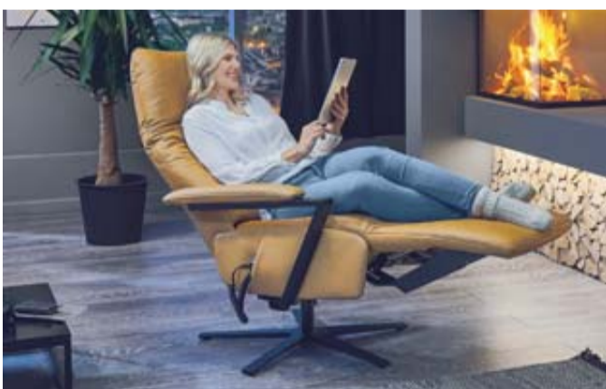
Noch bequemer: Das Relaxedsessel-Zentrum bieten maßgefertigte Erholung.

SCHNELLENTSCHLOSSENE AUFGEPASST: Bei Polster Aktuell heißt es zu Beginn des Jahres wieder: Wer zuerst kommt, spart am meisten: Polster Aktuell bietet gerade über 50 ausgewählte Ausstellungsgarnituren, Betten und Sessel garantiert um 50% reduziert an.