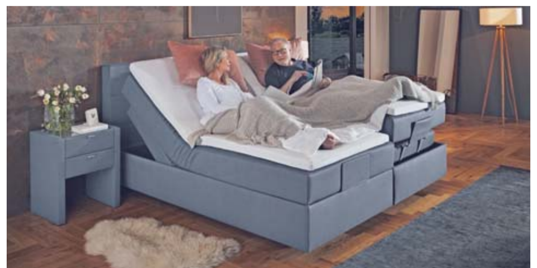
Die Original Orthopädiaka Boxspringbetten gibt es bei Polster Aktuell. Für den optimalen Schlaf ohne Schlafstörungen ist bei der Bettenauswahl die Expertenberatung von Polster Aktuell hilfreich.

alisierter Herstellung. „Unsere Original Orthopädiaka Möbel sind der Inbegriff gesunden Sitzens und Liegens. Das hat uns das Bundespatentamt bestätigt.“ cp