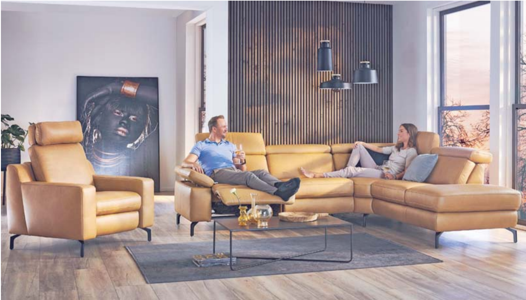
Comfort Masterclass 2023: Polster Aktuell startet mit Komfortneuheiten und Innovationen ins neue Jahr, die den angenehmen und gesunden Sitzkomfort noch einmal deutlich verbessern.