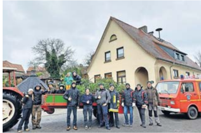
Baumsammlung in Alsberg.

Bad Soden-Salmünster. Am Samstag, 14. Januar wurden auch in Mernes und Alsberg die ausgedienten Weihnachtsbäume eingesammelt. Die Jugendfeuerwehr Mernes war dazu mit einem Pritschenwagen mit Anhänger und Feuerwehrbegleitung bereits ab morgens im Dorf unterwegs und sammelte 167 Weihnachtsbäume ein. Diese wurden am späten Nachmittag dann wieder wie üblich an der Grillhütte in Mernes verbrannt, die Anwohner konnten dem knisternden Feuer wieder bei einer Grillwurst beiwohnen. Getrübt wurde die gute Stimmung und das reibungslose Einsammeln allerdings durch einen Vorfall: Anwohner hatten beobachtet, dass Unbekannte in einem weißen Lieferwagen am Morgen die Spendenumschläge für die Jugendfeuerwehr von den Bäumen pflückten und stahlen. Die Verantwortlichen informierten sofort die Polizeistation Schlüchtern