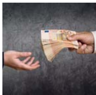
Es geht um viel Geld.

Aufgrund mangelhafter Widerrufsbelehrungen in den Vertragstexten sind viele Versicherungsverträge auch heute noch anfechtbar. Man nennt dies „ewiges Widerrufsrecht“.