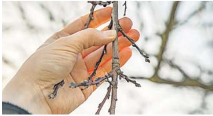
Nicht alle Obstbäume werden im Winter geschnitten. Etwa der Pfirsichbaum sollte erst zur Blüte einen Rückschnitt erhalten.

Wer die Schere ansetzt, sollte nicht hier und da ein bisschen was wegnehmen. Die Obsterzeuger raten zum Entfernen weniger, dickerer Äste. Denn