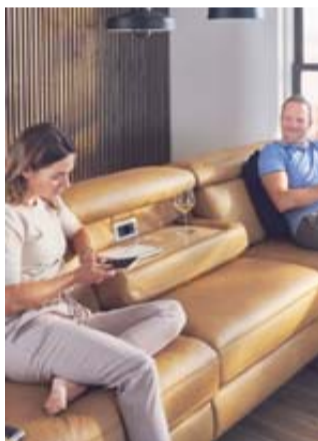
Ob versteckter Klappstisch mit Medienanschluss, flexible Seitenlehnen oder zum Sofa passende Relaxedsessel – Polster Aktuell macht durch seine Innovationen und Neuentwicklungen, die auch in die Serie Comfort Masterclass 2023 integriert sind, das Sitzen noch komfortabler, bequemer und gesünder.

Und bei Polster Aktuell bleiben die Kunden von Anfang an niemals sich selbst überlassen: „Unsere Orthopädiaka Expertenberatung ist einmalig. Dafür sollten Sie unbedingt einen Termin vereinbaren. Später zu Hause, wenn man immer häufiger auf seinem neuen Möbel sitzt oder liegt, wird man sich immer gleich und gerne an die hervorragende Beratung erinnern“, sagt Müller. Die Lorbeeren sind für das Möbelhaus kein Grund zum Innehalten. „Wir stehen