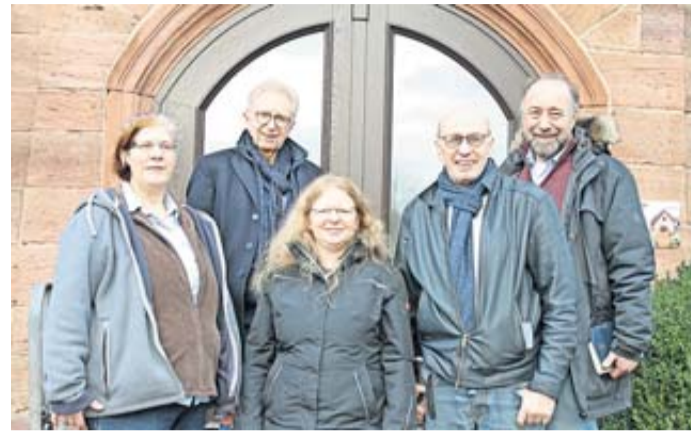
Abordnung der liberalen jüdischen Gemeinde.