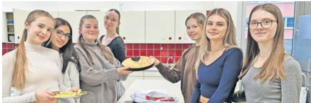
Von Schülerinnen und Schülern selbstgemachte Quiche.

Alle Lehrkräfte der Französisch-Fachschaft organisierten anlässlich des Jubiläums ein Programm mit französischen Filmsequenzen, französischer Küche, Indoor-Boule und der Vorstellung der Partnerstadt Guilherand-Granges durch den Verschwiegerungsverein Bad Soden-Salmünsters. Ein Carambar-Gewinnspiel wurde auf dem Pausenhof für alle Schülerinnen und Schüler der Schule angeboten und drei Glückliche aus den Klassen 7c, 7d und 8e gewannen jeweils eine Carambar-Packung für ihre Klasse. Auch die blau-weißrot dekorierte Pausenhalle lud zum Feiern und Spielen ein. „Vielen lieben Dank an alle, die diesen besonderen Tag ermöglicht haben. Es ist uns eine Herzensangelegenheit, dass die Henry-Harnischfeger-Schule die Freundschaft mit Frankreich durch Kontakte und Begegnungen pflegt.“, sagt die Französisch-Fachschaft.