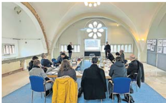
Die Pläne werden vorgestellt.