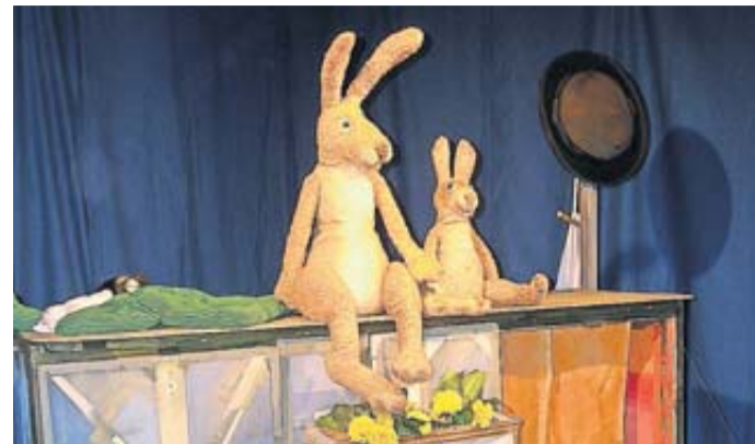
„Weißt du eigentlich, wie lieb ich dich hab? Im Theatrium Steinau gibt es die Antwort.“

Steinau. Wer kennt die Geschichte nicht, von dem kleinen Hasen, der den großen Hasen so lieb hat. In diesen Zeiten kann das eigentlich nicht oft genug gesagt werden. Die Hasengeschichte „Weißt du eigentlich, wie lieb ich dich hab?“ nach dem Weltbestseller und Kinderbuch von Sam McBratney wird am 12. März, um 15 Uhr, im Theatrium Steinau gespielt.