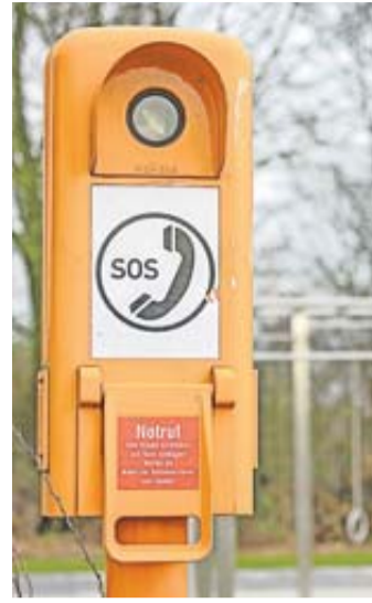
Helfer in Orange: Notrufsäulen entlang der Autobahnen können im Not- oder Pannenfällen Hilfe vermitteln.

Egal ob der Akku streikt, man im Funkloch ist – oder gar kein Handy dabei hat. Hilfe in Not- und Pannenfällen lässt sich entlang der Autobahnen dann auch über eine der Notrufsäulen holen. Rund 17 000 dieser orangefarbenen Säulen stehen im Abstand von zwei Kilometern entlang der Autobahn am Randstreifen und finden sich laut Auto Club Europa (ACE) zuweilen auch auf vielen Rastplätzen. Der kürzeste Weg zur nächst gelegenen lässt sich an den weißen Begrenzungspfählen ablesen: Dort führen schwarze Pfeile nach links oder rechts. Die Säulen haben zwei Tasten, um eine Verbindung mit der Notrufzentrale der Autoversicherer in Hamburg (GDV DL) herzustellen, welche die Säulen betreut. Bei einigen Modellen muss zuvor eine Klappe angehoben werden, die die Technik vor starken Witterungseinflüssen schützen soll. Über den roten Knopf lässt sich ein Unfallnotruf absetzen, den gelben drücken Betroffene den im Falle einer Fahrzeugpanne. So genannte Notrufagenten klären die mögli-