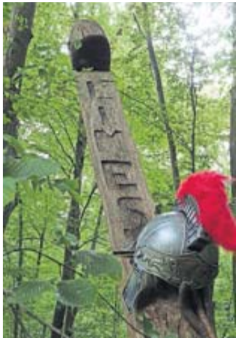
Germanen versus Römer.