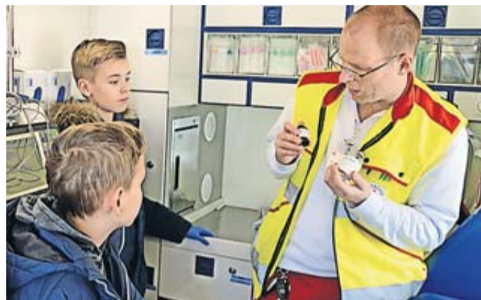
Am 27. April können Schülerinnen und Schüler die Aufgabenfelder des DRK kennenlernen.