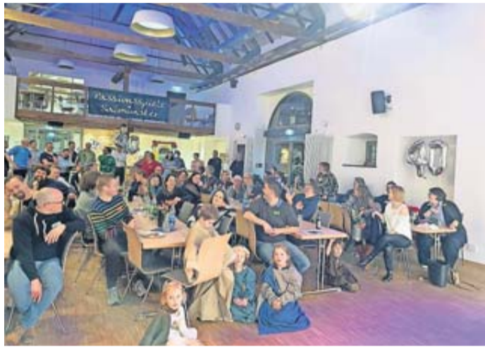
Eine typische Feier – oder doch nicht?

40-jähriges Jubiläum der Passionsspiele Salmünster