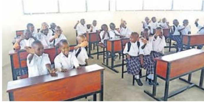
Einschulungstag in Kinonos.

Im Januar konnten die ersten 28 Kinder eingeschult werden, nach dem eine ausgebildete Lehrerin eingestellt worden war. Die Schule wird gemeinsam mit der örtlichen Kir-