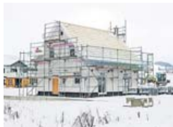
Der Bauunternehmer ist für die Sicherung des Baus zuständig.

Vorsicht, Wintereinbruch: Wer in der kalten Jahreszeit baut, sollte mit seinem Bauunternehmer dringend die Sicherung des Materials und der Leistungen gegen Winterschäden vertraglich regeln. Darauf weist der Verband Privater Bauherren (VPB) hin. Konkret sei es sinnvoll, explizite vertragliche Regelungen zu treffen, wie und mit wel-