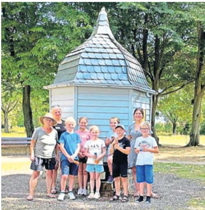
Zehn Kinder erlebten einen Tag, an dem sich alles um das Lebenselixier Wasser drehte.

Florstadt. Im Rahmen der durch die Jugendpflege 4.0 angebotenen Ferienspiele für Kinder und Jugendliche aus Florstadt, Eczell, Reichelsheim und Wölfersheim, hat die ansässige Ortsgruppe des BUND einen "Thementag Wasser" angeboten. Zehn Kinder im Alter von 7 bis 17 Jahren erlebten am bislang heißesten Tag dieses Sommers einen Tag, an dem sich alles um das Lebenselixier Wasser drehte. Nach einem spielerischen Einstieg durch einen Wassertransportwettbewerb im Stadener Schlosspark kam die Gruppe ins Gespräch über das Thema Wasserverbrauch und Wasserverschwendung. Die Kinder lernten den Begriff der Schwammstadt kennen und erfuhren mehr darüber, wie viel Wasser wirklich in einer Jeans steckt. Ihr gewonnenes Wissen durften sie in einem anschließenden Quiz eigenständig prüfen. Nach einer kurzen Abkühlung in der Wassertrinkpause ging das Entdecken erst richtig los.