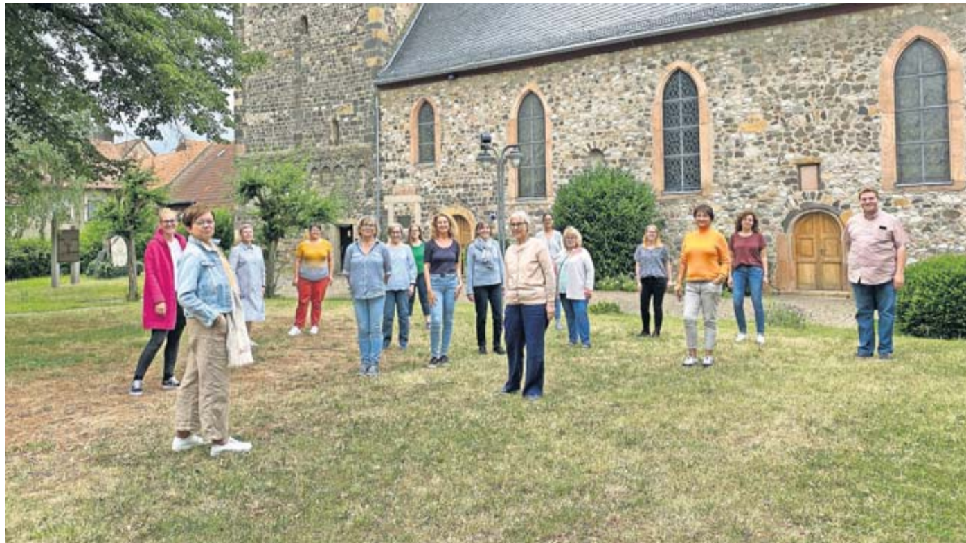
Dacapo aus Nieder Weisel ist unter den auftretenden Chören am kommenden Sonntag.

50 Jahre Wetteraukreis: Chorfestival in der Friedberger Stadthalle