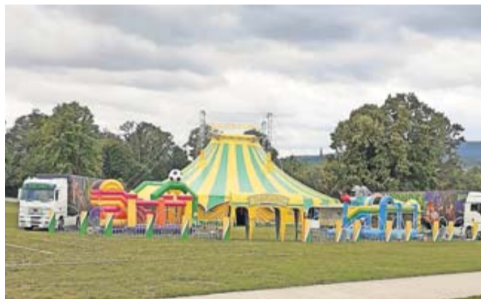
Das Zelt am Goldsteinpark.