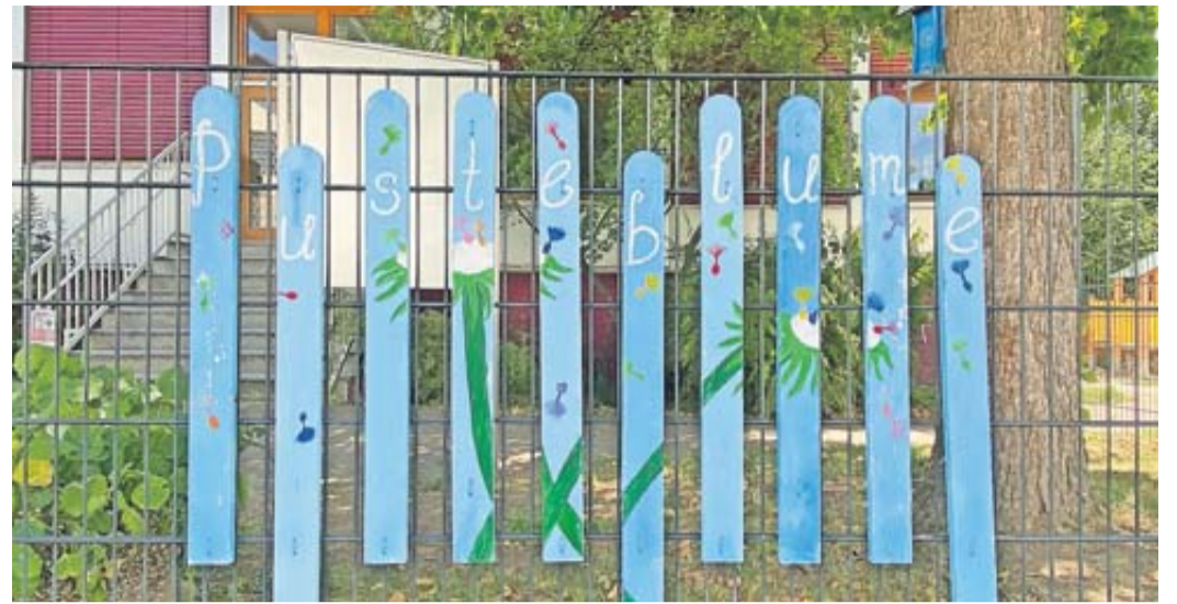
Die Kita „Pusteblume“ feierte 50-jähriges Bestehen.