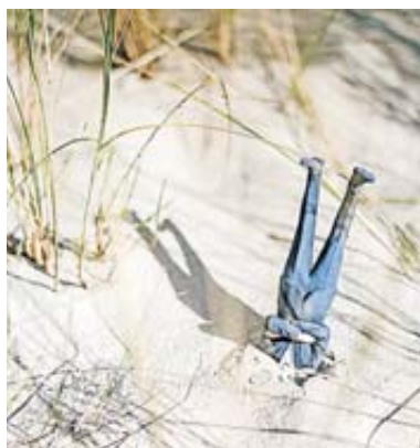
Ruhe, bitte: Energie schöpfen Introvertierte, wenn sie Zeit für sich haben - auch am Arbeitsplatz.

Dem Kinder- und Jugendpsychotherapeuten Ralph Schliewenz zufolge kann