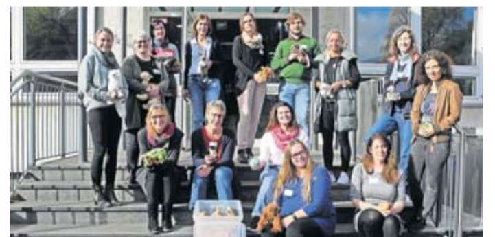
Die Teilnehmer der Fortbildung mit den altersgerechten Materialien aus der Klimakiste.

Klimaexperten an Wetterauer Grundschulen