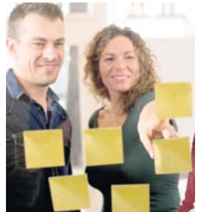
Mehrere Ursachen führen zu „Windstille“ beim Brainstorming.