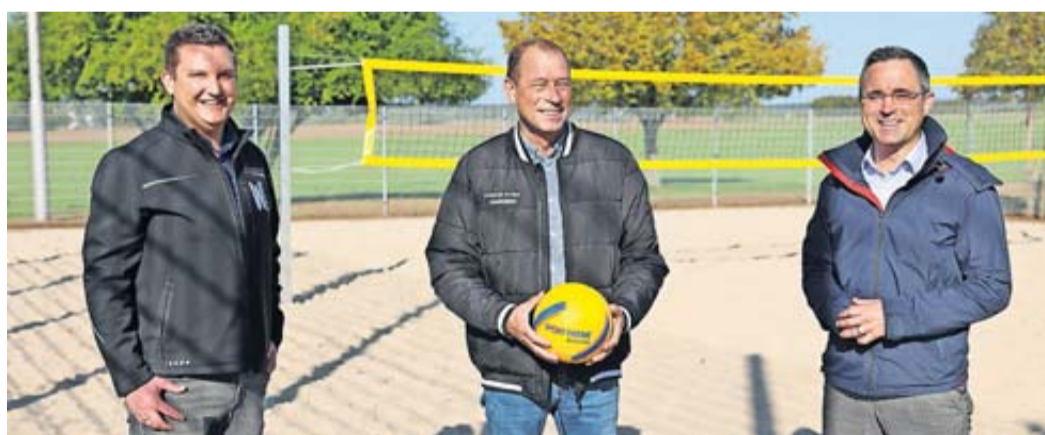
Ein Teil der vorhandenen Weitsprungbahn ist in den Platz integriert.

Für ein Training auf Sand mussten immer entsprechen weite Wege in Kauf genommen werden. Dass in Berstadt Volleyball gespielt wird, geht auf die siebziger Jahre zurück. Nach der Einweihung der Mehrzweckhalle gründete sich eine Sportgruppe, in der immer Montags unter anderem verschiedene Ballspie-