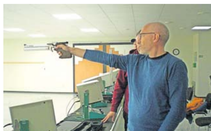
Auch mit Kurzwaffen konnten die Gäste Probeschießen.

ten sich im Schießkino mit Lasergewehr und Laserpistole versuchen. Sowohl die Mitglieder der Schützengesellschaft als auch ihre Gäste verlebten einen angenehmen Sonntag. Sportliches Schießen schult die Konzentration und macht darüber hinaus auch noch Spaß. Das haben die Besucher der Schützengesellschaft Butzbach an diesem „Tag der offenen Tür“ auf jeden Fall mitbekommen. Nähere Informationen zur Schützengesellschaft findet man in der Homepage unter www.schuetzen-1410-butzbach.de oder kurz www.sg1410.de .