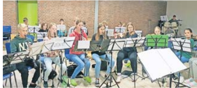
Das Jugendorchester bei der Sammelwoche.