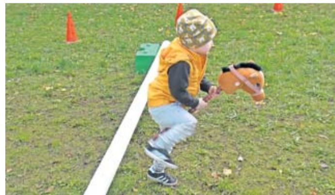
Die Kleinen hatten besonders beim „Hobby Horsing“ viel Spaß.

andere Strickwaren. Auch an die Jüngsten war gedacht. Sie hatten besonders beim „Hobby Horsing“ viel Spaß. Dabei ritten sie auf Steckenpferden über einen kleinen Parcours. Sie konnten aber auch beim Getreide mahlen und „Kuh“ melken helfen. Insgesamt war dieser erste Münzenberger Naturmarkt ein voller Erfolg. Vielleicht wird er nächstes Jahr wiederholt.