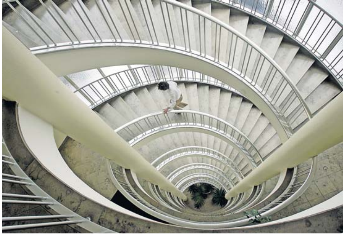
Die Windungen der modernen Arbeitswelt erfordern Anpassungsfähigkeit. Auf neue Situationen souverän reagieren zu können, wird zunehmend zur Schlüsselkompetenz.

Meiner Ansicht nach hat sich während der Pandemie gezeigt, wie notwendig Anpassungsfähigkeit ist.