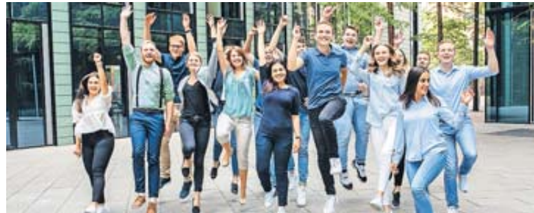
Jetzt in die berufliche Zukunft starten!

Eine Ausbildung oder ein Studium in der Hessischen Finanzverwaltung bedeutet vor allen Dingen: grundsätzliche Übernahmegarantie nach bestandener Prüfung, ein krisensicherer Arbeitsplatz bei einem familienfreundlichen Arbeitgeber, ein kollegiales Miteinander, überdurchschnittliche Bezahlung während der Ausbildung oder dem Studium und tolle Karriere-