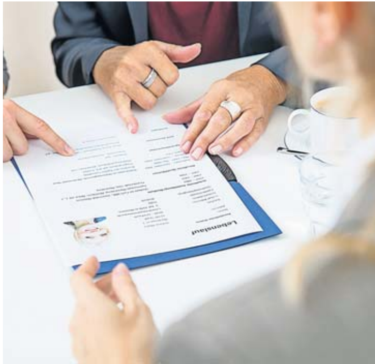
Ist das Sprachniveau im Lebenslauf nach dem Europäischen Referenzrahmen angegeben, hilft dies Personalern, eine Bewerbung genauer einschätzen zu können.

Wichtig ist jedoch, das eigene Wissen fachgerecht zu präsentieren, heißt es auf der Website von Unicum. Angaben wie «Anfänger», «verhandlungssicher» oder «gut» sind den Informationen zufolge dafür nicht der beste Weg. Unicum rät, sich stattdessen am Gemeinsamen Europäischen Referenzrahmen für Sprachen (GER) zu orientieren. Der Referenzrahmen dient als Maß-