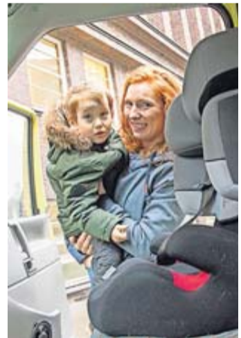
Ganz in der Nähe: Zwar gilt die Rückbank für Kinder als der sicherere Platz zum Mitfahren, aber auch vorn ist grundsätzlich die Mitnahme erlaubt.

Für die Mitnahme von Kindern im Auto gibt es eine grundsätzliche Regel: Sind diese jünger als zwölf Jahre oder kleiner als 1,50 Meter, dürfen sie stets nur in einem passenden Kindersitz mitfahren.