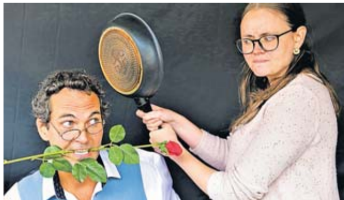
Aufgeführt wird ein Theaterstück der „Zwei Rosbacher Rambelichter“.

Der Eintritt ist kostenlos. Gezeigt wird ein Theaterstück der „Zwei Rosbacher Rambelichter“: frei nach dem Motto: „Ein Tisch, eine Bank, eine Konservendose und zwei scheidungswillige Eheleute – mehr braucht es nicht für einen unterhaltsamen Rosenkrieg in zwei Akten!“ Zur Beförderung der Senioren wird