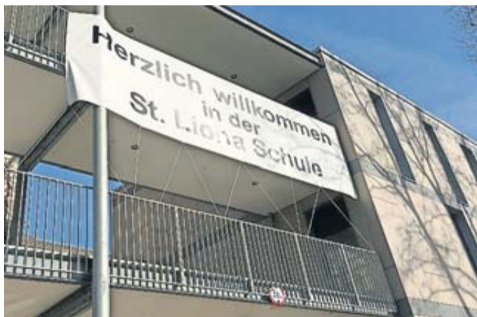
Eine Schule freut sich auf ihre künftigen Schüler.

Tag der offenen Tür an der Sankt Lioba Schule in Bad Nauheim