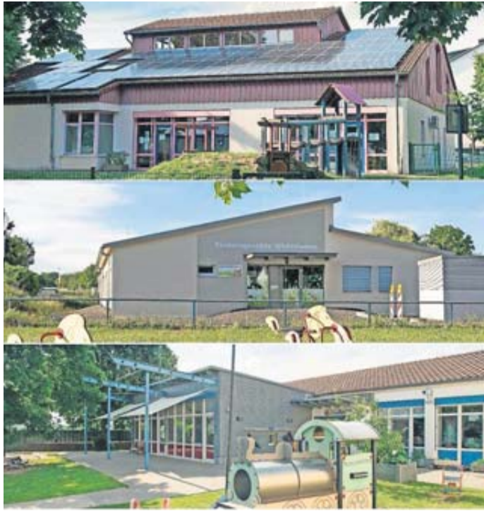
Kita Purzelbaum-Beienheim, Kita Wichtelwiese-Dorn-Assenheim, Kita Flohkiste-Weckesheim

Solche Einbrüche verursachen außerdem erhebliche Folgearbeit: Die Abläufe in den Kindergärten werden gestört, die verwüsteten Räume müssen aufgeräumt, die Einbruchfolgen in der Verwaltung abgewickelt und die Schäden so schnell wie möglich repariert werden. „Das alles bindet die Arbeitszeit unserer Mitarbeiterinnen und Mitarbeiter völlig unnötig. Es ärgert mich, wenn wichtige Dinge liegen bleiben, weil Einbruchfolgen abgearbeitet werden müssen. Das ist letzt-