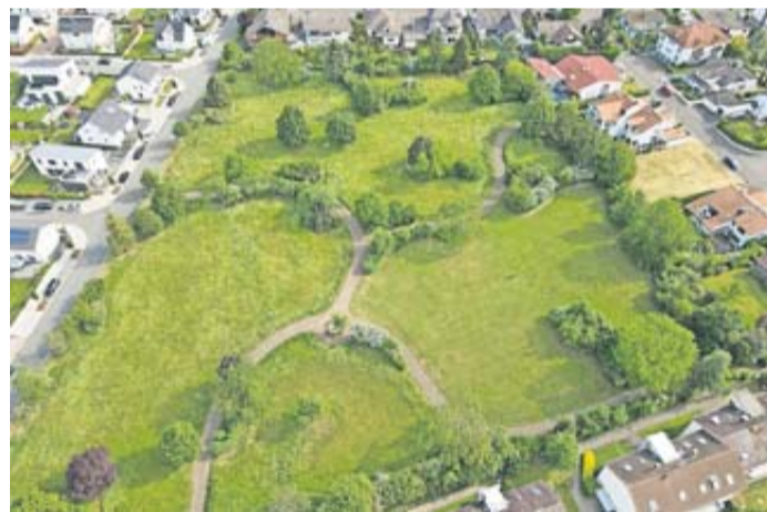
Luftaufnahme der Friedhofserweiterungsfläche.

Für Verpflegung wird gesorgt. Um eine adäquate Planung des Workshops zu gewährleisten, ist eine Anmeldung per Email mit Namen und Adresse unter workshop-nm@gmx.de bis zum 5. März erforderlich. Der gesamte Ortsbeirat Nieder-Mörlen freut sich auf eine sachorientierte und konstruktive Zusammenarbeit an diesem Tag.