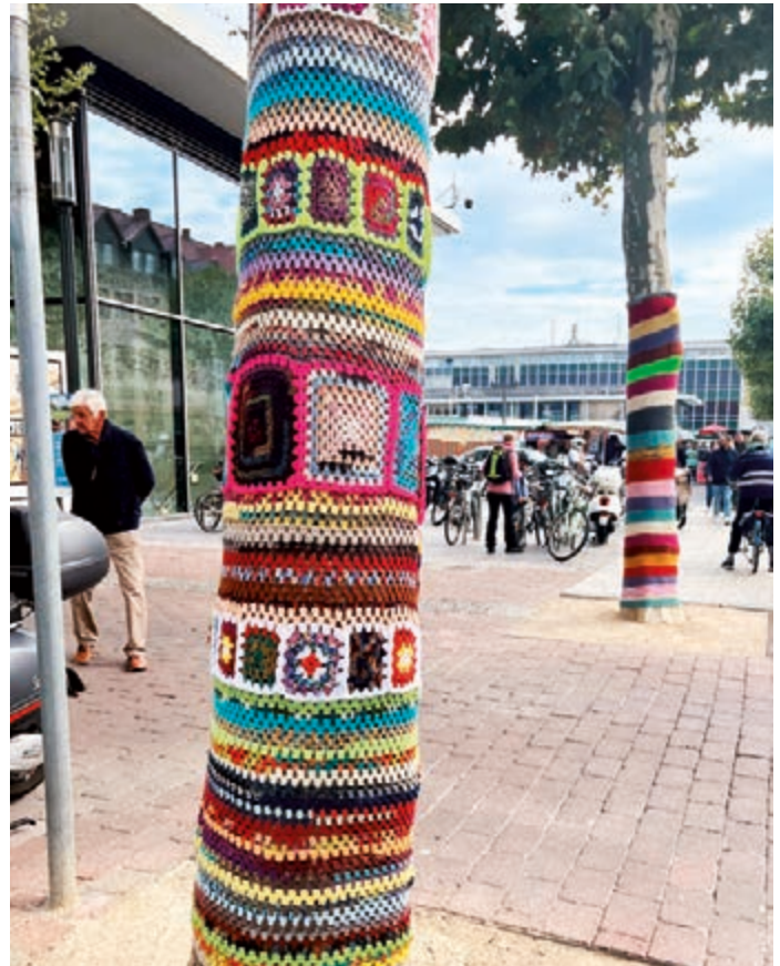
Bunte Kunst: Die fröhlichen Strickwerke sind ein Hingucker in der Innenstadt.

Das Urban-Knitting-Projekt ist Teil der Aktionsreihe „Hanau macht Kunst“, mit der das Team des von der Hanau Marketing GmbH betriebenen Kunstkaufladens Tacheles Kunst in den öffentlichen Raum bringen will. Zur Reihe, die vom Kulturfonds Frankfurt-Rhein-Main gefördert wird, gehören Workshops, Live-Painting-Aktionen im Straßenraum und die Etablierung legaler Graffiti-Flächen. Mehr Informationen gibt es unter www.tacheles.hanau.jetzt .