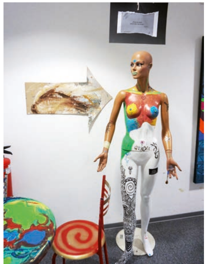
Dass Kunst unendliche Ausdrucksformen bietet, zeigt sich im Atelier Fluchtpunkt an vielen Stellen.

Regionalverband Hanau & Main-Kinzig Friedberger Straße 9, 63452 Hanau ☎ 06181 90010-0 www.johanniter.de/mkk