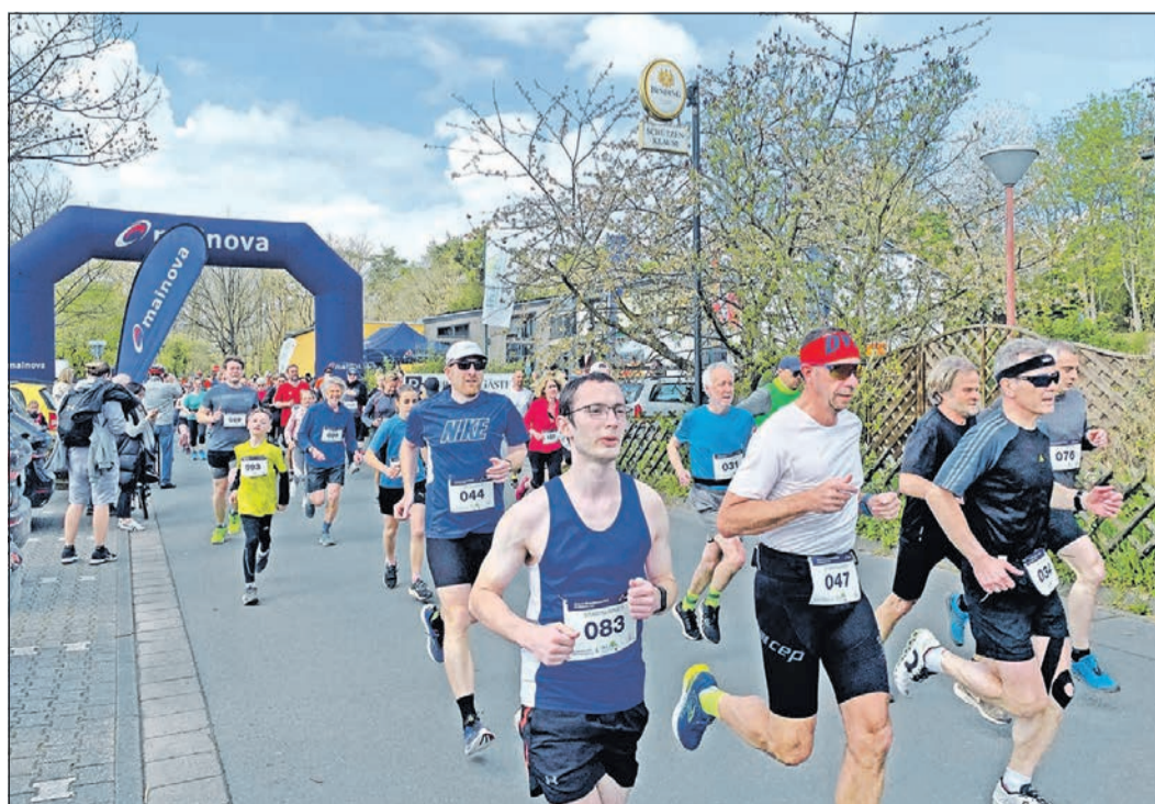
Mehr als 80 Läufer gehen beim 2. Mainova Streuobstwiesenlauf durch die Kirdorfer Felder auf die 5,26 Kilometer lange Strecke.