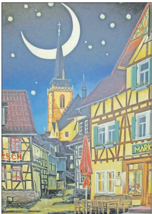
„Schnittmenge“ – großformatiger, fotografischer Blick auf die St.-Ursula-Kirche mit Halbmond – von Magnus Hornung.