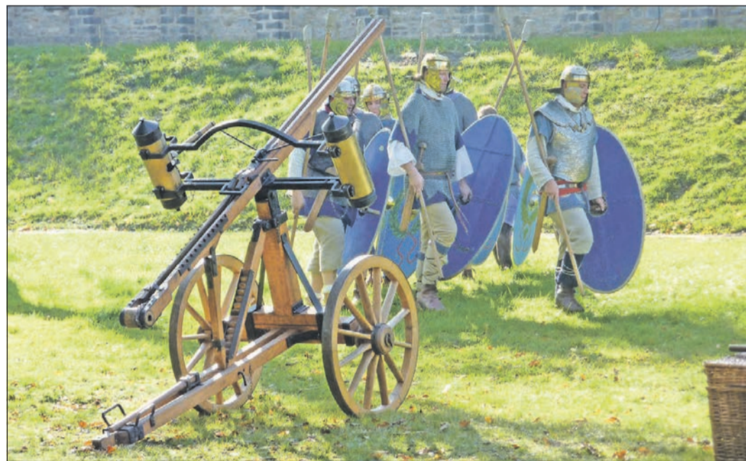
Römische Soldaten schlagen am 30. April sowie am 1. Mai im Römerkastell Saalburg ihre Lager auf.

Max-Planck-Straße 12 65779 Kelkheim Tel. 0 61 95 – 91 15 94 www.schreinerpreuss.de E-Mail: info@schreinerpreuss.de Schreiner Preuß GmbH Raumgestaltung in Holz Partnerbetrieb