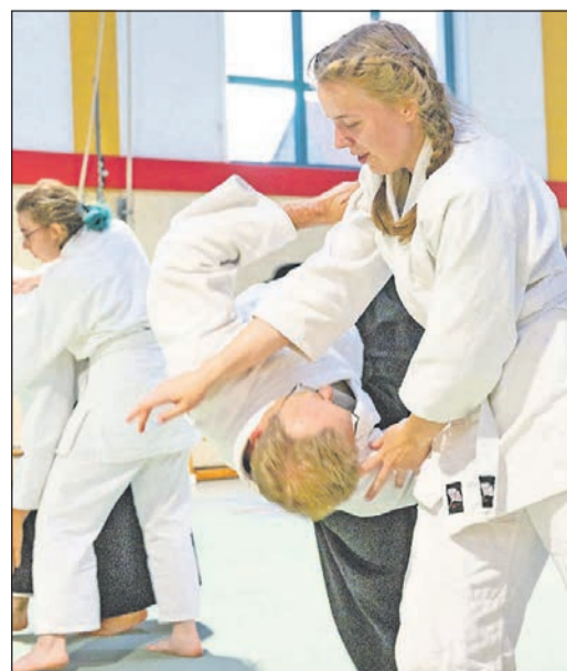
Im Kurs lernt eine Aikidoschülerin, einen Angreifer zu werfen.

19 Uhr und am Montag, 8. Mai, von 18.30 bis 19.30 Uhr. Die Veranstaltungsorte sind sonntags das Vereinsheim des TV Weißkirchen, Oberurseler Straße 16, in Oberursel und montags die Turnhalle der Landgraf-Ludwig-Schule, Rathausstraße 13, in Bad Homburg. Anmeldung und weitere Details im Internet unter https://aikido-oberursel.de/2304 .