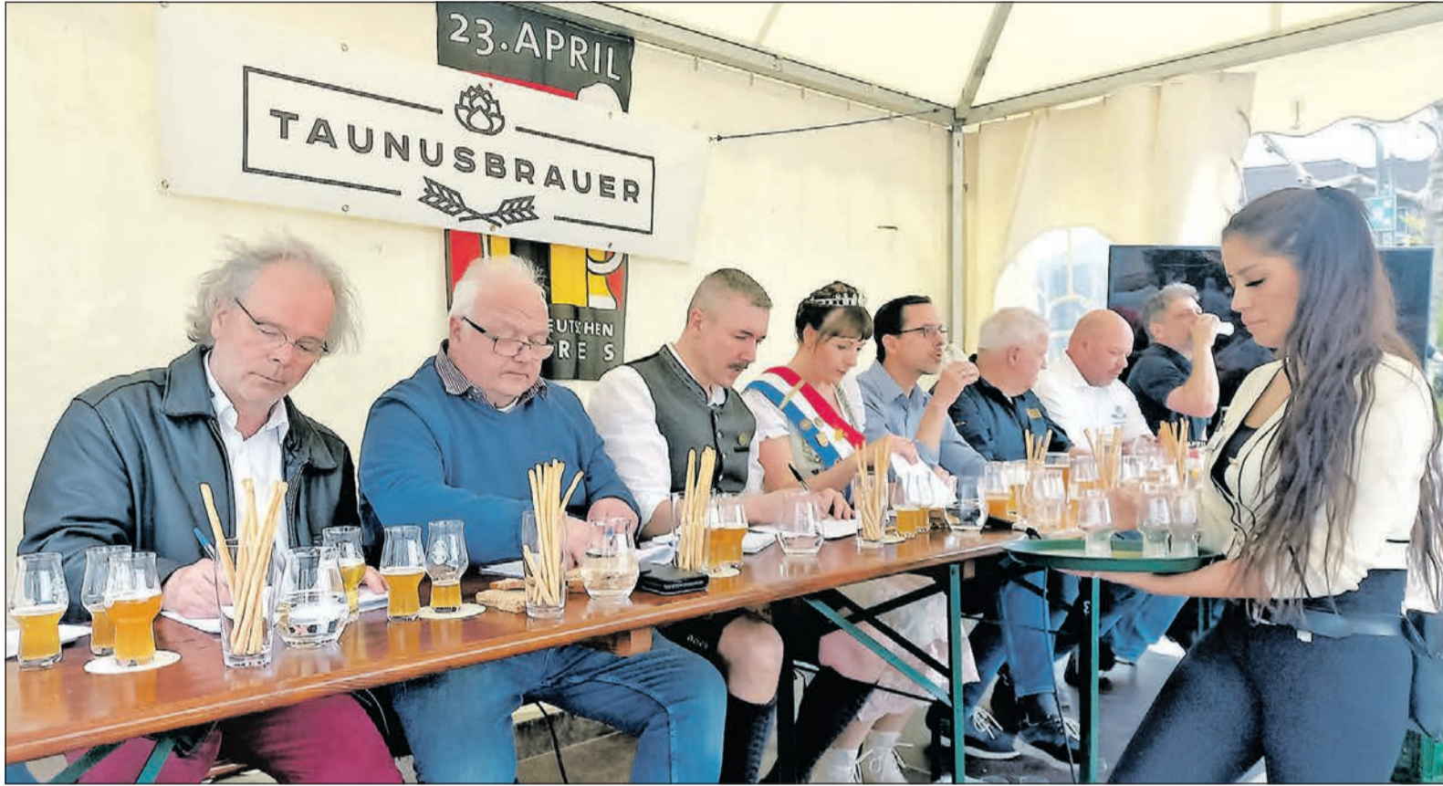
Experten inklusive Brunnenkönigin bei der Arbeit: Die Jury ist trotz charmanter Bedienung mit stets neuem Kaltgetränk konzentriert bei der Arbeit, hier soll schließlich nach dem Genuss von 13 Proben der beste Taunusbrauer gekürt werden.