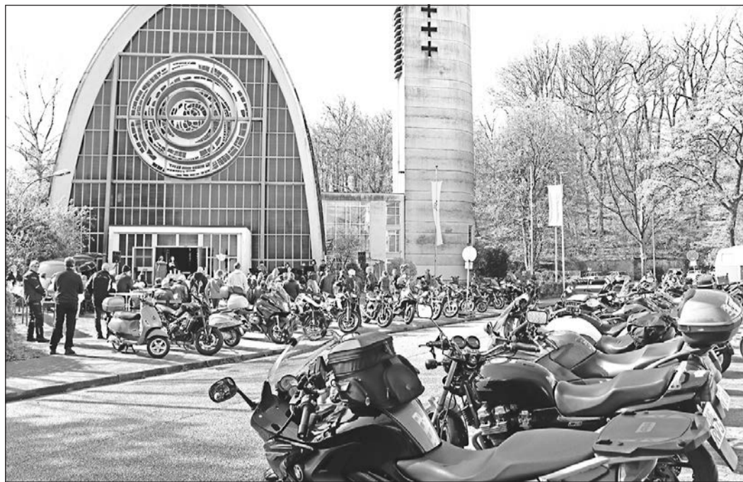
35 Motorräder warten zusammen mit weiteren Zwei- und Dreirädern während des Gottesdiensts darauf, mit Weihwasser gesegnet zu werden.

Für die Schulgemeinde Jens Henninger, Schulleiter der Bischof-Neumann-Schule