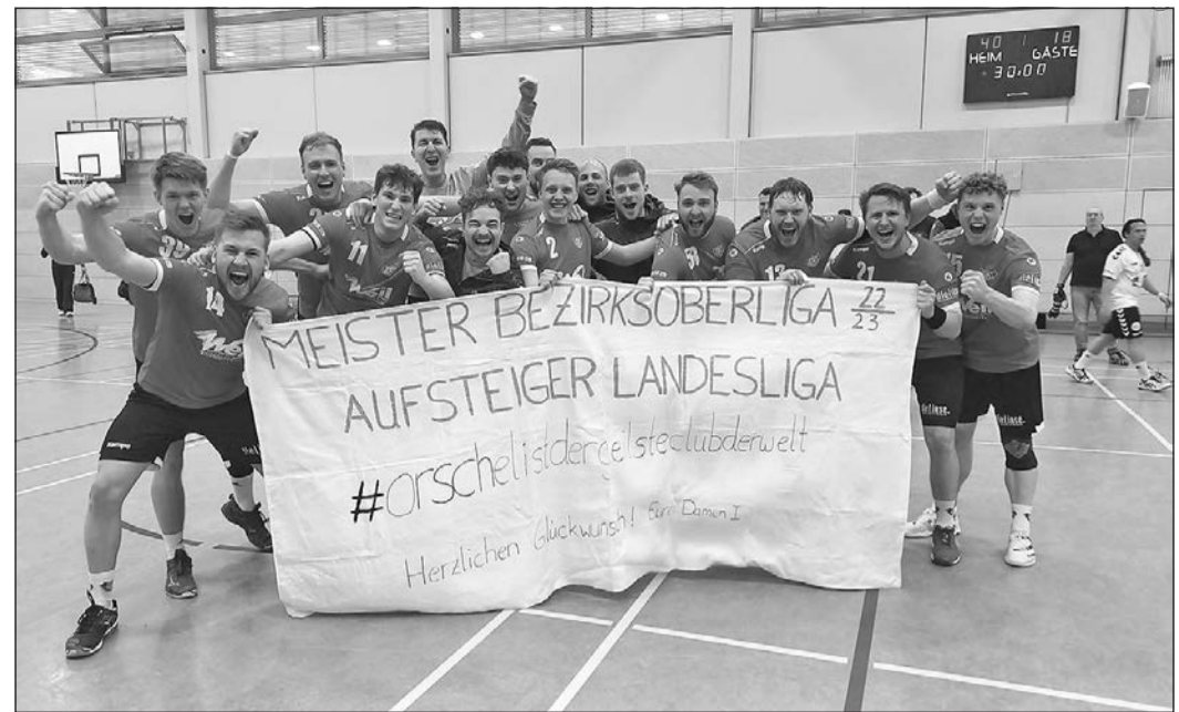
Riesenjubiläum bei den Handballern der TSG Oberursel nach dem Meisterstück gegen TuS Holzheim. Mit 40:18 wurden die Gäste aus der Halle gefegt, die TSGO-Damen haben es wohl schon geahnt. Direkt nach dem Schlusspfiff überreichten sie für das Siegerfoto ein Transparent ab den „Meister Bezirksberleitung – Aufsteiger Landesliga“.

Frauen-Gruppenliga Südost: SV Phönix Dödelshausen – SG Westerfeld (Sa., 17.00). (gw)