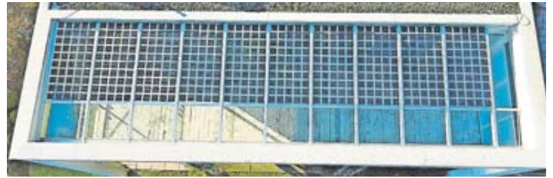
Eine maßgefertigte Überdachung/Carport mit halb-transparenten Solarpaneelen kann ganz individuell auf die Kundenwünsche zugeschnitten werden.

Voraussetzung für ein einwandfreies, dem edlen Werkstoff gerecht werdendes Ergebnis ist eine saubere und exakte Verarbeitung. Dies wird durch die Firma Helker Form und Design GmbH als Metallbau Fachbetrieb stets gewährleistet. Auch Sonderwünsche und Anregungen eigener Gestaltung finden hier bei den Experten stets ein offenes Ohr. Der Familienbetrieb versteht sich als Allround-Dienstleis-