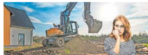
Gebäude abdichten, ganz ohne Ausschachtung.

„Die eigenständigen Fachbetriebe der BKM Mannesmann AG setzen bei der Behebung und Vermeidung von Feuchtigkeitsschäden auf zertifizierte Abdichtungsmethoden von innen. Wir verzichten bewusst auf Ausschachten und Freilegen,