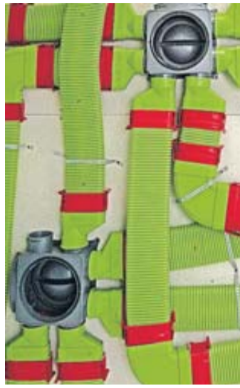
Eine Lüftungsanlage übernimmt den Luftaustausch im Haus.

«Alles andere ist ungesund», heißt es von den VPB-Bausachverständigen. Denn in schlecht gewarteten Filtern sammeln sich mit der Zeit Keime und Schadstoffe an, die immer wieder mit in die Innenräume gelangen. Das