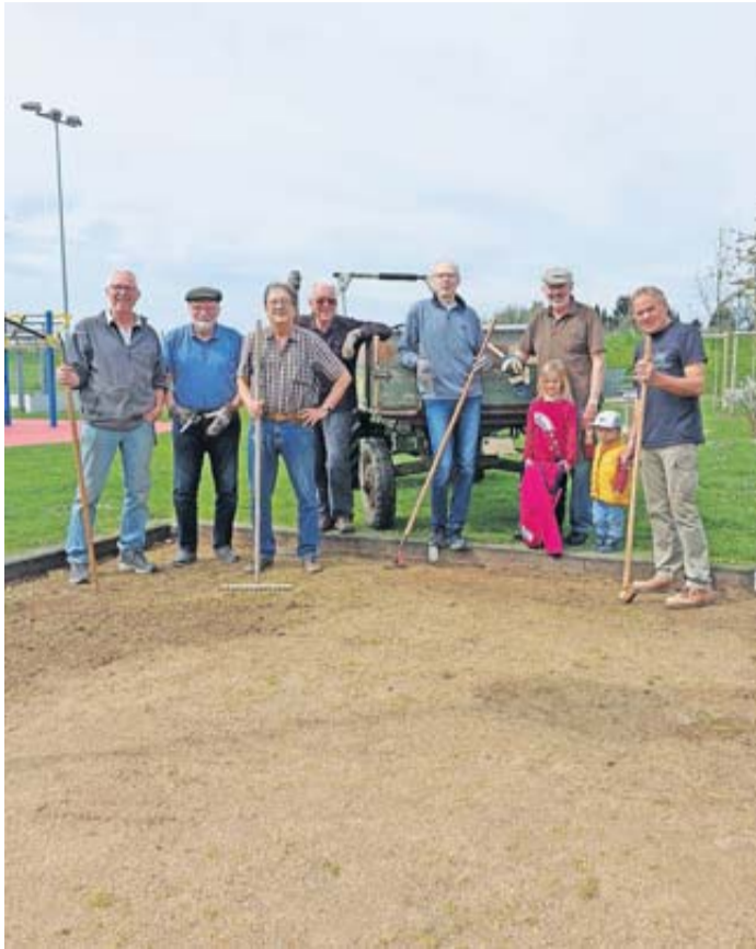
Zum Start brachten die Mitglieder den Platz auf Vordermann.

Rosbach. Einige Mitglieder der FBR (Freie Boule Rodheim) befreiten kürzlich zum Start der neuen Saison mit Unterstützung von Enkeln den damals unter Regie der SG Rodheim selbst gebauten Bouleplatz am herrlichen Sportzentrum in Rodheim von dem unterjährig gewachsenen Un-