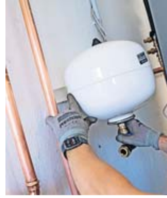
Kann sich lohnen: Der Einbau einer geförderten Heizung.