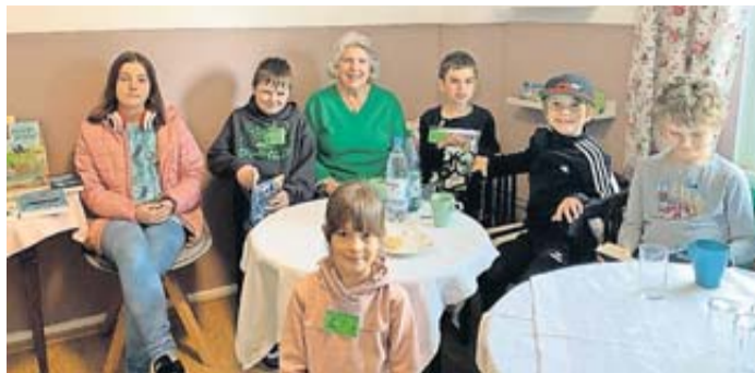
Gemütliche Leserunde im Kulturcafé.