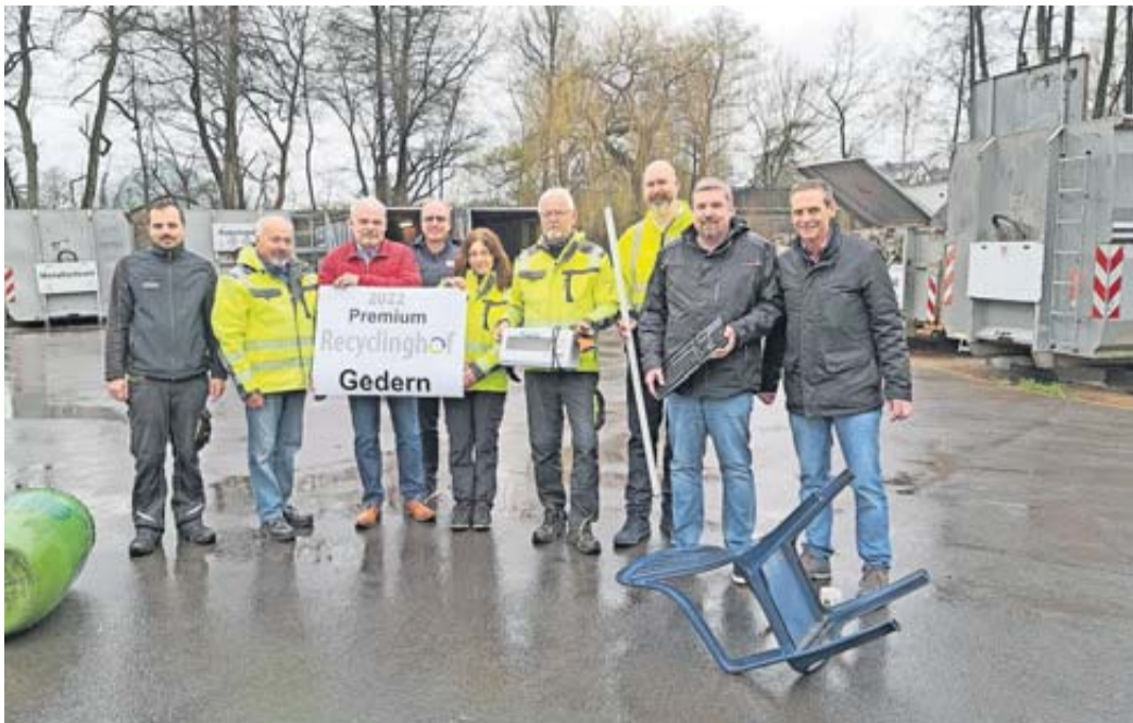
Das ausgezeichnete Team des Recyclinghofs Gedern.

Premium Recyclinghöfe in Gedern und Echzell