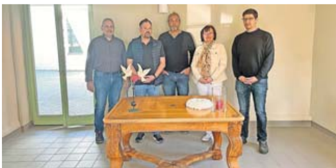
Der Trau-Tisch aus dem historischen Rathaus Münzenberg hat im Amtshaus in Niddatal-Kaichen eine vorläufige neue Bleibe gefunden.

Künftig Trauungen an Münzenberger Original