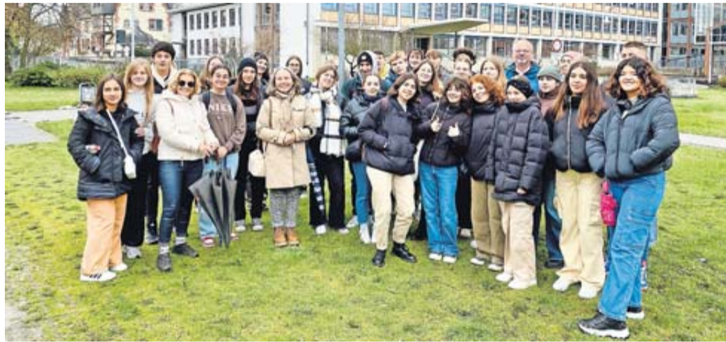
Die Friedberger Gastfamilien hatten nun die Gelegenheit, die Gastfreundschaft zu erwidern.

Jugendliche aus Partnerstadt Entroncamento zu Gast in Friedberg