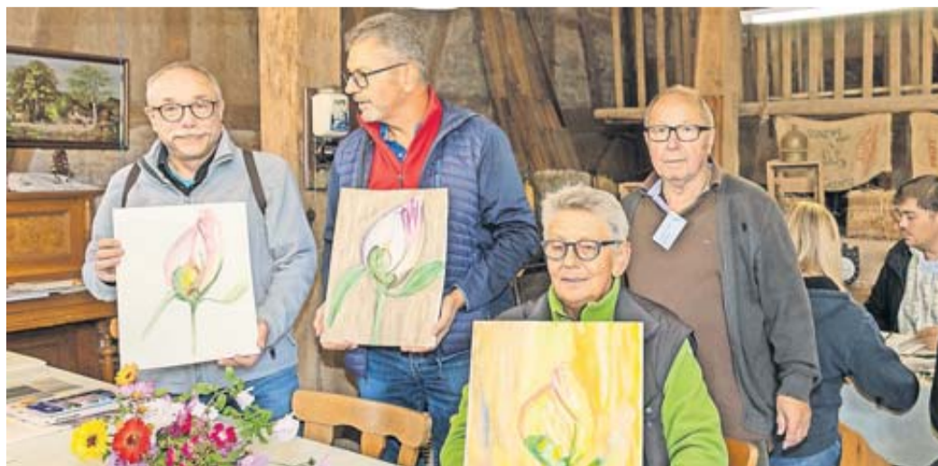
Dieses Jahr bietet der Verein vier Workshops an.

Infos/Anmeldung erfolgt über folgende Emailadresse: info@kraniche-florstadt.de ; oder per Telefon 01736378588. Der Vorstand der Kraniche freut sich allen Kunstinteressierten und Kunstkennern mitzuteilen, dass vom 13 bis 15. Oktober eine große Ausstellung bevor steht mit dem Thema Sehnsucht ...nach Frieden, ...nach Freiheit, ...nach Freude, ... Leben, ...nach Liebe, ...nach Bildung... Die Ausstellung findet dieses mal wieder im Bürgerhaus Florstadt-Stammheim, mit den Partnerstädten aus den Nachbarländern, statt.