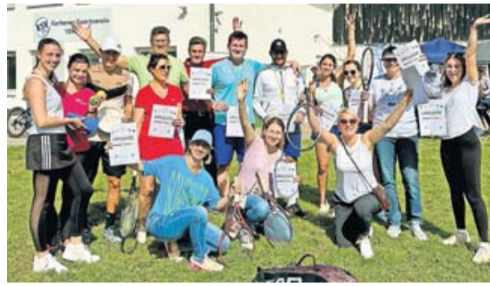
Die erfolgreichen Absolventen des DTB Tennis-Sportabzeichens.