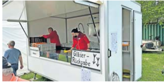
Vergangene Woche wurde das Spülmobil auf dem Melbacher Sportplatz erstmals aufgebaut und in Betrieb genommen.

Eine weitere Gelegenheit ergab sich im vergangenen Sommer. Das Jubiläum der Gemeinde am See wurde im