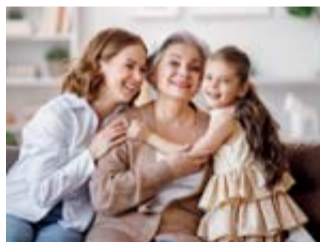
Machen Sie den Muttertag zu einem fröhlichen Familientag.

Die Entwicklung der Osteoporose verläuft oft schleichend, häufig wird sie erst nach bereits vorliegenden Knochenbrüchen erkannt. Hierzulande erhält nur jede(r) fünfte Betroffene eine angemessene Behandlung. 1 Dabei ist eine frühe