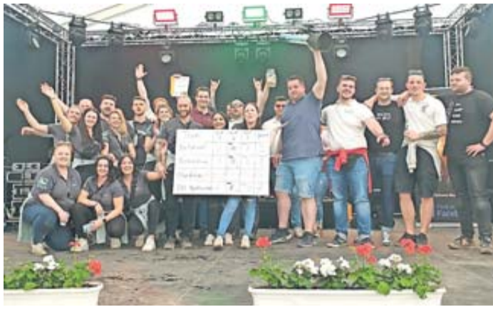
Abschlussbild der Kerb-Olympiade 2023.