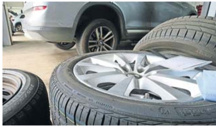
Frische Gummis ans Auto: Das Herstellungsdatum von Reifen kann man an der DOT-Nummer an der Reifenflanke erkennen.

Dass nicht nur brandneue Reifen in den Verkauf gehen, hat laut ADAC mehrere Gründe wie etwa die rationale Fertigung und Lagerhaltung für eine Vielzahl von