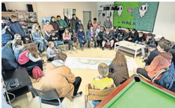
Austausch im Jugendzentrum.

Wie soll der Skatepark am Bahnhof aussehen?