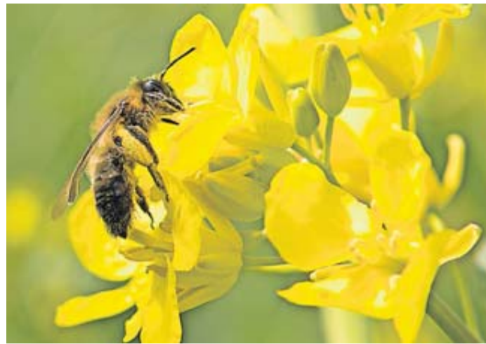
Bienen brauchen geöffnete Blüten, an deren Pollen und Nektar sie kommen.

Was Bienen brauchen, liegt auf der Hand. Zum Überleben benötigen sie einen sicheren Unterschlupf, einen Ort, um Nachwuchs zu bekommen und aufzuziehen. Und vor allem viel Nahrung. Doch gerade das bekommen sie in vielen Gärten nicht – denn ausgerechnet einige der beliebtesten Pflanzen geben ihnen keine Nahrung oder diese ist durch Züchtung außerhalb von ihrer Reichweite gelangt. Zum Beispiel Pflanzen mit sogenannten vollgefüllten Blüten – also die besonders prächtig wirkenden Varianten mit mehr Blütenblättern, die etwa eine große Kugel bilden. Die Bienen können oft nicht durch diese Blütenblätter kriechen und an die Pollen und den Nektar im Inneren gelangen. Zu diesen wenig bienenfreundlichen Blüten zählen etwa gefüllte Pfingstrosen sowie Bauern-Hortensien, deren große farbige Bälle nur Scheinblüten sind und die eigentlichen Blüten abschirmen. Besser sind offene und kelchförmige Blüten, deren Mitte voller Pollen man gut erkennen kann. Aber auch augenscheinlich so einfach zugängliche Blüten sind keine Garantie für Bienenfreundlichkeit: Einige Züchtungen sind steril, zum Beispiel die meisten Forsythien.