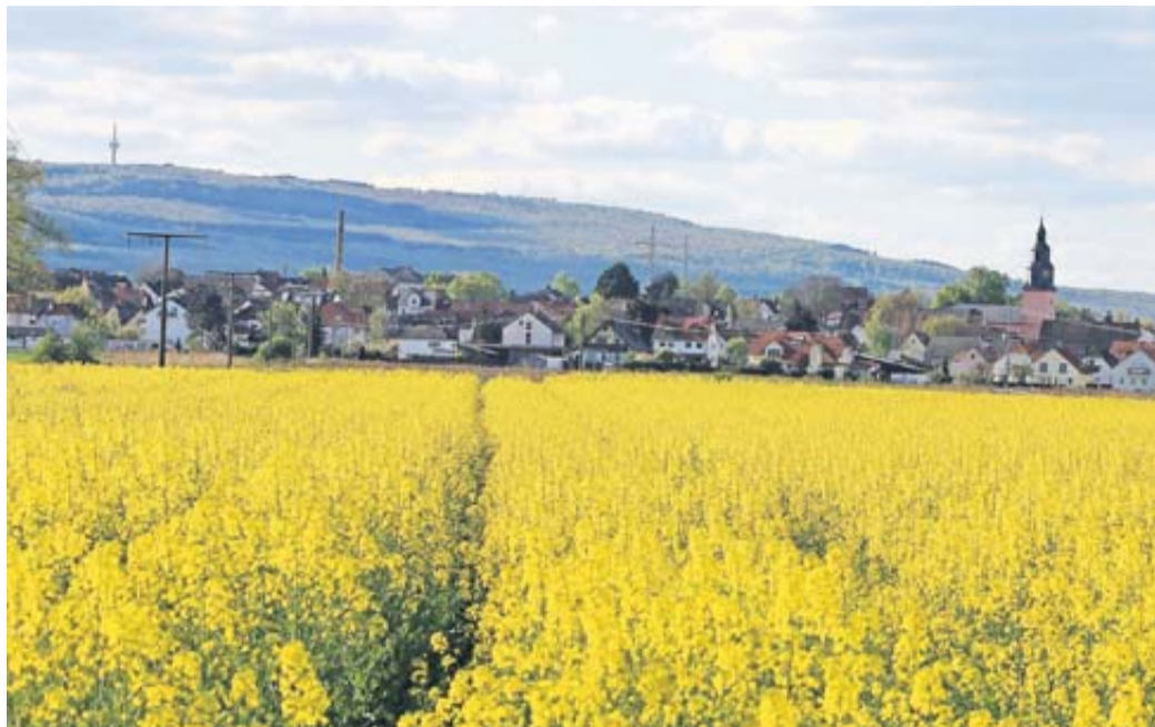
Wöllstadt mit dem Wintersteinturm ganz im Hintergrund.

Wachstum in der Wetterau bis 2050 in Hessen am stärksten