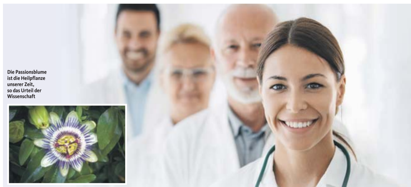
Die Passionsblume ist die Heilpflanze unserer Zeit, so das Urteil der Wissenschaft

Gasteo® Flüssigkeit zum Einnehmen. Wirkstoffe: Gänsefingerkraut, Süßholzwurzel, Angelikawurzel, Benediktenkraut, Wermutkraut, Kamillenblüten. Traditionelles pflanzliches Arzneimittel zur Anwendung bei leichten Verdauungsbeschwerden (z.B. Völlegefühl, Blähungen), sowie leichten krampfartigen Beschwerden im Magen-Darm-Trakt ausschließlich auf Grund langjähriger Anwendung. Enthält 40 Vol.-% Alkohol. (Stand: 11/2022) Zu Risiken und Nebenwirkungen lesen Sie die Packungsbeilage und fragen Sie Ihren Arzt oder Apotheker. Cesra Arzneimittel GmbH & Co. KG, Braunnattstraße 20, 76532 Baden-Baden