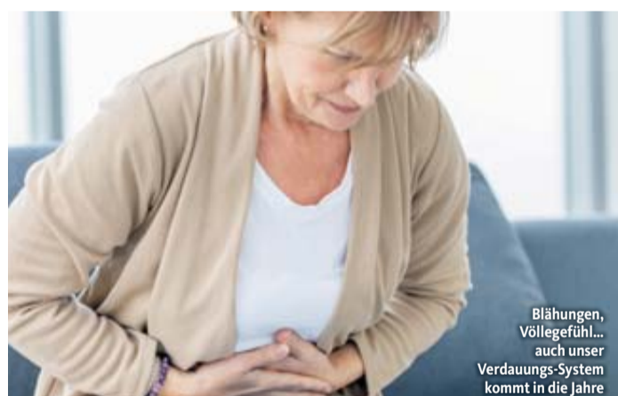
Blähungen, Völlegefühl... auch unser Verdauungs-System kommt in die Jahre