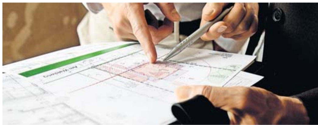
Verträge sind beim Hausbau das A und O. Im Streitfall bieten die Schriftstücke eine bessere Absicherung als mündliche Vereinbarungen.

Abreden mit Handwerkern auf der Baustelle hält man besser schriftlich fest. So sind Bauherren im Streitfall immer auf der sicheren Seite - falls sich mal niemand mehr an mündliche Abreden erinnern möchte. Werden also etwa zwischen Bauherr und Handwerkern Maßnahmen und Arbeiten besprochen, rät der Verband Privater Bauherren (VPB) zum Abfassen eines gleichlautenden Texts für alle Beteiligten. Darin werden die getroffenen Vereinbarungen konkret beschrieben. Unter jedes