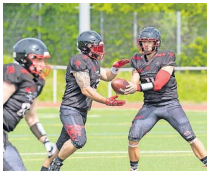
Vor gut 250 Zuschauern auf dem Singberg Kunstrasen in Wölfersheim ging es am Sonntag gegen die zweite Mannschaft der Marburg Mercenaries um die ersten Punkte in der Landesliga Mitte.

Für die Bulls geht es nun am 21.05 gegen die Bürstadt Redskins in Spiel zwei weiter. Kickoff in Wölfersheim auf dem Singberg Kunstrasen ist um 15 Uhr.