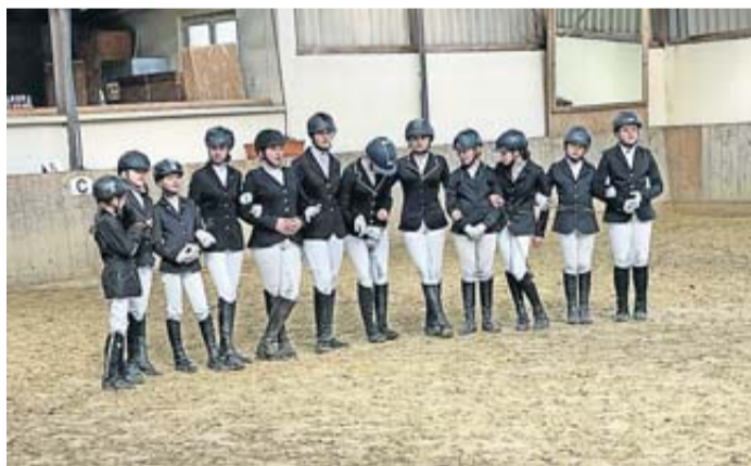
Zum Abschluss fand eine gemeinsame Siegerehrung statt.

Echzell. Traditionell beginnen die jüngsten Reiter des Kreisreiterbundes Wetterau die Saison mit dem Winter-Jugend-Wettbewerb (WJW). In diesem Jahr konnte diese Veranstaltung, erstmalig nach der Pandemie, wieder im normalen Modus stattfinden und mit allen drei Wettbewerben, Dressur, Springen und auch wieder einer gemeinsamen Theorieprüfung stattfinden. Der WJW ist eine Jugendserie für Nachwuchsreiter des KRB Wetterau. Die Vereine haben die Möglichkeit Jugendliche an den Turniersport heranzuführen. Die Kids können, gemeinsam mit Vereinskameraden, erste Turnierluft in einem Dressur- Spring- und Theorie-wettbewerb schnuppern. Zusätzlich zu den Einzelnoten gab es eine Mannschaftswertung, die das Teamdenken und den Zusammenhalt in der Gruppe stärkt. Für die Einzelwertung findet eine Unterteilung nach Fortgeschrittenen und Einsteigern statt. In der Mannschaftswertung werden die 4 besten Ergebnisse aus jeder Disziplin und jeder Veranstaltung pro Verein gezählt.