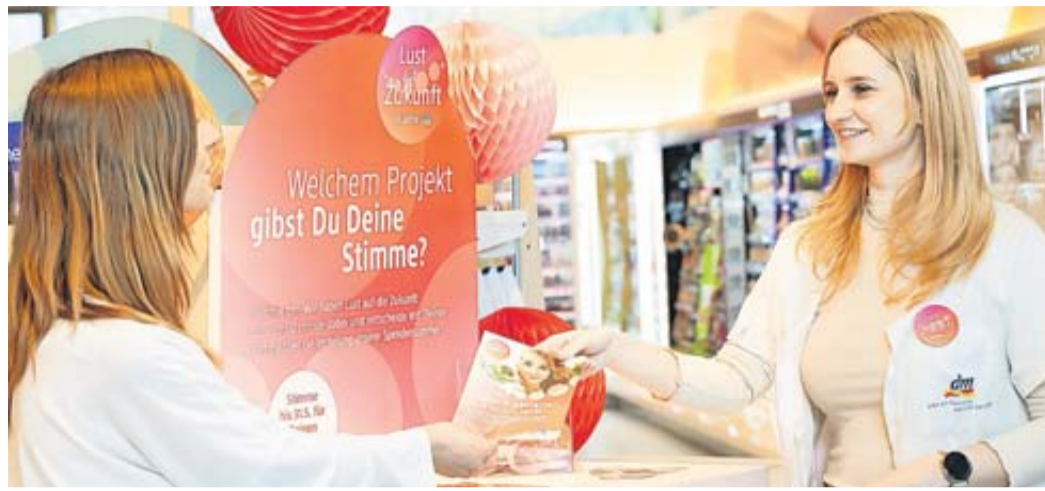
Zum Jubiläum eine Bühne für zukunftsweisende Projekte.

Zum Auftakt dieser Zukunftsinitiative fördert dm rund 3.000 Projekte von Vereinen, Organisationen oder Initiativen, die sich für die Zukunftsthemen engagieren. In den mehr als 2.000 dm-Märkten in Deutschland stellen sich vom 19. bis 31. Mai je zwei Zukunftsprojekte aus dem lokalen Umfeld vor. In diesem Zeitraum heißt es „Zukunft gestalten, Freude teilen“, und Kundinnen und Kunden können in den dm-Märkten ihrem Favoriten ihre Stimme geben. Am Ende der Aktion unterstützt jeder dm-Markt das jeweilige Projekt mit mehr Stimmen mit einer Spendensumme in Höhe von 600 Euro. Das zweitplatzierte Projekt wird mit jeweils 400 Euro unterstützt. „Unseren 50. dm-Geburtstag