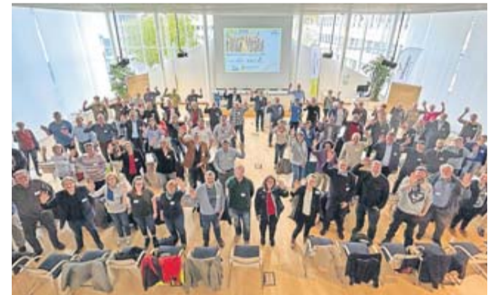
Auch beim zweiten Streuobstvernetzungstreffen im Friedberger Kreishaus heben sich viele Hände für den Streuobstschutz.