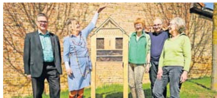
Mit dem Insektenhotel ist ein Anfang gemacht.

Erfolgreiche Initiativen der Grünen in Bauernheim