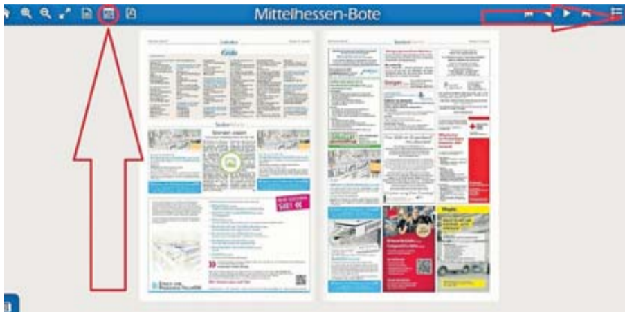
Das E-Paper des BOTEN hat viel zu bieten, wie den Zugriff auf alte Ausgaben über das Kalendersymbol oder die Volltextsuche.

nes wieder schwarz auf weiß in Erinnerung rufen. Wenn Sie sich einen Überblick über Veröffentlichungen zu einem bestimmten Stichwort