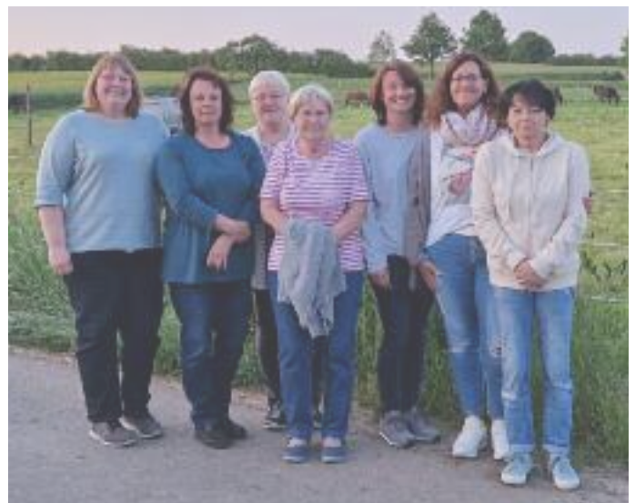
Foto von links nach rechts:

Doch zur Jahreshauptversammlung kam die Neuwahl des Vorstandes. Und siehe da, es hat sich ein 7-köpfiger Vorstand gefunden. Die Zahl 7 wird von vielen als Glückszahl empfunden, so kann der neue Vorstand nun in eine rosige Zukunft blicken.