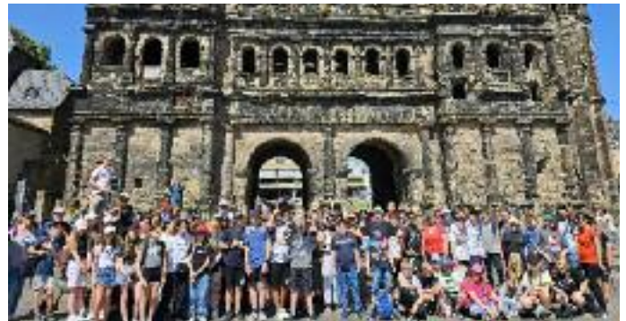
Oben: 100 Germanen ante portas. Die Porta Nigra heißt 100 Schülerinnen und Schüler der Henry-Harnischfeger-Schule Bad Soden-Salmünster in Trier willkommen.

Das Wetter spielte mit und die Schülerinnen und Schüler wurden erschöpft, aber glücklich von ihren Eltern am Freitag wieder in Empfang genommen.