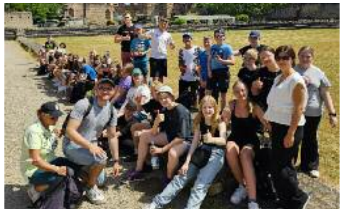
Unten: Die Klassen 6a und 6b in den römischen Kaiserthermen.