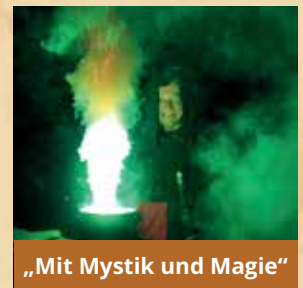
„Mit Mystik und Magie“