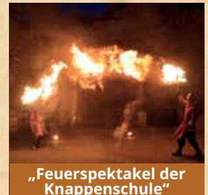
„Feuerspektakel der Knappenschule“