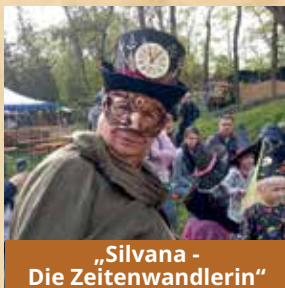
„Silvana - Die Zeitenwandlerin“