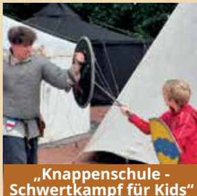
„Knappenschule - Schwertkampf für Kids“