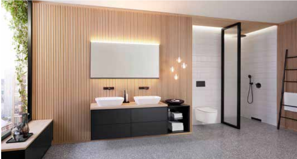
Perfekte Badgestaltung bis ins kleinste Detail: dunkle Fliesen und eine schwarze Duschrinne.

Effektvoller Einsatz dunkler Töne in der heimischen Wellness-Oase