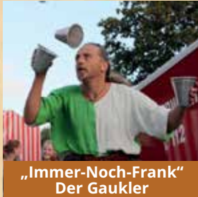
„Immer-Noch-Frank“ Der Gaukler

Schlosshof im Wehener Schloss Do 8. Juni (Fronleichnam), 12 - 22 Uhr Fr 9. Juni, 11 - 18 Uhr