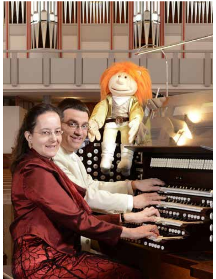
Orgel-Duo Lenz a Bekannte Melodien

Der Eintritt ist frei (Kollekte erbeten). Dauer: ca. 1 Stunde. Infos zu den Ausführenden und Demo-Video zum Konzert: www.lenz-musik.de .