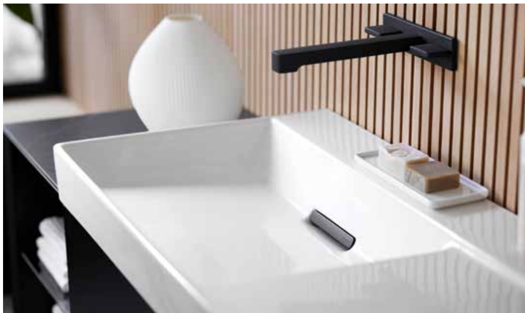
Die schwarze Farbe des Unterschranks wird auch in der Ablaufblende des Waschtischs aufgenommen.

allzu dunklen Oberflächen mit schwarzen Armaturen zu kombinieren. Ein gewisser Kontrast sei wichtig, damit diese Elemente auch zu Geltung kommen. Zu schwarzen, matten Oberflächen mit reduzierter Ausstrahlung kombiniert er bevorzugt Materialien mit sehr viel Charakter. Als Beispiele nennt er handglasierte Fliesen, bei denen jede etwas unterschiedlich ist oder Natursteine mit einer starken Maserung - und unbedingt Holz, das für ihn eigentlich in jedes Badezimmer gehört.