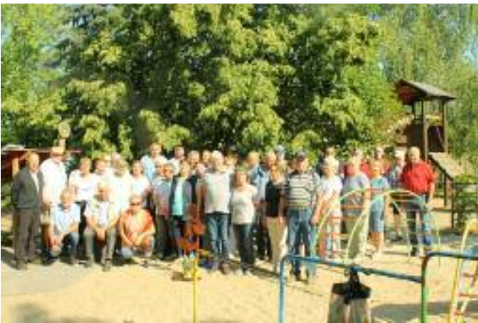
Singen vor der Linde auf dem Kindergartengelände