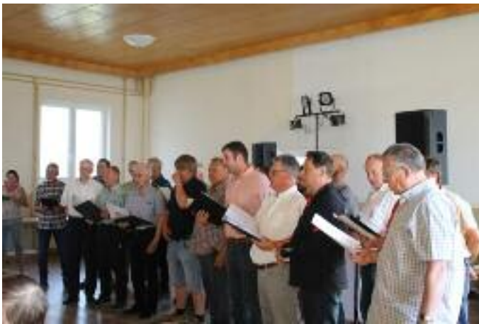
Gemeinsames Singen im Übungssaal in Schönfeld