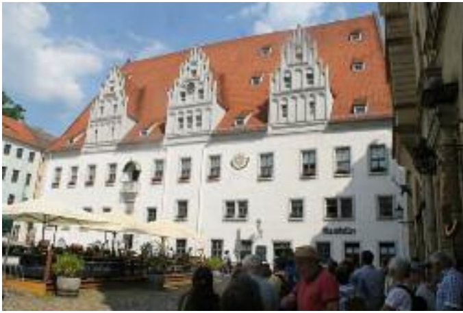
Albrechtsburg in Meissen