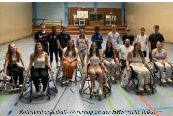
Rollstuhlbasketball-Workshop an der HHS (siehe links)