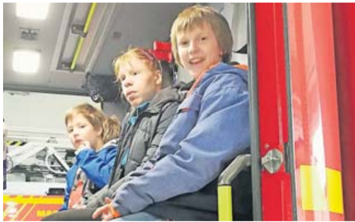
Viel Spaß hatten die Kinder beim Besuch der Freiwilligen Feuerwehr Bad Nauheim im Rahmen der Ferienspiele.

Zum neuen Konzept gehörte auch, den Ferienspieltag bereits um 9 Uhr mit einem gemeinsamen Frühstück zu beginnen. Eine Mitarbeiterin bereitete jeden Morgen ein gesundes und abwechslungsreiches Buffet vor, an dem sich