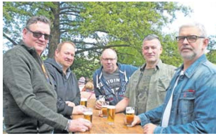
Schöne Stunden bei kühlem Bier genossen die Gäste des Fests.