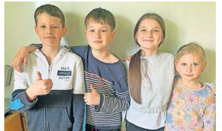
Die ersten ukrainischen Kinder freuen sich über die Unterstützung der DRK Hausaufgabenbetreuung.