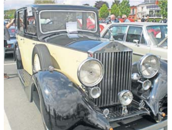
Dieser britische Rolls-Royce aus dem Jahr 1936 war das älteste Automobil.