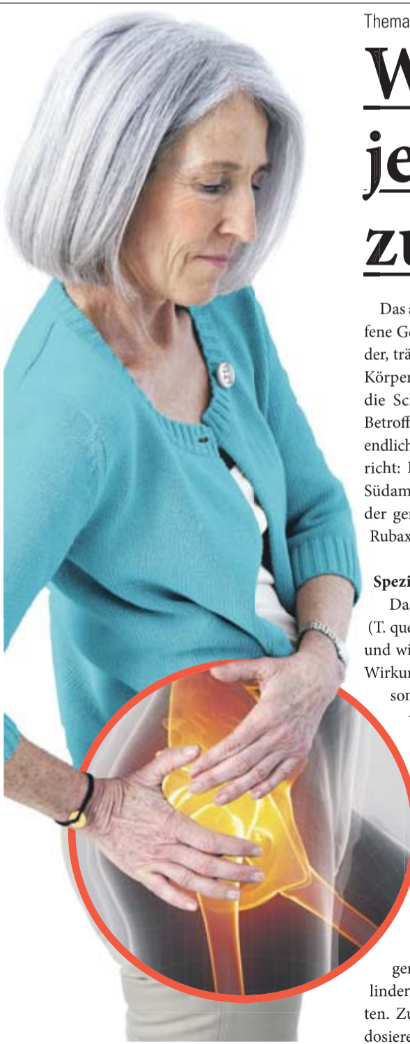
Abbildung Betroffenen nachempfinden

DORISOL Wirkstoffe: Gelsemium sempervirens Trit. D2, Spigelia anthelmia Trit. D2, Iris versicolor Trit. D2, Cyclamen purpurascens Trit. D3 und Cimicifuga racemosa Trit. D2. Homöopathisches Arzneimittel bei Neuralgien (Nervenschmerzen), Kopfschmerzen, Migräne. www.dorisol.de • Zu Risiken und Nebenwirkungen lesen Sie die Packungsbeilage und fragen Sie Ihren Arzt oder Apotheker. • PharmaSGP GmbH, 82166 Gräfelfing