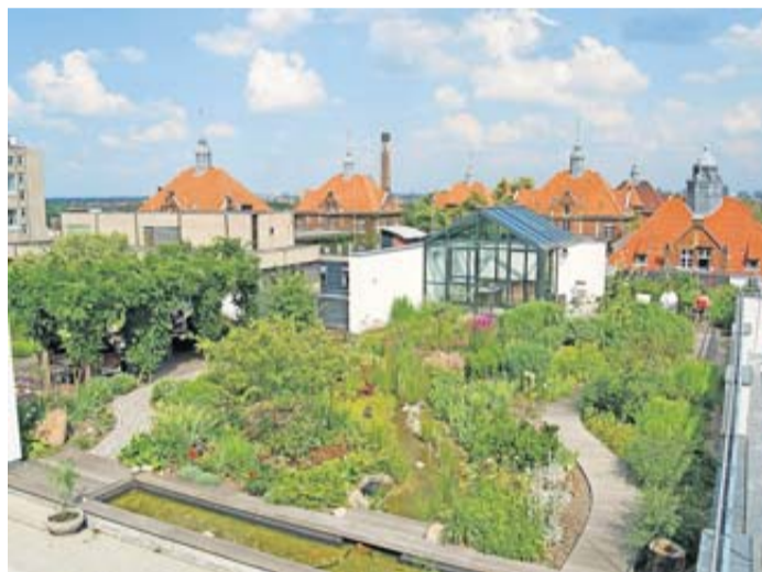
Kommunen fördern mehr Dach- und Fassadengrün.

„Entsiegeln und begrünen“, lautet eine Devise für Städte und Gemeinden, die sich an die erwarteten Klimaveränderungen anpassen wollen. Viele bauen ihre Programme zur Dach- und Fassadenbegrünung weiter aus. 83 Prozent der Städte mit mehr als 50.000 Einwohnern fördern laut dem Marktreport 2022 des Bundesverbands Gebäudegrün indirekt Begrünungen, indem sie die Niederschlagswassergebühr für Hausbesitzer mindern. Denn unversiegelte Flächen und Dachbegrünungen halten Niederschlagswasser zurück, das