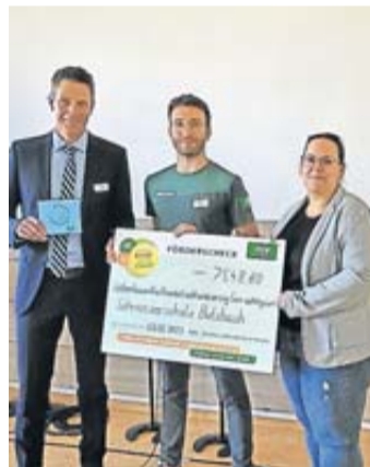
Schrenzerschule ist offizielle „BikeSchool“.

Die Schrenzerschule hat neue Ziele und ein neues Leitbild entwickelt, um Schüler schon in jungen Jahrgängen für Naturwissenschaften und Technik zu begeistern. Die Zusammenarbeit mit der Technischen Hochschule Mittelhessen ist ein großer Schritt in diese Richtung und die Schule ist stolz darauf, die erste Sekundarstufe-1-Schule zu sein, mit der die THM kooperiert. Die Initiative für die Zusammenarbeit kam von einem ehemaligen Schüler, der jetzt als Wirtschaftspate der Schule