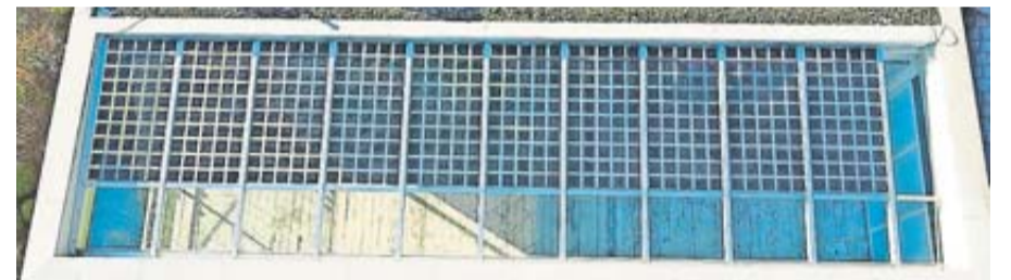
Eine maßgefertigte Überdachung/Carport mit halb-transparenten Solarpaneelen kann ganz individuell auf die Kundenwünsche zugeschnitten werden.

bindet Metall, sowohl im Innen- als auch im Außenbereich, edles Design mit Langlebigkeit und Wartungsfreiheit. Die Voraussetzung für ein einwandfreies, dem edlen Werkstoff gerecht werdendes Ergebnis ist eine saubere und exakte Verarbeitung. Dies wird durch die Firma Helker Form und Design