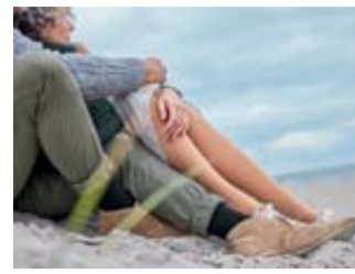
Natürlich gut versorgt und spürbar weich: der neue medizinische Kompressionsstrumpf mediven cotton von medi mit Bio-Baumwolle.

Für die Herstellung verwendet medi reine Bio-Baumwolle. Das Garn ist vom Lieferanten GOTS-zertifiziert (GOTS = Global Organic Textile Standard, www.global-standard.org mit weiterführenden Informationen).