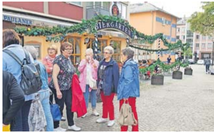
Die Landfrauen besichtigen die Altstadt.

Wöllstadt. Die Neue Altstadt von Frankfurt war das Ziel des Maiausflugs des Landfrauenvereins Ober-Wöllstadt. Gemeinsam führen sie mit öffentlichen Verkehrsmitteln in die Mainmetropole. Hier erwartete sie eine Tour durch manch unbekannte Ecke der Altstadt mit einem kundigen Führer des Vereins „Liebenswertes Frankfurt“. Er zeigte nicht nur die bekannten Häuser zwischen Dom und Römer, sondern auch die versteckten Straßen, die mit besonderen architektonischen Highlights aufwarten. Nach diesem interessanten, lustigen und mit Anekdoten versehenen Spaziergang ging es aufs Schiff, wo die Stadt von Wasserseite