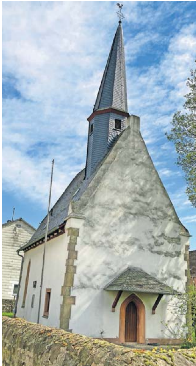
Die besondere Atmosphäre in der renovierten Kirche kann Anfang Juni erlebt werden.

Im Inneren der Kirche hat sich in den vergangenen vier Jahren einiges verändert: Neben einer neuen Heizung mit Lüftung, ist die Elektrik komplett erneuert worden. Auf den ersten Blick beim Eintreten wird der Sandsteinfußboden auffallen sowie Altar und Ambo (Stehpult). Die beiden Prinzipalstücke sind vom Künstlerpaar Charlotte Gehrig und Mark Hilgenfeld aus Plexiglas und des Holzes aus dem alten Altar gestaltet worden. Die Kirche kommt nun völlig ohne Bänke aus, die Kirchenbesucher sitzen künftig auf Stühlen. Wandert der Blick an die Empore ist dort auf den 13 Feldern eine umlaufende Zeichnung zu sehen. Granatapfel, Lilie, Efeu, Rose und Drachenfrucht fallen auf. Das sind Pflanzen, die in der christlichen Mythologie den drei Heiligen zuzuordnen sind, denen die Kirche vor mehr als 600 Jahren geweiht