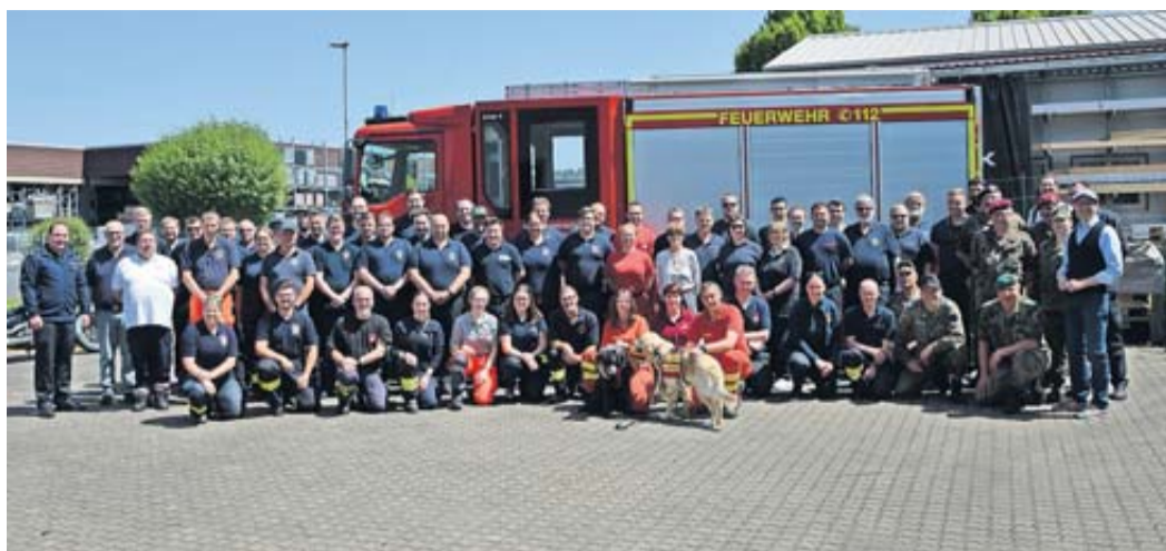
32 Männer und Frauen haben am vergangenen Wochenende erfolgreich ihre Katastrophenschutz-Grundausbildung beendet.

Wetteraukreis. Insgesamt 32 Teilnehmerinnen und Teilnehmer aus den unterschiedlichen Katastrophenschutzeinheiten des Wetteraukreises haben am vergangenen Wochenende erfolgreich ihre Katastrophenschutz-Grundausbildung beendet. Die Grundausbildung ist eine organisationsübergreifende Fortbildung für die Helferinnen und Helfer der im Katastrophenschutz mitwirkenden Organisationen Arbeiter-Samariter-Bund (ASB), Deutsche Lebensrettungs-Gesellschaft (DLRG), Deutsches Rotes Kreuz (DRK), Johanniter-Unfall-Hilfe (JUH), Malteser Hilfsdienst (MHD) sowie der Freiwilligen Feuerwehren (FF). Auch Mitglieder des Technischen Hilfswerks (THW) sowie des Wetteraukreises selbst nahmen an der Veranstaltung teil. Bereits seit 2014 wird das Seminar jährlich im Wetteraukreis angeboten und erfreut sich großer Beliebtheit, so dass die durch die Fachstelle Brand- und Katastrophenschutz angebotenen Ausbil-