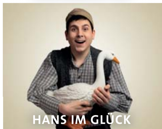
HANS IM GLÜCK