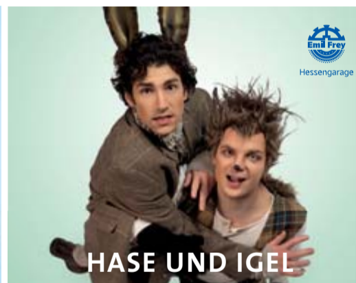
HASE UND IGEL