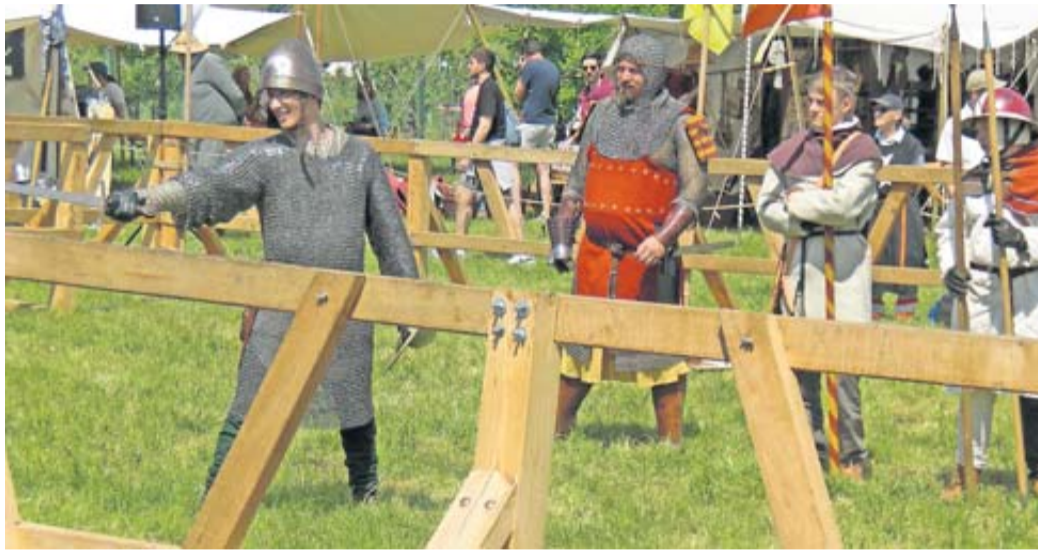
Über alle drei Tage lief ein Vollkontaktturnier mit Rittern in schweren Rüstungen.