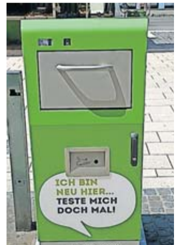
Mr. Fill - der Mülleimer.

In den nächsten Wochen testet die Stadt Friedberg die „smarten“ Mülleimer an verschiedenen Standorten im Stadtgebiet und prüft, wie diese von den Bürgerinnen und Bürgern angenommen werden. Nach der Auswertung wird über die weitere Anschaffung entschieden.