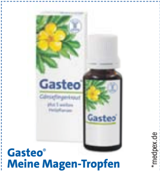
Gasteo® Meine Magen-Tropfen

30 Gasteo-Tropfen werden zu den Mahlzeiten eingenommen oder bei akuten Beschwerden.