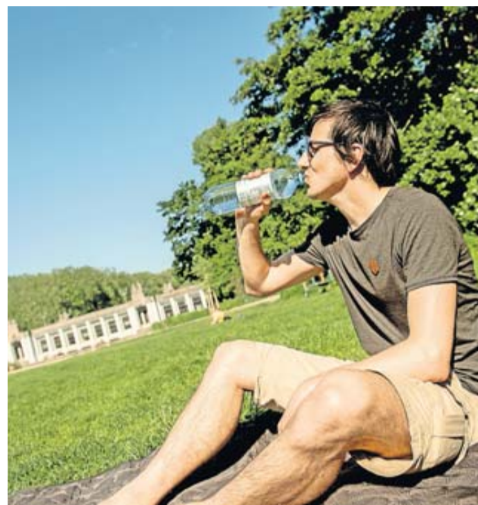
Ausreichend trinken - das ist an Sommertagen besonders wichtig. Eiskaltes Wasser sollte es aber besser nicht sein, denn das kann zu Magenkrämpfen führen.

Vielerorts zeigt sich in diesen Tagen der Sommer. Und schon jetzt ächzen viele unter der Wärme. Denn der Körper ist damit beschäftigt, gut mit den hohen Temperaturen umzugehen. So können wir ihm dabei helfen: Genug trinken: Je mehr wir schwitzen, desto mehr Flüssigkeit verlieren wir. Die Bundeszentrale für gesundheitliche Aufklärung (BZgA) rät daher auf ihrem Portal «Klima Mensch Gesundheit»: etwa zwei bis drei Liter trinken. Die beste Wahl sind Wasser, (gekühlte) Tees ohne Zuckerzusatz und Saftschorlen. Eine Strategie, um dieses Vorhaben auch umzusetzen: Jede Stunde ein Glas leeren - und zwar auch dann, wenn sich kein Durst meldet. Denn der setzt erst ein, wenn der Körper bereits zu viel Flüssigkeit verloren hat. Wer an Sommertagen Sport macht, sollte übrigens noch mehr trinken. Den Körper kühl halten: Dabei kann schon das Outfit den entscheidenden Unterschied machen. Die BZgA empfiehlt Kleidung aus Viskose, dünner Baumwolle, Leinen oder Seide mit lockeren Schnitten. So kann die Luft zirkulieren und die Haut abkühlen. Wer schon mal in einem schwarzen Shirt in der prallen Sonne gesessen hat, weiß: Auch die Farbe zählt. An Sommertagen sind daher helle Kleidungsstücke die beste Wahl.