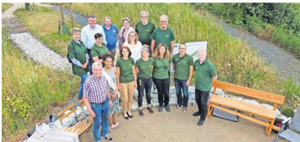
Helfer und Uterstützer am Tag der Einweihung.

Einweihung des Barfußpfades am Fahrenbach