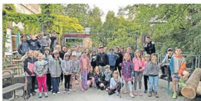
Die Kinder des TSV Griedel vor der Jugendherberge in Grävenwiesbach.

Der TSV Griedel heißt ALLE willkommen, Offenheit, Integration und Solidarität sind Werte, die in unserem Leitbild im Verein, das wir mit DemoS! erarbeitet haben, verankert sind. Unser Ziel ist es die verschiedenen Kulturen den Kindern nicht nur im Sport, sondern auch bei einem gemeinsamen Zusammenleben, wie z.B. bei diesem Jugendher-