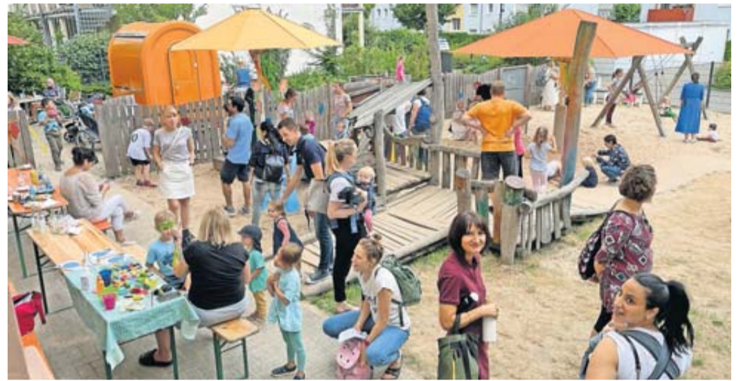
Das Wetterauer Netzwerk für Alleinerziehende (A-Net) veranstaltet einen Sommerbrunch für allein- und getrennt erziehende Mütter und Väter.

Für allein- und getrennt erziehende Mütter und Väter