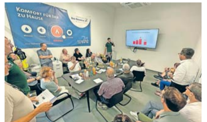
Um mehr zu den Hintergründen und Rahmenbedingungen zu erfahren besuchten die Mitglieder des Bauausschusses die Energiezentrale in Bad Nauheim.

Wölfersheim. Wie sollen Neubaugebiete in der Zukunft aussehen? Eine Frage, die auch die Parlamentarier in Wölfersheim beschäftigt. Ein wichtiger Faktor hin zu klimaneutralen Neubaugebieten ist auch die Wärmeversorgung. Eine mögliche Lösung hierfür bietet das Projekt „kalte Nahwärme“ der Stadtwerke Bad Nauheim. Um mehr zu den Hintergründen und Rahmenbedingungen zu erfahren besuchten die Mitglieder des Bauausschusses die Energiezentrale in Bad Nauheim. Von dort aus wird ein Neubaugebiet mit 400 Wohneinheiten mit Wärme versorgt. An anderer Stelle hat man jedoch auch Erfahrungen mit kleineren Neubaugebieten sammeln können.