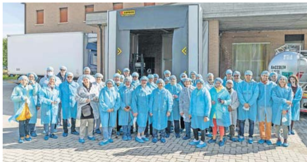
Führung in einer Käseerei.