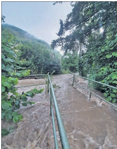
Der Fischbach vor einer Woche, kurz bevor er in den Schwarzbach mündet.

In Eppstein vereinigen sich mehrere Bäche zum Schwarzbach. Als südlichster Zufluss im Stadtgebiet kommt unterhalb der Straße An der Müllerwies der Fischbach hinzu. In Höhe der Amtmannswiesen befindet sich eine Hochwassermessstation, die den Zufluss misst. Deren Pegel schnellte beim starken Regenguss am vergangenen Donnerstag heftig in die Höhe und verzeichnete zwischen 16.30 und 18 Uhr den Anstieg der Wassermenge von weniger als einem Liter Wasser pro Sekunde auf über 6,5 Liter. Für die Anwohner verwandelte sich ihr ansonsten friedliches Bächlein innerhalb kürzester Zeit zu einem reißenden Gewässer, das alles an seinem Rand überflutete.