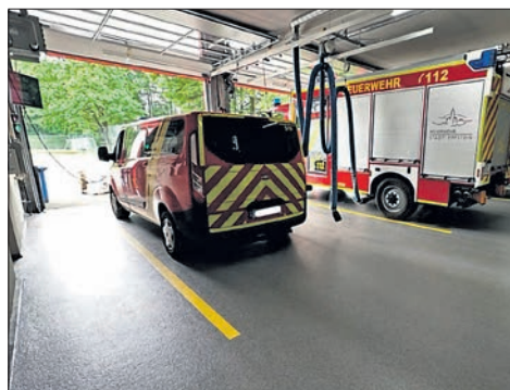
Rutschhemmend und markiert: der neue Boden im Feuerwehrhaus.

Die Stadt Eppstein hat den Boden in der Fahrzeughalle im Feuerwehrhaus Ehlhalten komplett erneuern lassen. Der vorhandene Boden wurde abgeschliffen und die alte, schadhafte Beschichtung beseitigt. Die Risse und Fugen wurden ausgefräst und anschließend vergossen. Die neue Bodenbeschichtung besteht aus mehreren Schichten Acrylharz und ist gemäß den aktuellen DIN-Vorgaben und in Abstimmung mit dem Technischen Prüfdienst des Regierungspräsidiums in den Rutschfestigkeitsklassen R11 (Laufweg zu den angrenzenden Räumen z.B. Flur, Umkleide) und R12 (Rund um die Fahrzeuge) ausgeführt. Für die korrekte Positionierung der Fahrzeuge wurden farbige Markierungen ebenfalls aus Acrylharz aufgebracht. Der Boden wurde auf einer Fläche von rund 135 Quadratmetern erneuert. Die Kosten hierfür betragen rund 18000 Euro. Der