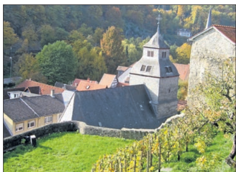
Im Südzwinger von Burg Eppstein reifen Weintrauben.