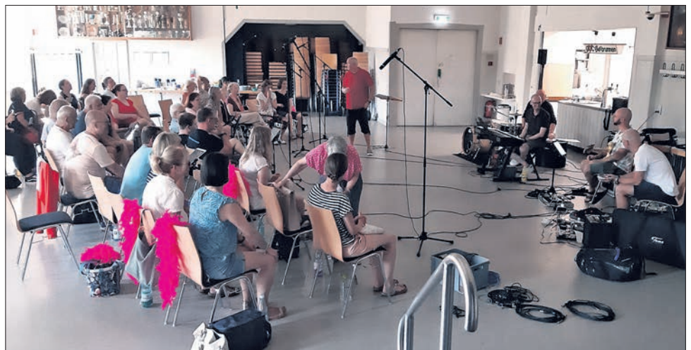
Generalprobe von 20vor8Chorisma mit Band im Vereinssaal.