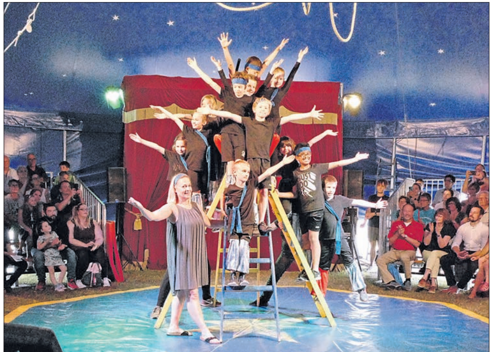
Ein begeistertes Publikum applaudierte beim Schlussbild der Leiter-Akrobatik.

Sonntag: Der Kleintierzuchtverein Bremthal freut sich über Besucher bei der Hinkelskerb , Beginn mit Live Musik ist um 11 Uhr an der Wildsächser Straße. Um 18 Uhr verbreitet Helt Oncale Louisiana-Sound im Biergarten der „Wunderbar“ am Stadtbahnhof. Die letzte Vorstellung von „ Trink oder stirb “ beginnt um 19.30 Uhr auf Burg Eppstein.