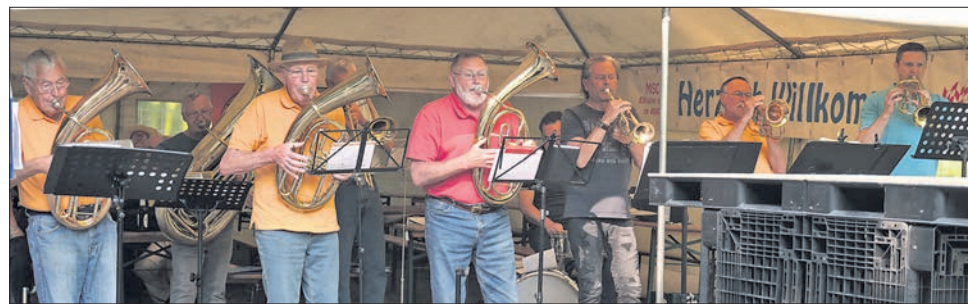
Die Ehlhaltener Blaskapelle beim Kohlenmeilerfest im Juni 2023.

Dieses Jahr besteht die Blaskapelle seit 100 Jahren, Grund genug ein kleines Fest zu feiern. Die Musiker laden deshalb zu einem Frühlingsfest am Sonntag, 9. Juli ab 11 Uhr auf dem Dorfplatz in Ehlhalten ein. Sie versprechen ihren Gästen gesellige Stunden, bei denen auch musiziert und in alten Erinnerungen geschwelgt wird. EZ