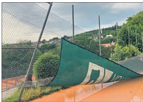
Sturmschäden beim TC Eppstein