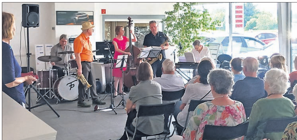
Das „Main Swing Trio“ and Friends teilten ihre Liebe zu Swing und Jazz mit dem Publikum bei Jazz im Autohaus.