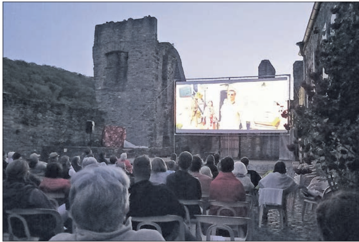
Das größte Wohnzimmer Eppsteins beim Kinosommer im Burghof.

Inhaltlich bot der Film aus dem Jahr 2022 einiges: Dorothea (Iris Berben) heiratet ihren Pflegesohn René (Justus von Dohnányi). Dieser Umstand nagt am Familienfrieden. Auf der Kanareninsel Lanzarote gibt es letzten Endes nicht nur Malvasier, sondern auch Lebensbeichten. Nicht einmal der Griff in die Keksdose, deren knuspriger Inhalt mit einer zer-