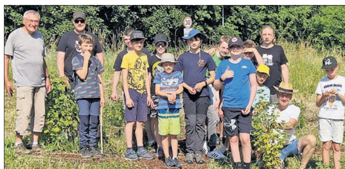
Action Rangers auf der Beerewiese.