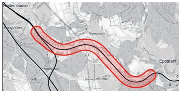
Gleisarbeiten im Streckenabschnitt der Bahnlinie zwischen Eppstein und Niedernhausen. Grafik: DB Netz AG

Die Deutsche Bahn AG führt in der Zeit vom 7. Juli bis 18. August Gleisenerneuerungen im Streckenabschnitt zwischen Eppstein und Niedernhausen durch. Gebaut wird in den Wochen vom 7. Juli bis zum 18. August. In dieser Zeit könne es zu erhöhten Lärm- und Staubbelastungen kommen, teilt die Bahn mit. Außerdem will die Bahn zeitweise einen Ersatzverkehr mit Bussen einrichten.