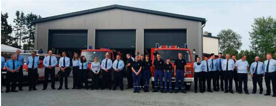
Einweihung neues Feuerwehrhaus Hambach/Orlen im September 2021