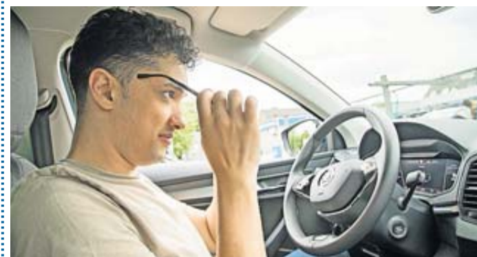
Auf geht's: Endlich ist der Führerschein in der Tasche, aber in der Probezeit darf man sich keine groben Schnitzer erlauben. Auch die etwaig anderen Regeln für Fahranfänger im Ausland beachten diese besser.