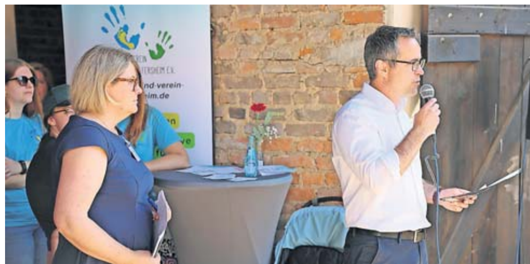
In der Marktscheune konnten sich die Eltern eingehend über die verschiedenen Kinderbetreuungseinrichtungen informieren.

Zahlreiche junge Familien bei Babyempfang