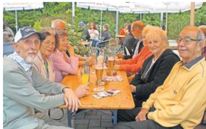
Auch diese Gäste genossen auf der Terrasse die entspannte Atmosphäre.