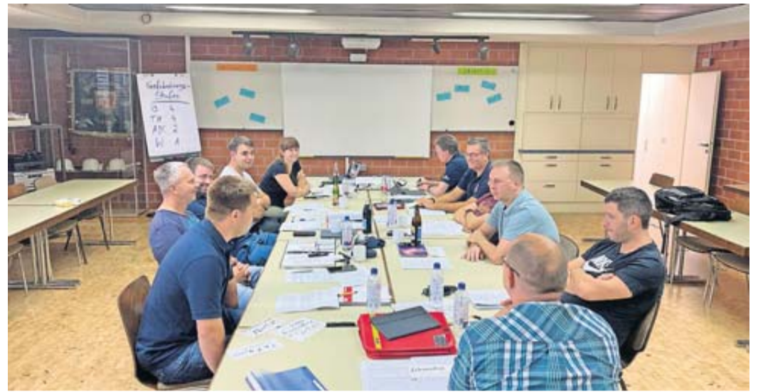
Die Ergebnisse fließen in die Erstellung des neuen Bedarf- und Entwicklungsplans.

Führungskräfte der Feuerwehr Rosbach planen für die Zukunft