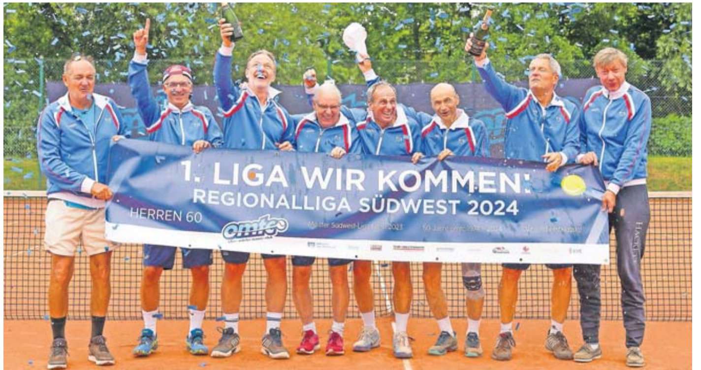
Die Spieler sind stolz auf ihren Erfolg.

OMTC Herren 60 steigen in die höchste deutsche Spielklasse auf