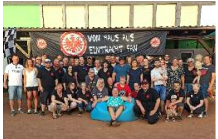
Bild oben: gelungene Saison-Abschlussfeier des EFC Adlerrauge - Bericht siehe Seite 4!