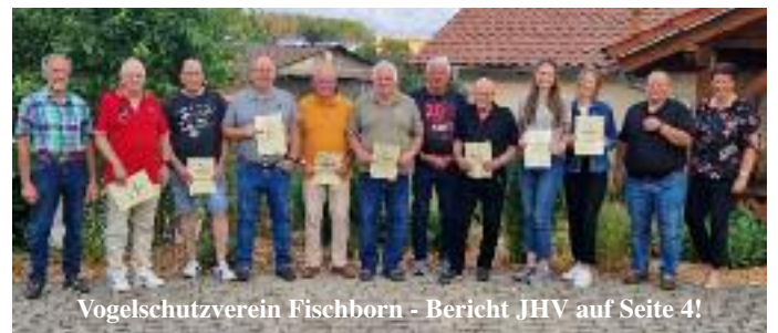
Vogelschutzverein Fischborn - Bericht JHV auf Seite 4!

Heute beginnen die Birsteiner Fußball-Gemeindemeisterschaften, ausgerichtet von der KSG Wüstwillenroth/Lichenroth. Spielplan siehe Innenteil!