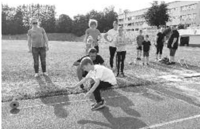
Das Foto zeigt einen Jungen beim Standweitsprung