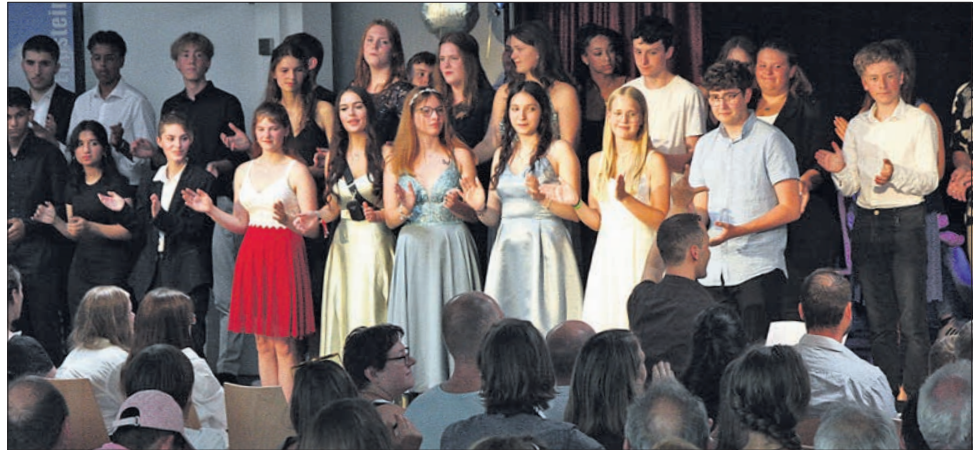
Mit dem Song „Happy“ nahmen die Schüler des Real- und Hauptschulzweigs von ihrer Schulzeit an der Freiherr-vom-Stein-Schule Abschied.