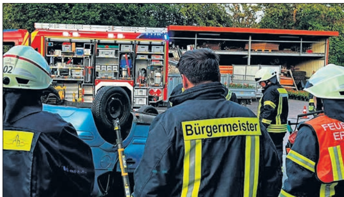
Eppsteins Feuerwehren im Einsatz.