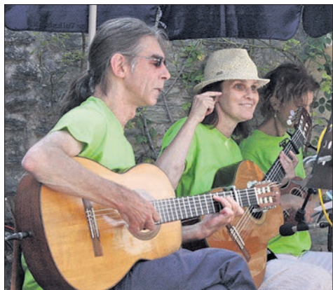
Das Lehrerensemble tritt auch beim Fest der Partnerstädte im September auf.

Bei fast afrikanischer Hitze mit wenig Schattenplätzen – ein angenehmer Wind verschaffte etwas Kühlung – warteten die Kinder mit Hin-