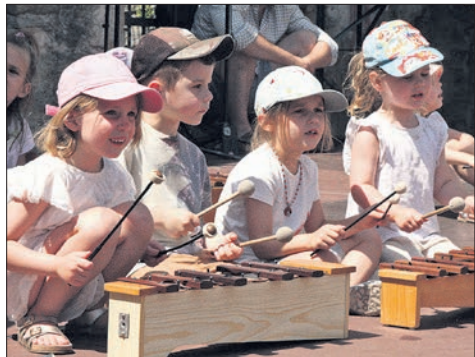
Auf dem Xylophon geben die Kinder den Takt der Karawane vor.

Die musikalische Weltreise der Kindergruppen begann in Italien mit einem Folkloretanz zum Lied über „Toni Maccaroni“, führte über