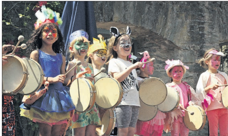
In Masken und Kostümen bevölkern wilde Tiere aus Afrika die Bühne.