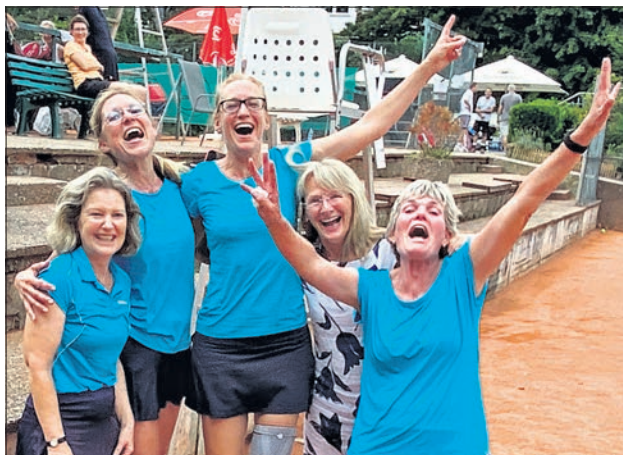
Die Damen 50 setzten alles auf Sieg und hatten Erfolg – große Freude nach dem Sieg über Ober-Eschbach..

sicherer Doppel-Punkteliere war. Doch wie erwartet dominierte Ober-Eschbachs Nummer 1 auch im Doppel das Spiel und schnell lagen die Eppsteinerinnen mit 2:6 im Rückstand. Doch man blieb ruhig und überlegt, variierte das Spiel und es gelang, was anfangs unmöglich schien – das Spiel drehte sich. Auf Platz 2 sah es genau andersherum aus. Nach gewonnenem ersten Satz lagen Katrin und Joanne mit 1:4 im zweiten Satz zurück. Doch sie fanden zurück zu ihrem Spiel und besiegten ihre Gegnerinnen auch in Satz 2 knapp mit 7:5. Das Unentschieden war damit schon sicher, als im ersten Doppel Steffi und Conny Satz 2 mit 6:4 für sich entschieden und in den entscheidenden Match-Tiebreak mussten. Auch dort führte zunächst Ober-Eschbach mit 4:1, die Eppsteinerinnen ließen sich aber nicht aus der Ruhe bringen, kämpften sich wieder heran und verwandelten den ersten Matchball