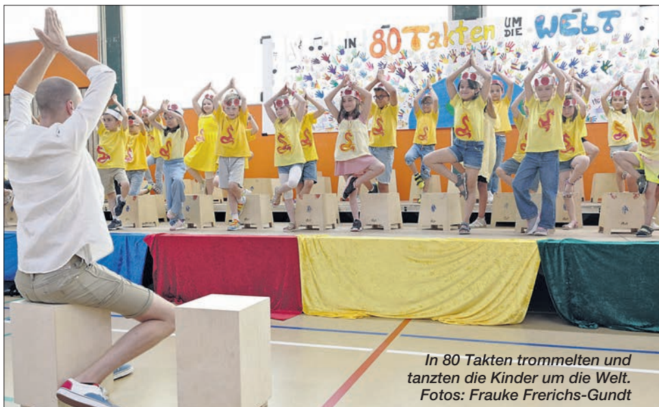
In 80 Takten trommeln und tanzen die Kinder um die Welt.

Auch die Spielstationen auf dem Schulge-