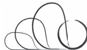
Kulturkreis Eppstein e.V.

im Wandel begriffen.“ Das Logo sei „in die Jahre“ gekommen, schreibt Quack, neue, jüngere Mitglieder im Vorstand haben nun ein neues Logo entworfen. „Es greift die universelle Grundform, den Kreis, auf und spiegelt die Überschneidungen der Fachgebiete in einem großen Ganzen“, schreibt Quack, das neue Logo beziehe sich auf das Vorgänger-Logo und gebe mit der Darstellung einer ‚Unterschrift‘ als Basis das Wesentliche wieder, „die Offenheit für ein modernes, vielseitiges Programm. Die symbolische Stilisierung ist variabel einsetzbar, die locker leichte Eleganz ist überzeugend frisch gelungen.“ Sie wünsche dem Logo, so Quack, „trotz Wandel der Moden eine vielseitige Langlebigkeit.“ EZ