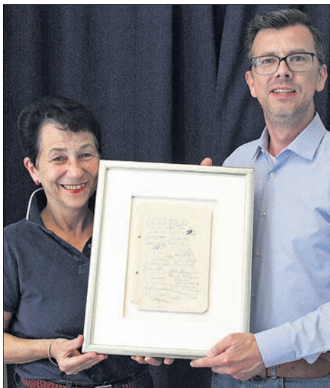
Der seinerzeit improvisierte Wurst-Pappdeckel-Vertrag hat einen professionellen Rahmen erhalten, der vor Licht und Luftfeuchtigkeit schützt.

Bislang lag das Zeitdokument geschützt zwischen Aktendeckeln. „Nun wollten wir es unseren Mitgliedern präsentieren, um es für die ‚Nachwelt‘ zu retten“, sagen die beiden und ließen es professionell rahmen. Museumsglas schützt vor Lichteinfall, damit die Schriftzüge