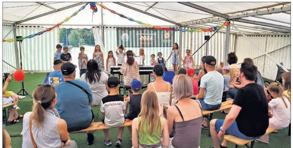
Die „Gummibären“ feierten ihren ersten Geburtstag mit einem Chorkonzert.

10.00 Uhr Einschulungsfeier in der Sporthalle der Freiherr-vom-Stein-Schule