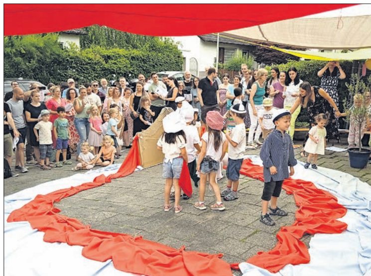
Menschen aus 18 Nationen feierten zusammen beim Kita-Sommerfest.

Der Förderverein nahm an seinem Verkaufstand fleißig Geld für den Kindergarten ein. Im nächsten Jahr soll mit den Spenden wieder ein gemeinsamer Ausflug unterstützt werden. Dieses Jahr