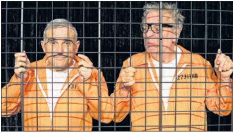
Siggi und Horst berichten aus dem Seniorenknast.