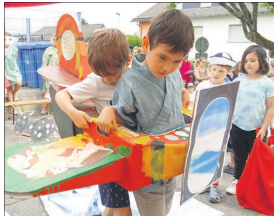
Zwei kleine Piloten hoben im originellen Flugzeug aus Pappkarton ab.

führte er zur Wiesbadener Fasanerie. Gleichzeitig wurden Turnmatten im Turnraum gesponsert und der „Pflaster-Kurs“ mit ausgebildeten Rettungssanitätern für die Vorschulkinder finanziert.