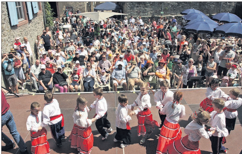
Volles Haus beim Fest der Musikschule im Burghof. Auf der Bühne tanzen die Kinder Folklore.

gabe geduldig auf ihren Auftritt oder verfolgten gebannt, die Tänze und Lieder der anderen Gruppen. Manche Eltern wirkten ungeduldiger als ihre Sprößlinge. Für alle gab es zwischen den einzelnen Stationen und am Ende nach dem „Enten-Rap“ zur Musik „We will rock you“ der Band Queen großen Applaus im restlos gefüllten Burghof. Selbst die Tribüne auf dem Mainzer Keller war bis auf den letzten Platz besetzt.