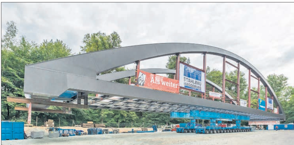
Die rund 600 Tonnen schwere Stahlbogenbrücke wurde als Fertigbauteil angeliefert und in die Lücke in der L3027 über den Bahngleisen bei Niedernhausen eingesetzt.

Voran geht es derzeit an der Brückenbaustelle an der L3027 in Niedernhausen. Am 1. Juli wurde das 71 Meter lange und 12 Meter breite Brücken-Fertigbauteil an seinen Platz