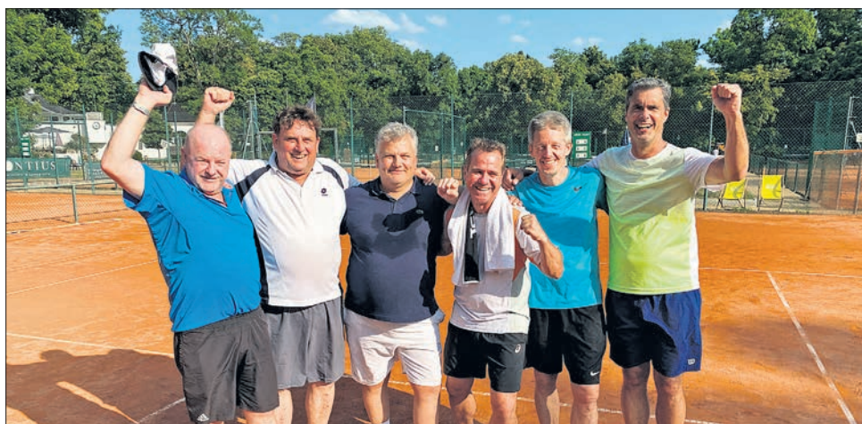
Jubel beim TC Eppstein: Die Herren 50 steigen in die Gruppenliga auf.

sicher mit einem gelungenen Schmetterball zum 10:7. Zum zweiten Mal in Folge freuen sich die Damen 50 des TC Eppstein/TC Diedenbergen damit über ihren Titel als Hessenmeisterinnen.