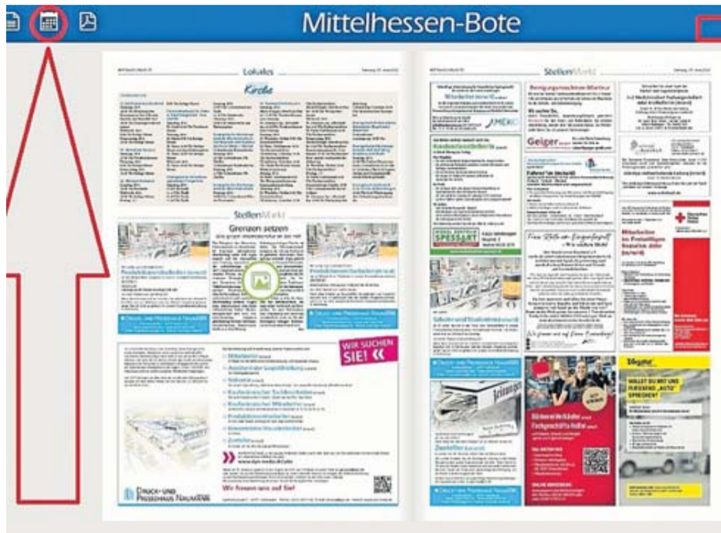
Das E-Paper des BOTEN hat viel zu bieten, wie den Zugriff auf alte Ausgaben über das Kalender-symbol oder die Volltextsuche.

Wie Sie von der E-Paper-Ausgabe profitieren können