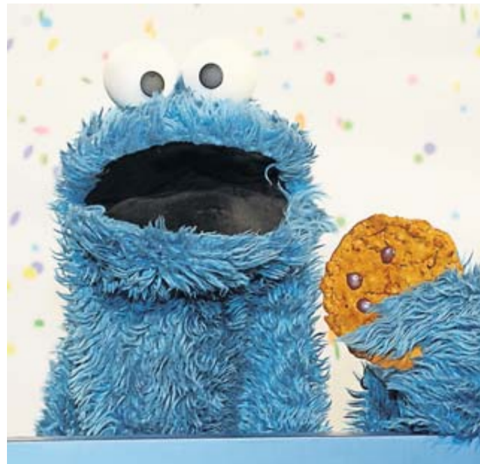
Das Krümelmonster ist bei der Wahl seiner Kekse nicht wählerisch - Internetsurfer sollten es bei der Wahl ihrer Cookies sehr wohl sein.

Mmh, Kekse! Wer im Internet surft, wird immer wieder mit Cookies konfrontiert. Knapp drei Viertel (73 Prozent) der Menschen ab 16 Jahre in Deutschland trauen sich laut einer Umfrage von Bitkom Research auch zu, den Begriff zu erklären. Jeder und jede Fünfte (21 Prozent) hat zwar schon von Cookies gehört, räumt aber ein, nicht zu wissen, was damit gemeint ist. Die übrigen sechs Prozent machten keine Angaben oder gaben an, noch nie von Cookies gehört zu haben. Für all jene, die nichts mit Cookies anfangen können: Die digitalen Kekse sind kleine Textdateien, die beim Surfen von einer Website auf dem In-