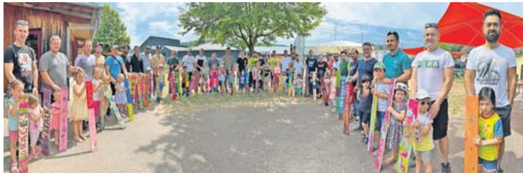
Viele bunte Holzlatten haben Väter mit ihren Kindern gestaltet. Sie werden künftig die Außenbegrenzung der Kinderburg Wiesenzauber verschönern.

Familienfest der Kinderburg Wiesenzauber – Holzlatten für Umrandung gestaltet