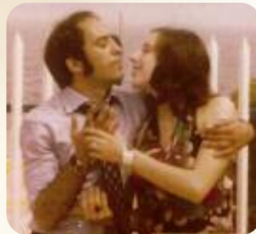
Untersotzbach, im Juli 2023