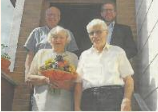
Streitberg, im Juni 2023

... sagen wir unseren Kindern, Verwandten und Freunden für ihre Hilfe, Glückwünsche und Geschenke sowie die vielen persönlichen Besuche anlässlich unserer