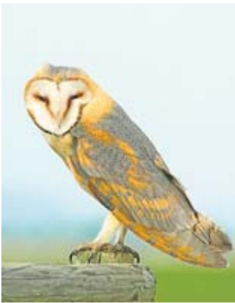
Schleiereule in der Nähe von Echzell.

Aktion des Landes finanziert Unterstützung bedrohter Arten