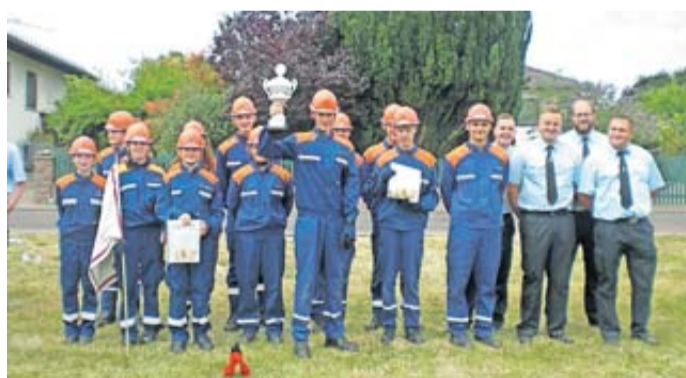
Die Gruppe der Jugendfeuerwehr Trais-Münzenberg I jubelte über den errungenen Stadtpokal.

Wettkampf der Jugendfeuerwehren in Ober-Hörgern