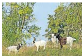
Schafe und Ziegen arbeiten Hand in Hand in der Landschaftspflege.