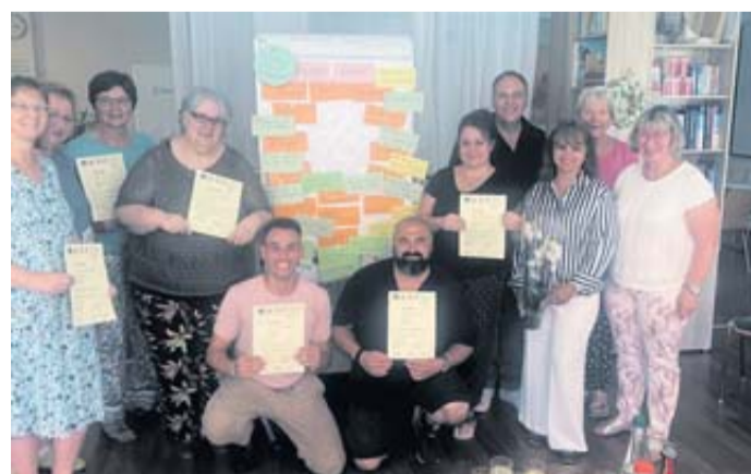
Die sechs ausgebildeten Ehrenamtlichen mit den neuen Zertifikaten.