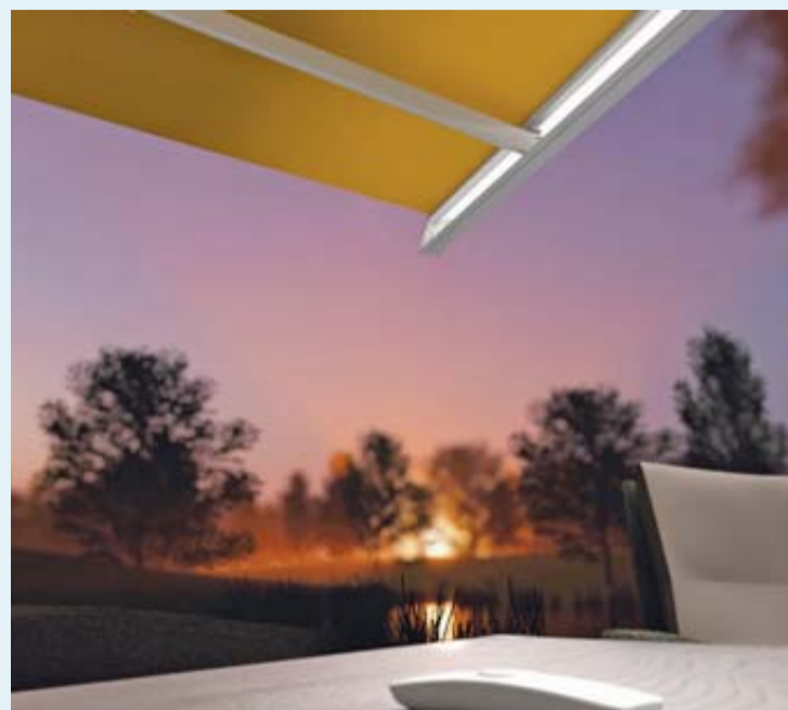
Integrierte LED-Streifen am vorderen Ausfallende einer Markise sorgen für eine gute Ausleuchtung der Terrasse.

Hochwertige Markisen sind mit Motorantrieb ausgerüstet, denn wer möchte sich schon beim Relaxen von